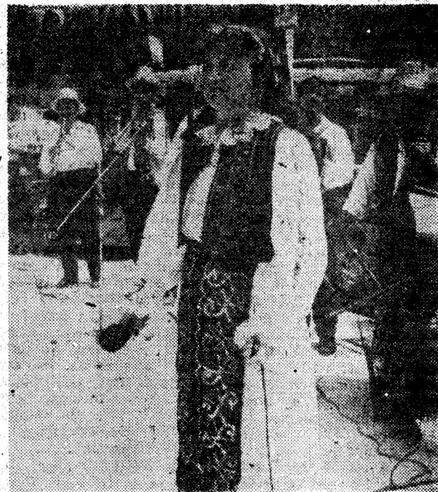
„Mândru-i portul popular și cântecul moțesc” — pare să spună solista din imagine.