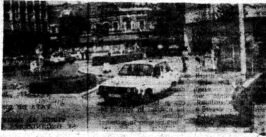
80 de amenzi, într-o singură zi, în același loc și pentru aceleași fapte. Cam mult, nu-i așa, stămați conducători auto din Deva?

semnificației indicatoarelor de circulație demonstrează cum acești conducători auto conduc... după legea lor. În fața acestei situații, Poliția rutieră a municipiului Deva a hotărât să aplice legea... circulației. Astfel, în cursul zilei de sâmbătă, 15 iunie a.c., peste 80 de conducători auto au suportat amenzi pentru nerespectarea indicatoarelor de circulație în această intersecție. Aviz amatorilor!