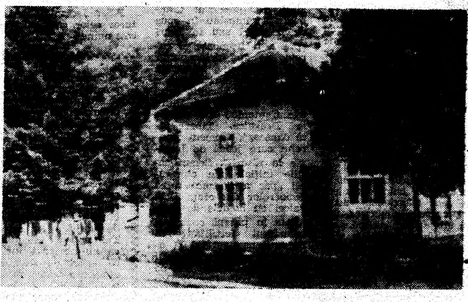
Primăria din Buceș