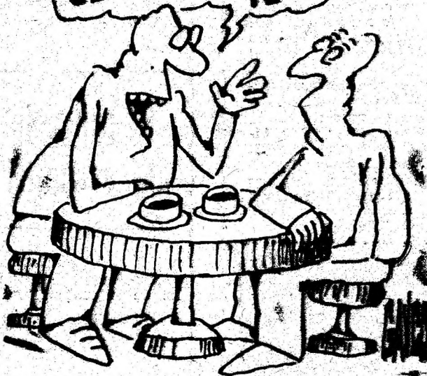
Desen de CONSTANTIN GAVRILA

VĂD CĂ AU CĂȘTIGAT ȘI UNII ȘI ALȚII. ACUM SUNT TARE CURIOS SĂ VĂD CE VOMI MAI PIERDE NOI.