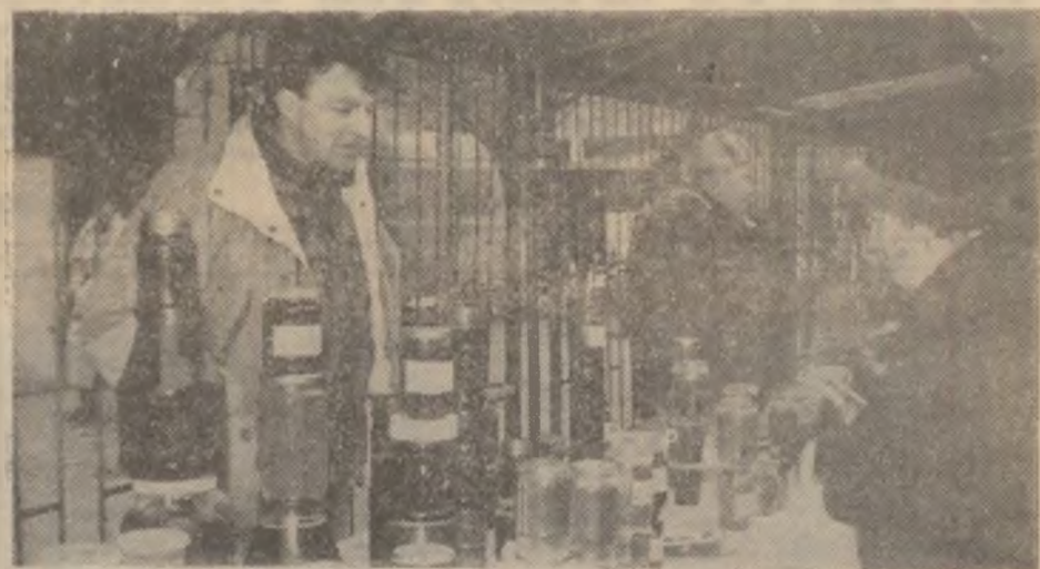
Mierca — un produs cu atâtea calități, căutat în piața agroalimentară a Devei.

Cuvintele din titlu au sensuri și semnificații diverse, care rezultă din contextul în care sunt utilizate.