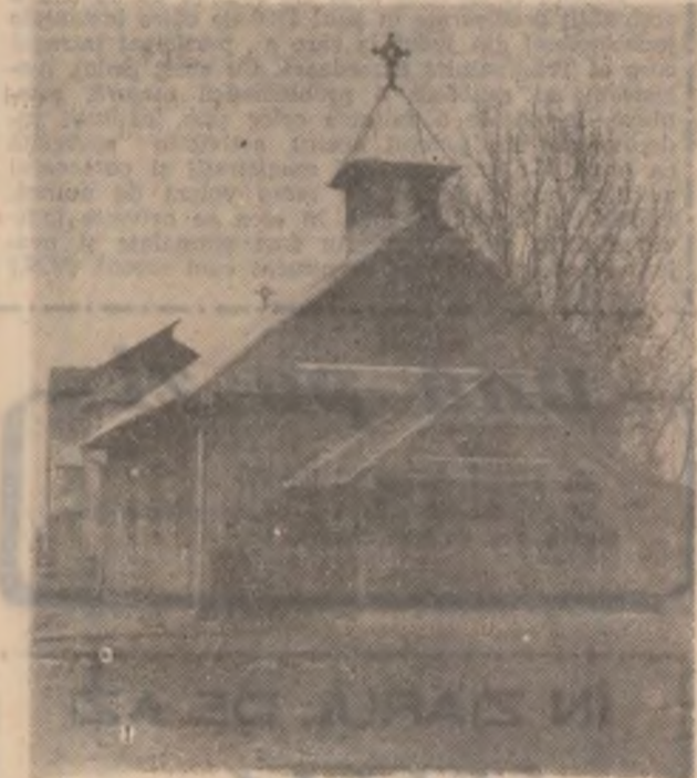
Biserică de cartier.