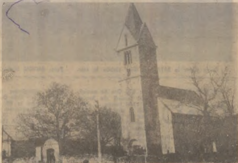
Biserica monument istoric din Sântămărie Orlea, construită din piatră, în sec. al XIII-lea, în stil gotic, pictată în primele decenii ale secolului al XV-lea. Este unul dintre cele mai vechi monumente de arhitectură românească, ce a aparținut obștii țărănești din Sântămărie Orlea, unde stăpânea familia cnejilor Cindea.