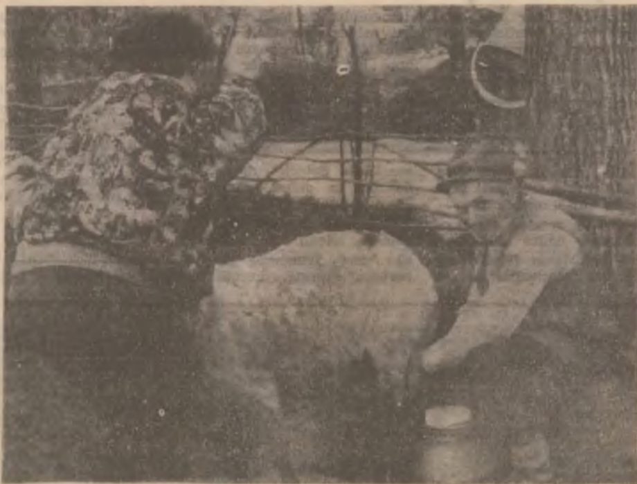
Decât șomer la RATA, mai bine cioban la tata.

Și alte „dureri“ bătăuie în domeniu. Legalizarea bacșișului este considerată ca aberantă, în timp ce contractarea de către unitățile spitalicești a unor prestări de servicii (de efectuare a curățeniei, reparațiilor, contabilității, serviciilor de farmacie) poate concura benefic indolența unor salariați în privința calității anumitor lucrări și prestații. Se așteaptă încă legi și măsuri care să asigure protecția medicului, să-l ferească de tentația banului necuvenit, să-i stimuleze activitatea, să-i așeze muncă nobilă în hotarele fișei, dincolo de ale funcționarului public, unde este plasat acum. Este nevoie și de introducerea unui sistem solid și coerent de asigurări sociale pentru sănătate, de întărirea autorității Colegiului Medicilor și nu în ultimul rând de salarizarea corespunzătoare a medicilor, a întregului personal din domeniul sănătății. Sănătatea națiunii — mai presus de orice.