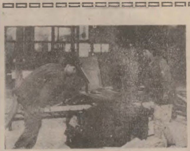
S.C. Sarmismob S.A. Deva. Se lucrează, pe flux, la mașina de rindeluit.