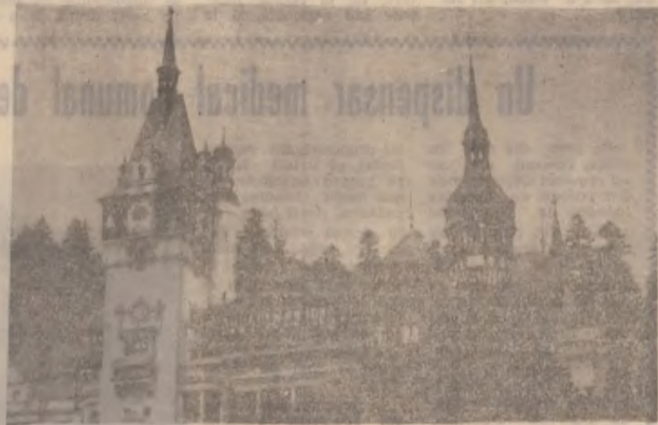
Castelul PELEȘ — Sinaia

tate a cercetărilor cu urmare a diminuării fondurilor alocate, retragerii specialiștilor militari din institutele de profil și slabei colaborări dintre institutele de cercetare și agenții economice în vederea realizării la termen a modelelor și prototipurilor. CSAT a evidențiat, în ședința sa de luni, existența unui volum important de obiective nefinalizate în sectorul producției de apărare. Cauzele au fost atât lipsa de fonduri ale agenților economici, cât și volumul mic de comenzi pentru acest domeniu. Membrii CSAT au apreciat că este necesară atragerea investitorilor străini pentru modernizarea tehnologiilor actuale și realizarea unor produse de tehnică militară competitive.