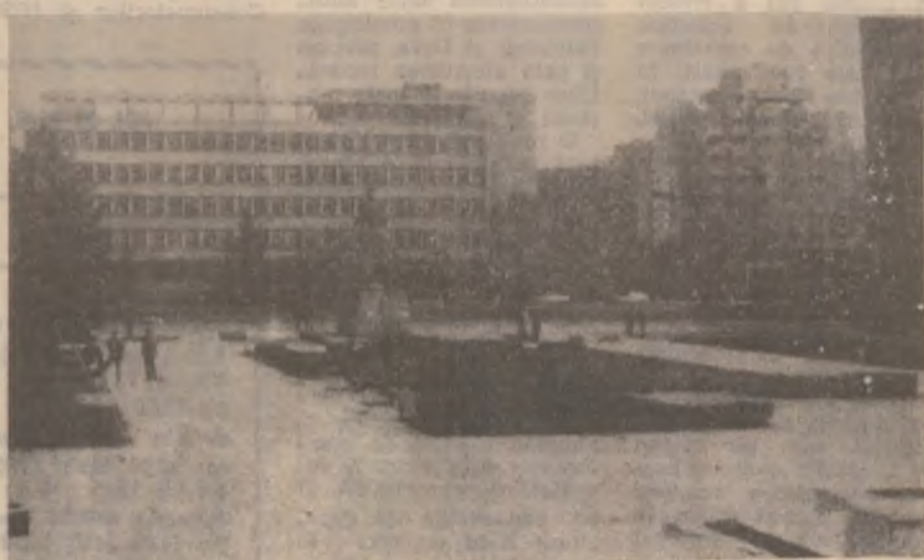
Vedere din Deva.