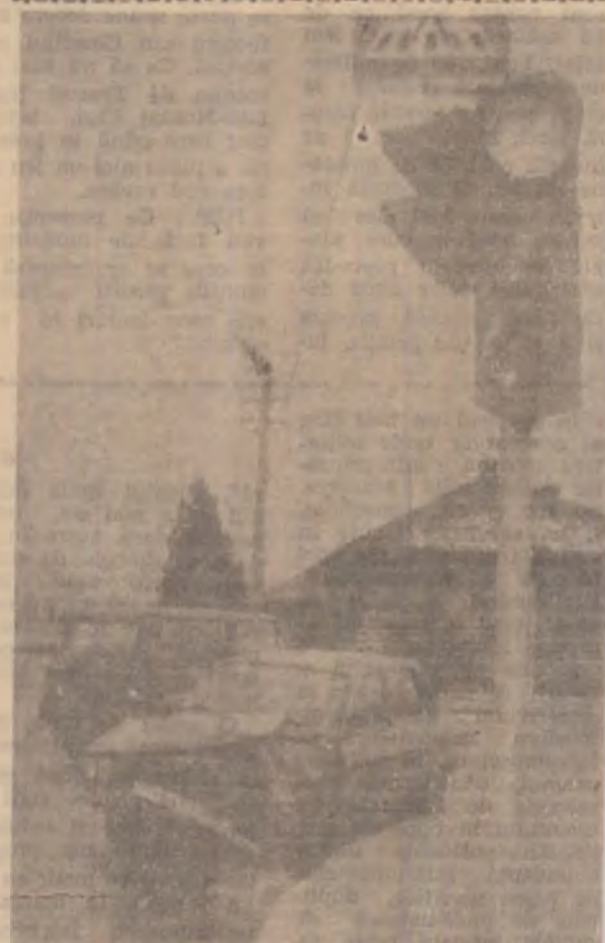
În intersecție se întâmplă multe, mai ales când conduci neatenți. Degeaba dăm vina pe „ceasul rău”

Agentele ziarului nostru asigură, la taxe rezonabile, publicarea cu maximă promptitudine a tuturor anunțurilor de mică și mare publicitate.