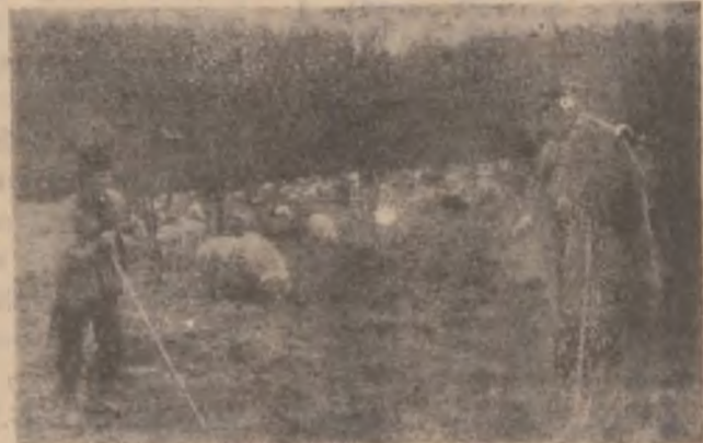
Cu oile la pășunat.

Pagină realizată de TRAIAN BONDOR