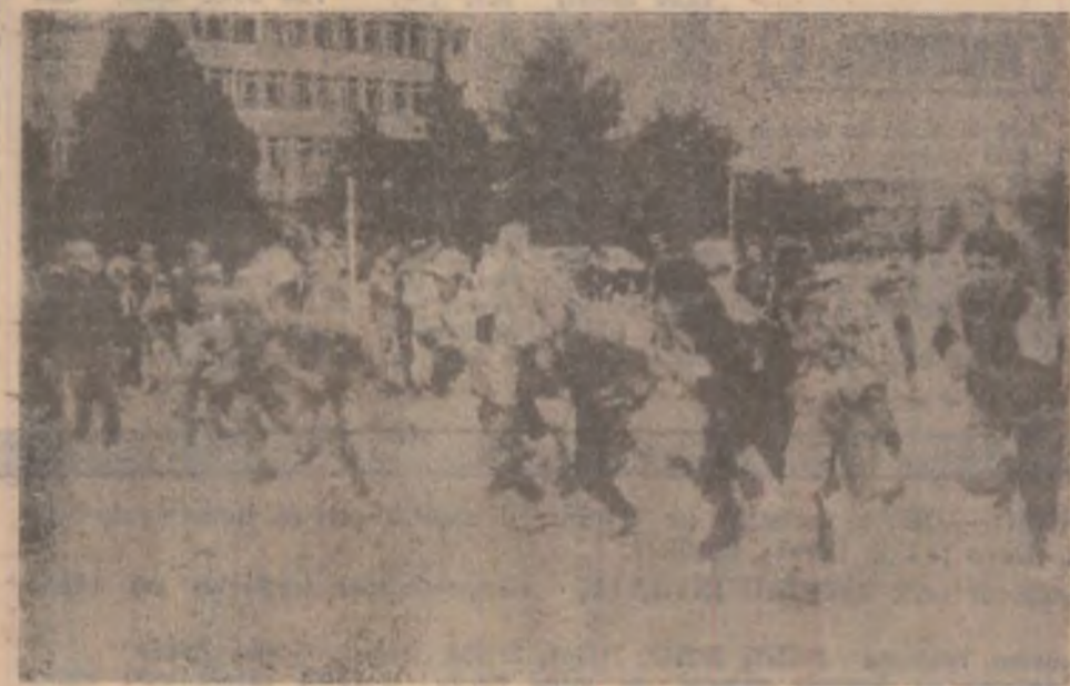
Crosul înseamnă sănătate iar pentru cei mici și o bună dezvoltare fizică.