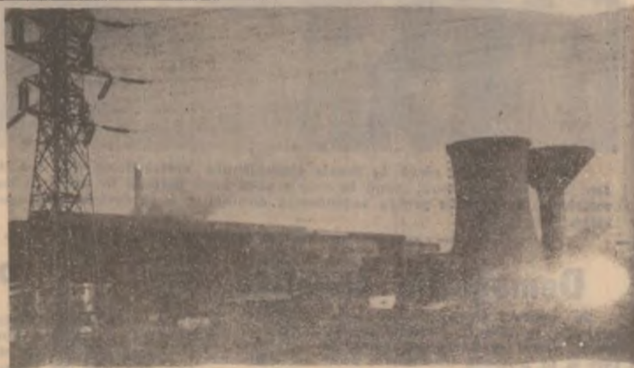
Vedere generală a laminoarelor de la S.C. Siderurgica Hunedoara. Ele poartă amprenta constructorilor de la ICSH.

Ideile și inițiativele Primăriei hunedorene în acest domeniu, al sprijinirii micului întreprinzător prin netezirea hățișului birocratic ce îi stă de-a curmezișul încă de la începutul afacerii, mi se par lăudabile, iar punerea lor în practică, generalizat, ar fi, până la urmă, în folosul tuturor.