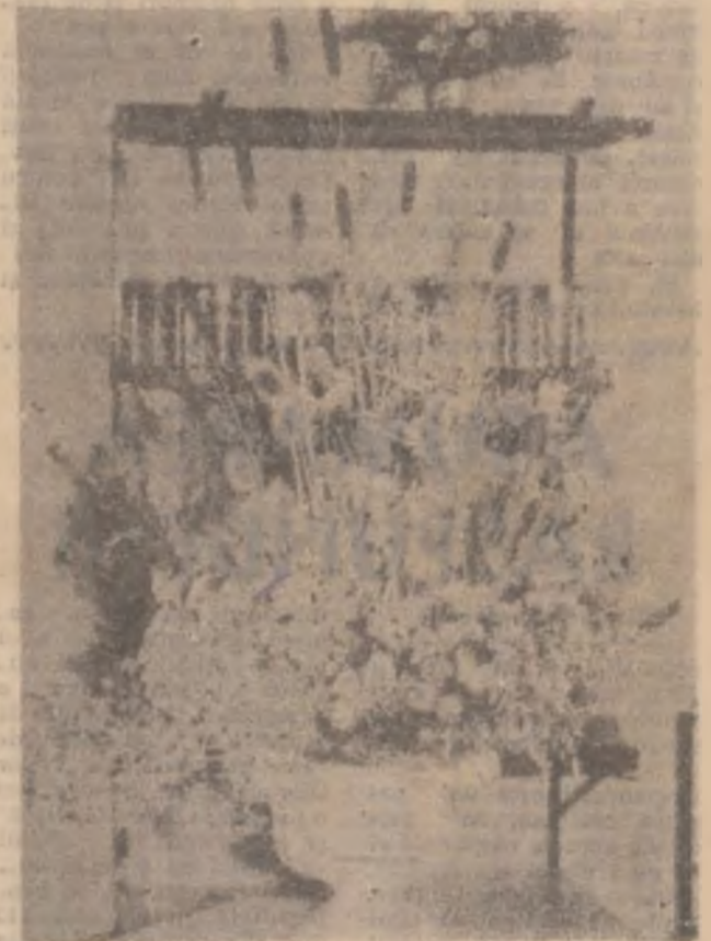
Flori pentru eroi. (Aranjament floral — Alin Burlacu — Simeria).