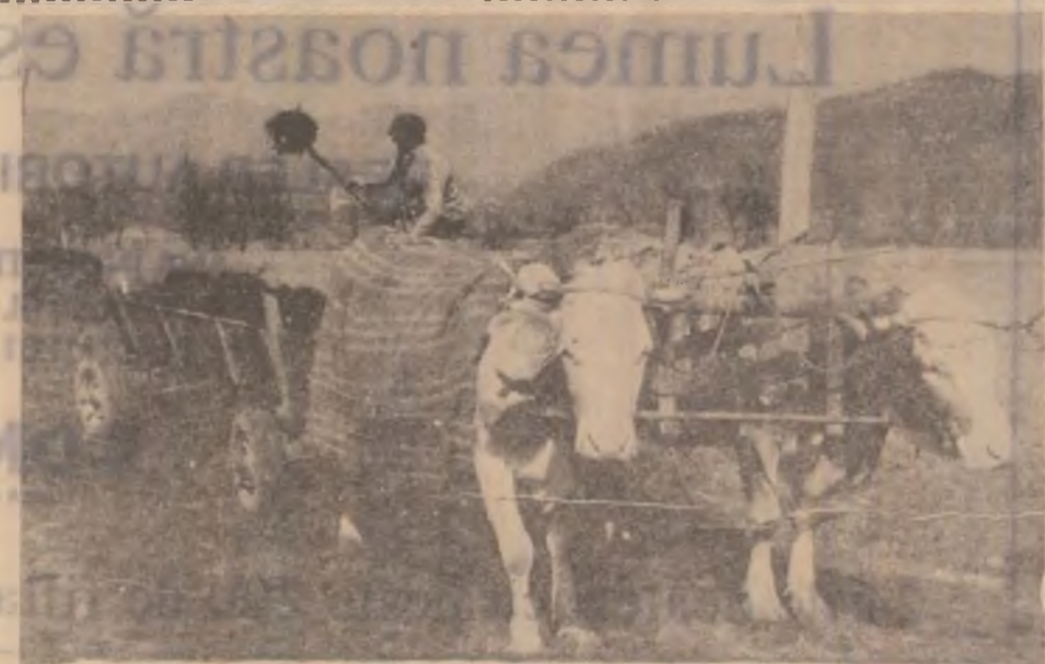
De nevoie, omul face agricultura cu ce are și cum poate.