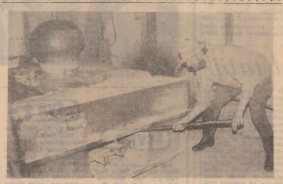
Fabricantul de iluzii.