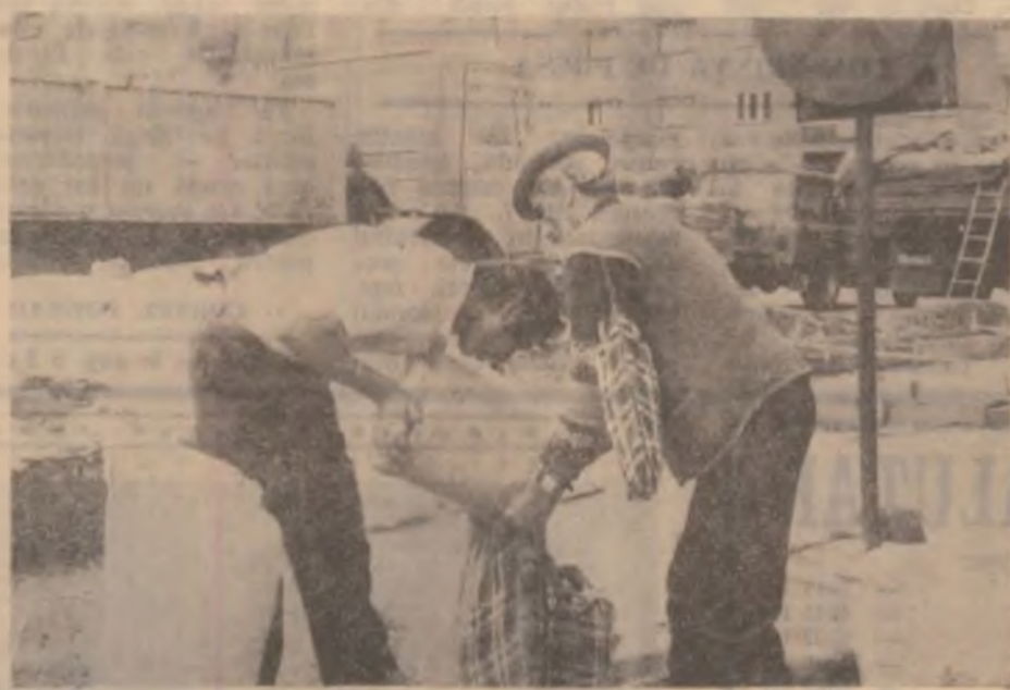
Stup / Economic de piață 1

La finalul întâlnirii s-a discutat amical, iar ziaristilor prezente la conferința de presă li s-a oferit câte un buchet de flori, marcând într-un mod mai aparte împlinirea unui an de la preluarea conducerii primăriei de către actuala echipă.