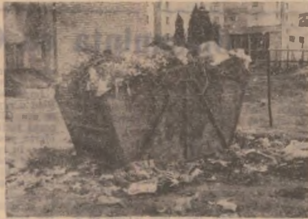
„Carte de vizită”.