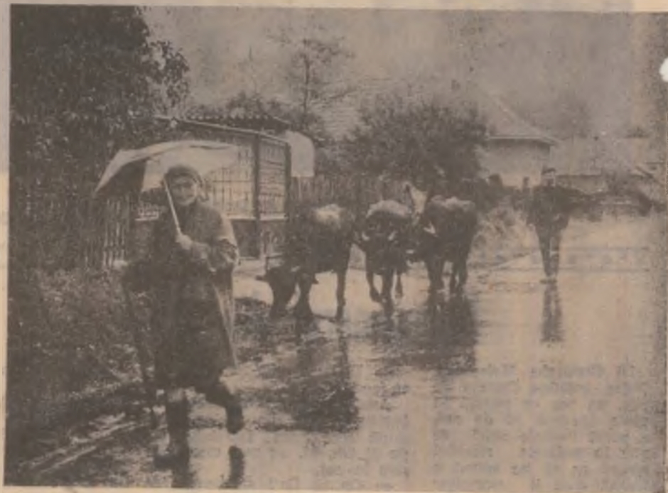
Pe ploaie ori pe soare, bivoli își urmează drumul și destinul. Atâția bivoli câți dețin locuitorii satelor Tomeștiului — mai rar!

Se află în evidență în prezent 76 de persoane handicapate, cu gradul III de invaliditate, 15 minori, proveniți din familii dezorganizate și incredințate din cauza dintre părinți, alți din minorii internați în case de copii și unul în plasament familial.