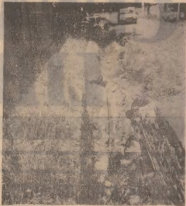
Strada Matei Corvin — Deva. Pe o porțiune de circa 100 de metri, zidul canalului s-a dărâmat. La o nouă ploaie alte necazuri pentru locuitorii străzii nu ezită să apară!

Probabil o să rugăm pe ministrul transporturilor, Traian Băscu, să se implice în curățarea efectivă a acestor poduri, pentru că proprietarii acestora — Drumurile Naționale și CFR-ul — au uitat să le decolmateze.