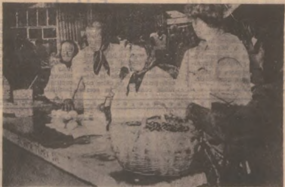
În piața Bradului bogat sortiment de lactate, legume, fructe ș.a.

stânga, se află rămășițele unor foste mese și scaune, un ansamblu ce era cândva un refugiu, un pas de odihnă pentru călători. Păcat că nu mai pot fi folosite în scopul pentru care au fost create, păcat că lasă o imagine contrastantă cu aspectul în general frumos și ordonat al urbei.