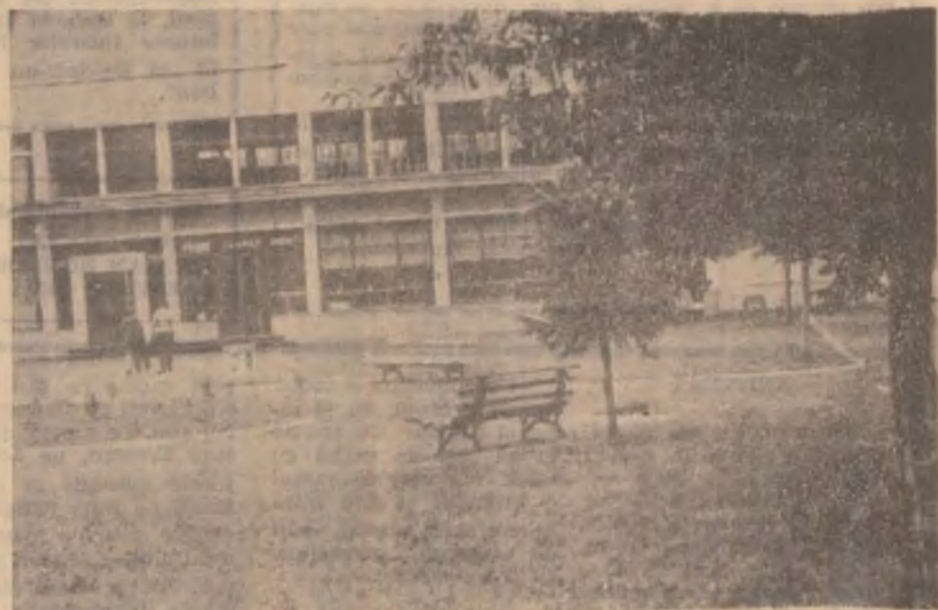
Condiții de confort și recreere în frumosul parc central din Vața.