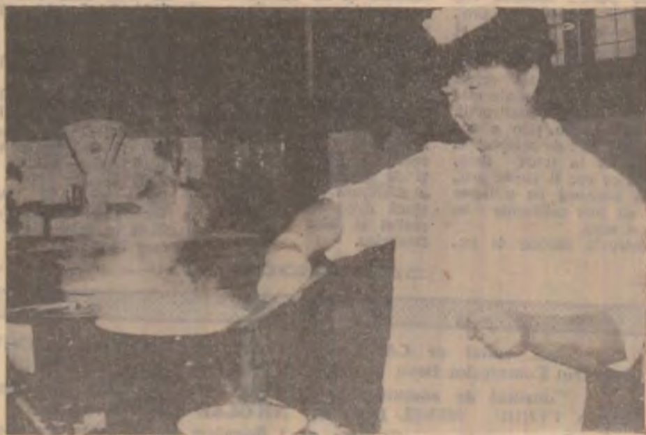
La „Restaurantul Moților“ din Brad se pregătește un bogat și divers meniu în fiecare zi.

— Ar fi foarte bine. Guvernul Clorbea, apli- cându și programul de reforma și restructurare — ar putea trece la pri- vatizarea totală a comer- țului. Noi am depus, încă cu multă vreme în urmă, documentele în acest sens. Când se va realiza actul respectiv și cum nu știm încă, dar îl așteptăm. (T.B.)