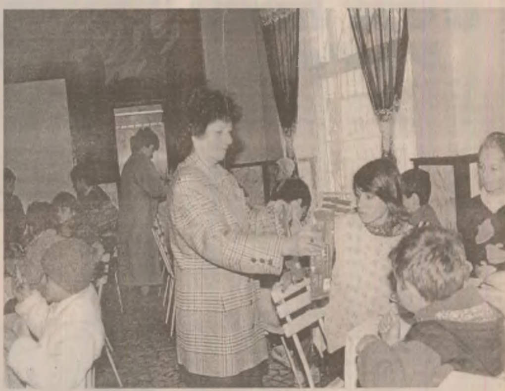
Se fac cadouri copiilor din Hațeg