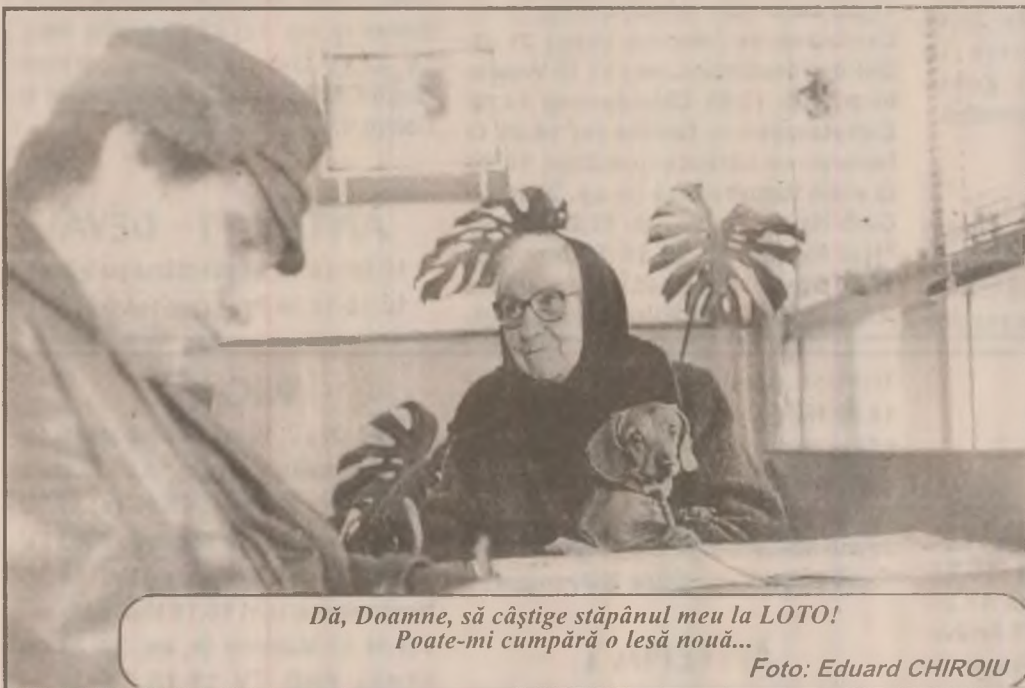
Dă, Doamne, să câștige stăpânul meu la LOTO! Poate-mi cumpără o lesă nouă...

Vechea listă a compensatelor urmează să fie revizuită conform recomandărilor organismelor internaționale.