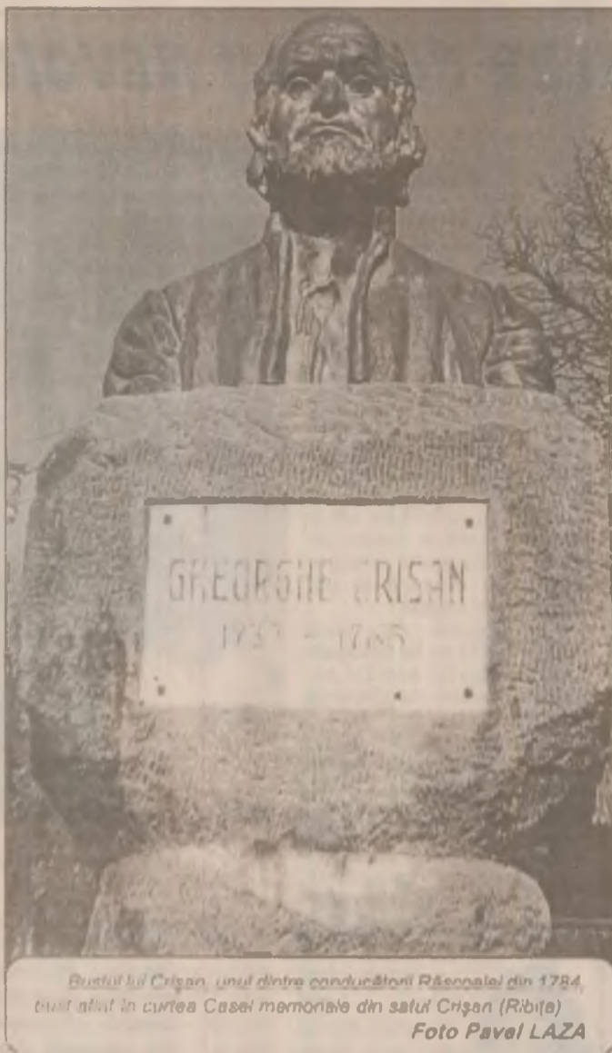
Bustul lui Cristan, unul dintre conducătorii Răscoalei din 1848, bustul aflat în curtea Casei memoriale din satul Cristan (Ribița)