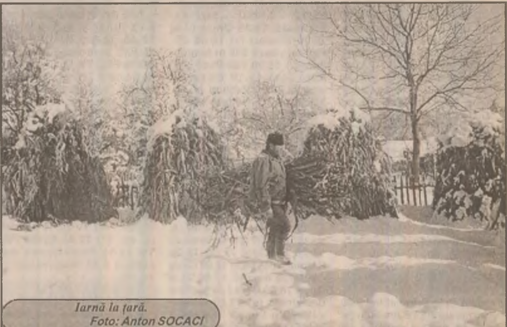
Iarnă la țară.

➤ S-a scumpit benzina. Majorarea TVA a condus și la scumpirea carburanților, benzina Premium ajungând la 3150 lei/litru. Ministrul finanțelor, Daniel Dăianu, este împotriva măsurii, iar ministrul comerțului și industriilor, Mircea Ciumara, a fost și mai categoric, avertizând cu demiterea conducerii Comapaniei Naționale de Petrol.