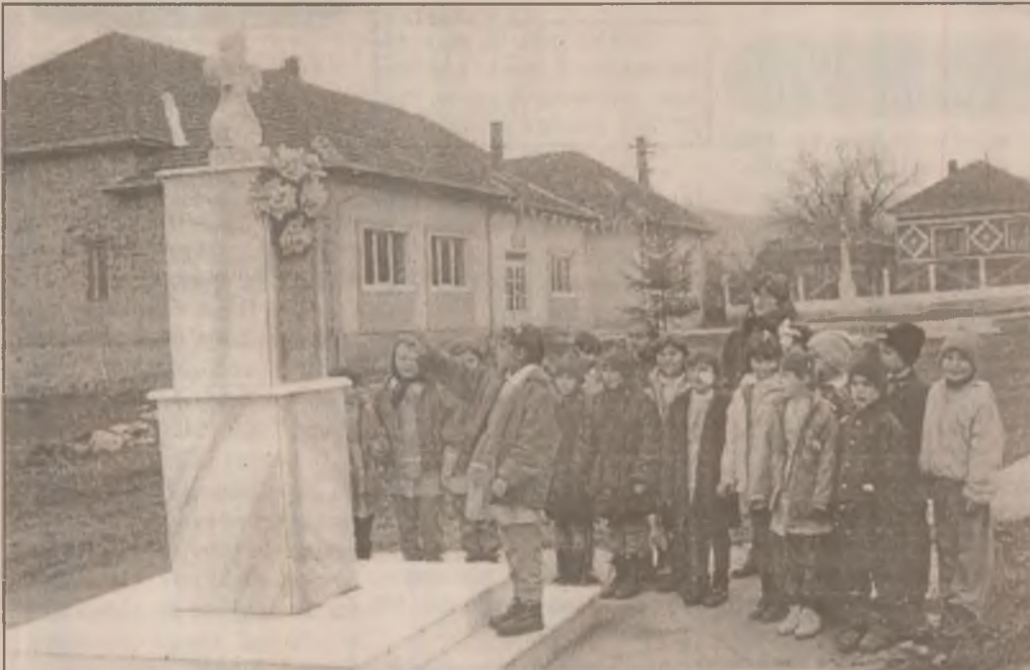
Lecția de istorie. Elevii Școlii generale din Boz la monumentul eroilor celui de-al doilea război mondial.