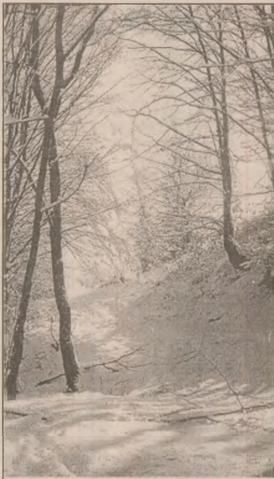
La munte, zăpada este încă "în putere".

Justiția și poliția trebuie să dețină codurile de acces pentru transmiterea de informații secrete prin intermediul Internet, conform unui acord realizat de miniștrii de Interne și ai Justiției din țările membre ale Uniunii Europene, relatează AFP. În cadrul unei întâlniri neoficiale desfășurate la Birmingham, reprezentanții Justiției și ai Ministerelor de Interne ale statelor UE au elaborat primele prevederi privind libertățile civile în cadrul rețelei Internet. Ei au avertizat asupra faptului că existența unor modalități de criptare care nu pot fi decodificate poate permite desfășurarea nestingherită a activităților rețelelor crimei organizate. "Trebuie să ne asigurăm că legea va putea fi aplicată și în ceea ce privește accesarea materialelor codificate", a afirmat britanicul Joyce Quim, ministru adjunct de Interne. "Nu vom putea lupta împotriva crimei organizate a secolului XXI cu echipamentele și metodele secolului XIX", a adăugat el. Reprezentanții industriei telecomunicațiilor se pronunță cu vehemență împotriva acordării accesului la cheile de decodificare către organele de stat, apărând ferm ideea de protejare a datelor private ale utilizatorilor. Una dintre soluțiile aflate în discuție în prezent este aceea ca toate codurile să fie stocate de agenții independente, care să ofere garanții ferme privind protejarea acestora. Pentru accesarea acestora, poliția și organele de anchetă ar urma să solicite aprobarea sistemului judiciar.