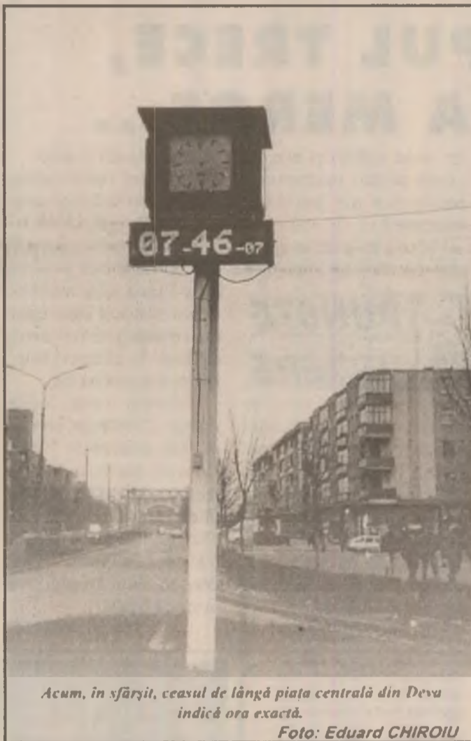
Acum, în sfârșit, ceasul de lângă piața centrală din Deva indică ora exactă.

Rubrică realizată cu sprijinul IPJ Hunedoara