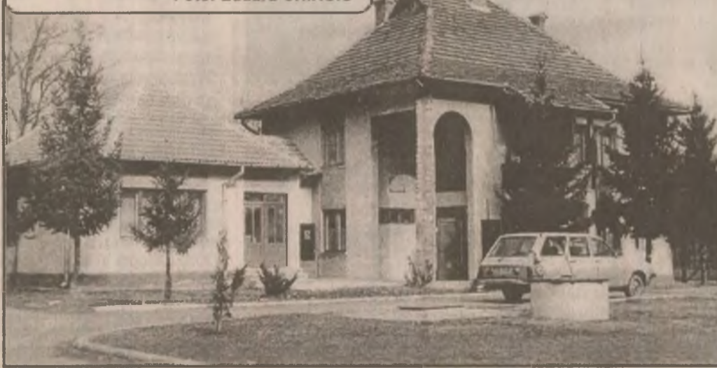
Dispensarul medical din comuna Romos.

Acum este momentul să cumperi ieftin din magazinele QUASAR! Pag. 7