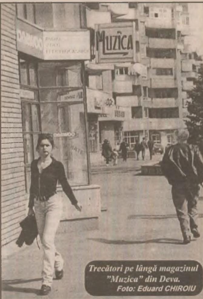
Trecători pe lângă magazinul "Muzica" din Deva.