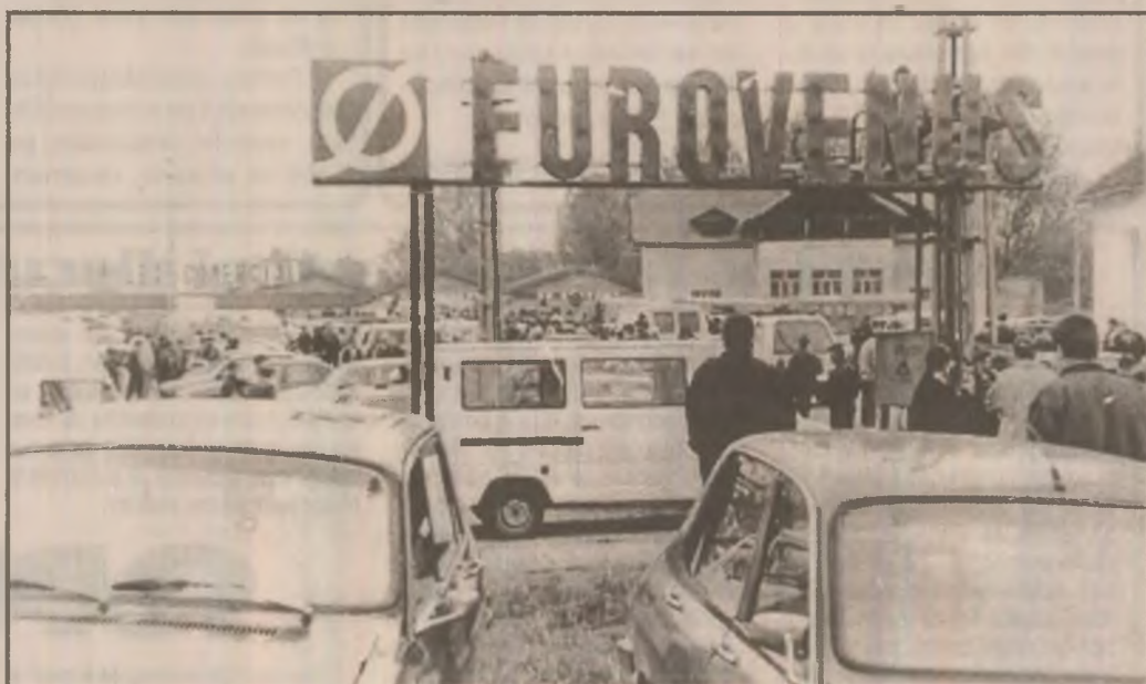
Prin târgul de mașini de la Sântuhalm.

Neimplicare? Asta să o creadă dumealor. Presa, acest câine de pază al societății, semnalează de ani de zile asemenea fapte. Și cum n-ar vorbi câtă vreme instituția fundamentală a statului - Parlamentul - îngăduie în rândurile sale escroci dovediți care au jefuit și jefuiesc nepedepsiți patrimoniul țării, devitalizează bănci, spoliază prin evaziune bugetul țării?