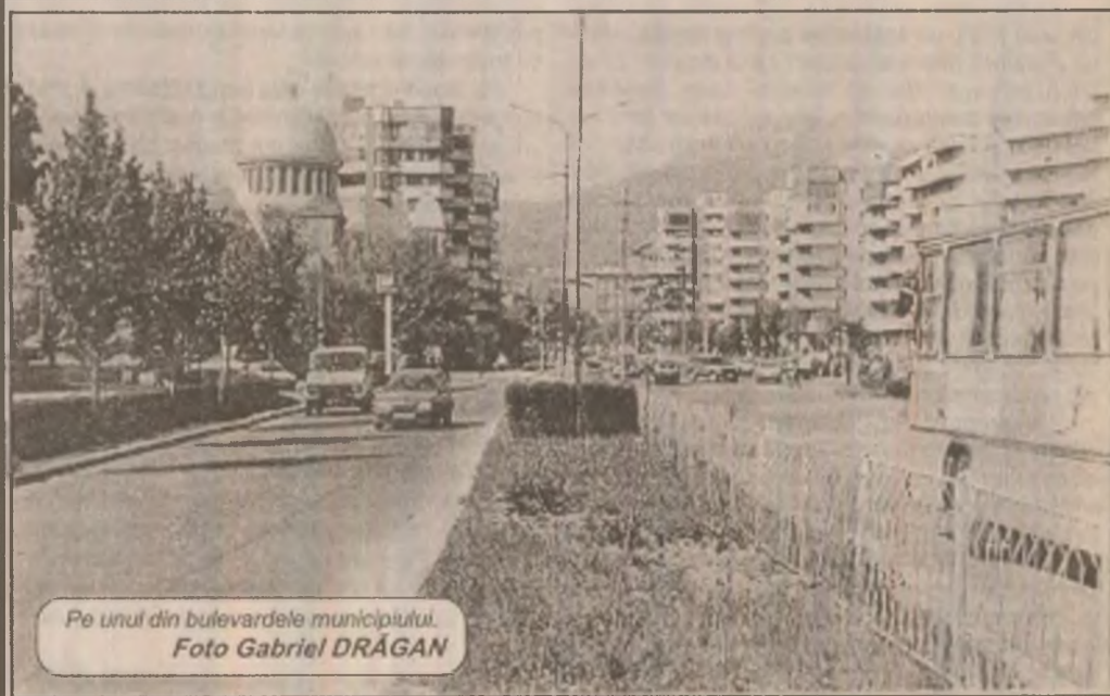
Pe unul din bulevardele municipiului.

multe feluri de pizza, spaghetti și alte produse culinare italiene. Pentru treaba asta a adus la Deva doi tineri ce au făcut curs de calificare chiar în patria pizzei și spaghettielor. Tinerii au pornit treaba și aceea, după un debut mai greu, a început să funcționeze, să atragă clientela. Dar, la un moment dat, a încetat brusc. De ce? Fiindcă cei doi au șters pe neștiute putina, ducându-se spre alte meleaguri, cine știe unde. Administratorul societății a adus un alt om ce știe să prepare faimoasa pizza și treaba a fost reluată.