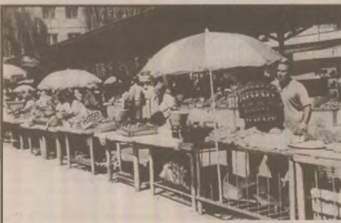
Piața centrală din Deva este plină cu fructe și legume de sezon. Lipsesc numai cumpărătorii.

Examenele se desfășoară după următorul grafic: pe 1 septembrie se susține lucrarea scrisă la limba și literatura română; pe 2 septembrie - lucrarea scrisă la limba și literatura maternă iar pe 3 septembrie - lucrarea scrisă la matematică. Rezultatele se afișează până în 5 septembrie (care e ultima zi). Între 8 și 10 septembrie se rezolvă eventualele contestații iar în zilele de 11 și 12 septembrie are loc redistribuirea candidaților. Acestea sunt datele comunicate de Direcția generală a învățământului preuniversitar din MEN pentru a înlătura unele informații eronate ajunse în teritoriu. (V.R.)