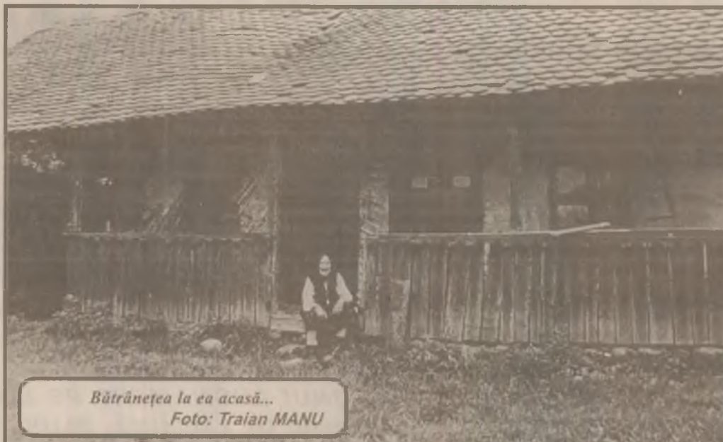
Bătrânețea la ea acasă...

Surpriza a fost aceea că după cum a aflat ulterior măsurătoarea s-a făcut în folosul altui proprietar, care se spune, deși nu este o condiție obligatorie ca dacă primești pământ să ai și animale, că nu ar fi în drept să i se atribuie acel teren. Firește că singura în măsură să decidă asupra situației terenului respectiv este comisia locală pentru aplicarea prevederilor Legii 18/1991. (N.T.)