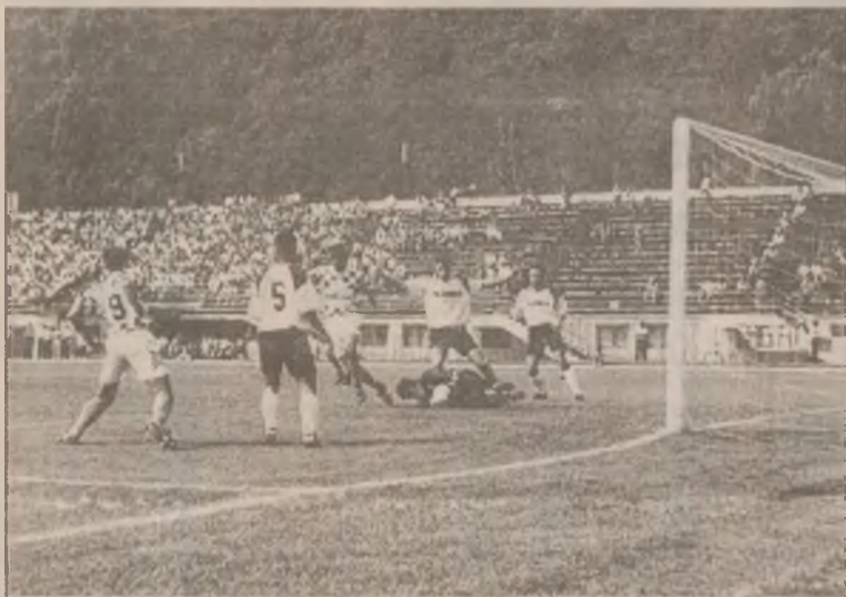
O nouă intervenție reușită a portarului lanu de la Drobeta. Fază din meciul Vega - Drobeta Tr. Severin.