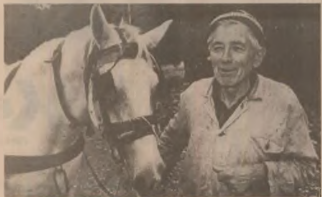
Cu ce lucrăm pământul? Cu calul.