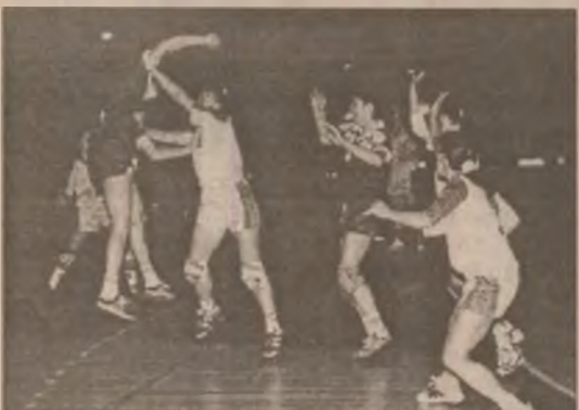
Fază de joc din meciul de handbal feminin UNIV. REMIN DEVA - ROM. TINERET

Dorind să-și continue pregătirile în vederea promovării în Liga națională, echipa Universității Remin Deva a participat în perioada 26-28 noiembrie a.c. la un puternic turneu internațional care s-a desfășurat în Ungaria la Szekzard. Turneul a fost dotat cu trofeul "Bank Kupa" - Budapesta, iar cu excepția echipei din Deva toate celelalte cinci echipe participante - Vasas Dreher, Debreceni VSC și Ferropotent din Ungaria, Osijek din Croația și Waregem din Belgia au fost echipe din prima divizie a campionatelor din țările respective. Cu amănunte de la acest puternic turneu vom reveni într-un alt articol al ziarului nostru.