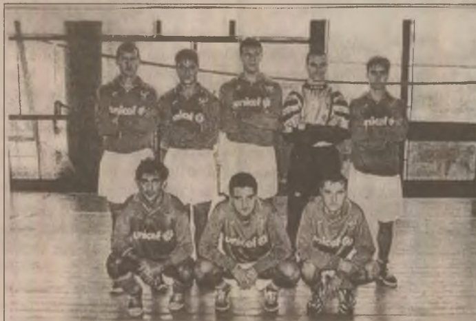
FC CORVINUL, echipa câștigătoare a primei ediții a "Cupei de iarnă"

Pagină realizată de Sabin CERBU, Ciprian MARINUT