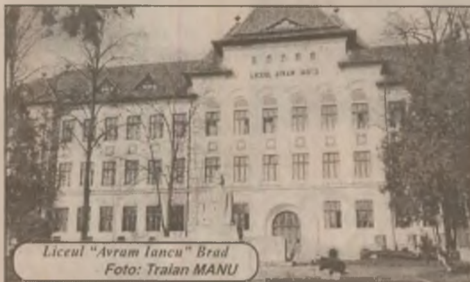
Liceul "Avram Iancu" Brad

S-a vorbit mult și zadarnic până acum despre lărgirea bazei de impozitare, despre inversarea raportului între impozitele directe și cele indirecte, despre introducerea impozitului pe venitul global, modificarea cotelor de impozitare asupra clădirilor, terenurilor și autovehiculelor, despre decalarea anului fiscal de cel calendaristic, cât și despre multe alte componente bugetare. Fără o fundamentare pe baze economice reale însă, oricât de „meșteșugit” ar fi făcut bugetul pe 1999, acesta nu-l va favoriza cu nimic pe omul de rând, care se zbate pe mai departe în mizerie și sărăcie. Fără o relaxare fiscală, care este mereu promisă, dar cu un buget peticit cu diverse artificii, nu ne putem aștepta curând la ieșirea din criza profundă ce ne-a cuprins.