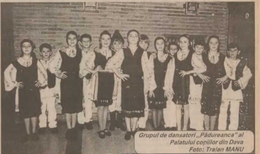
Grupul de dansatori „Pădureanca” al Palatului copiilor din Deva