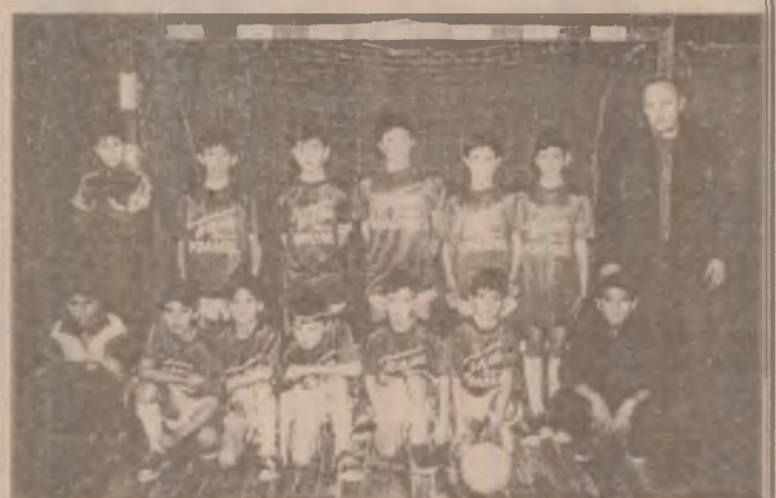
Corvinul Hunedoara - laureata competiției la categoria de vârstă 1986-1987