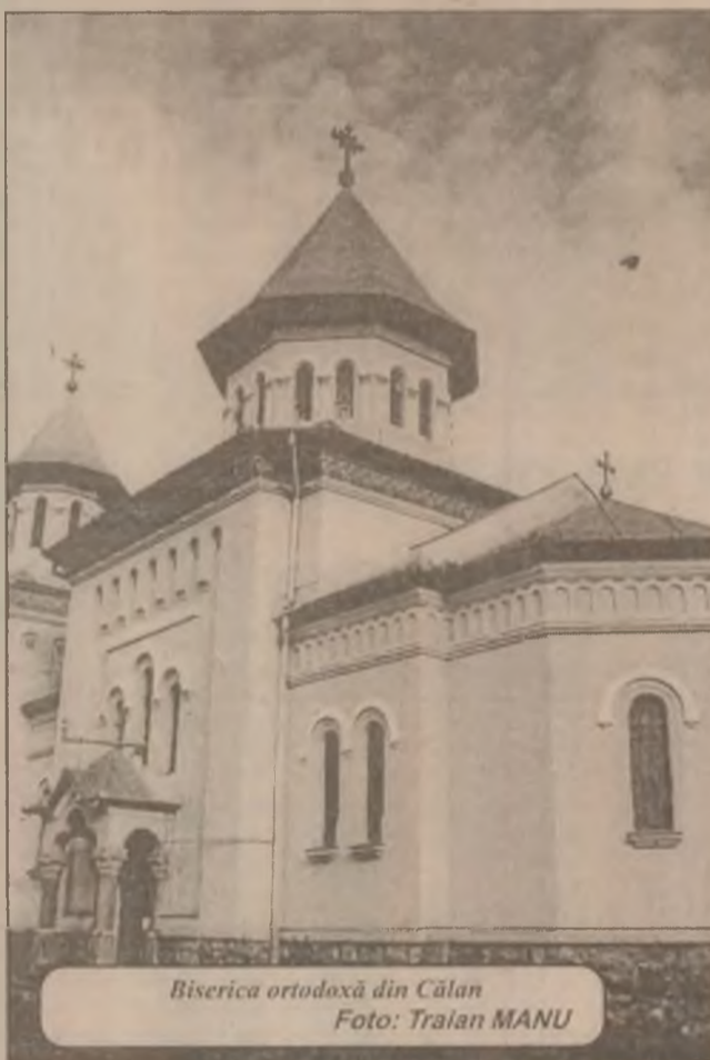
Biserica ortodoxă din Călan

Doar după hotărârea dată de justiție, se poate publica un articol în presă, așa cum ne-ați cerut.