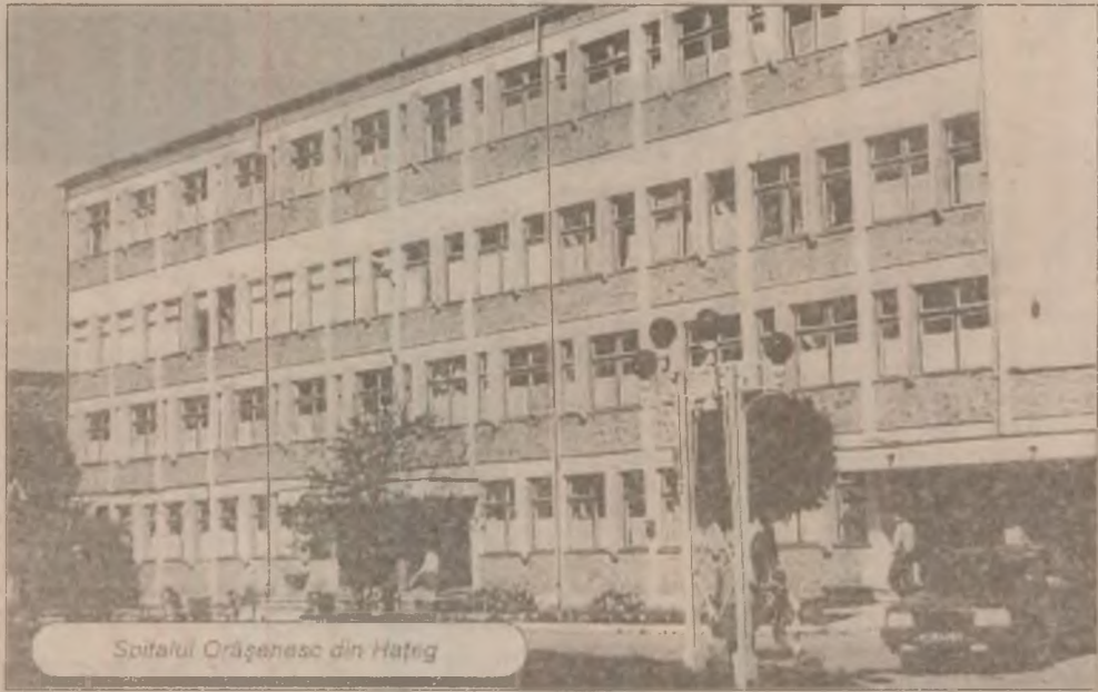
Spitalul Orășenesc din Hațeg

Eu doresc "guvernului" orașului Hațeg și celor care ajută și sprijină primăria, multă sănătate și putere de muncă, să poată conduce destinele orașului spre lucruri curate și frumoase