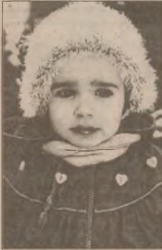
O căciuliță caldă, pe măsura timpului de-afară