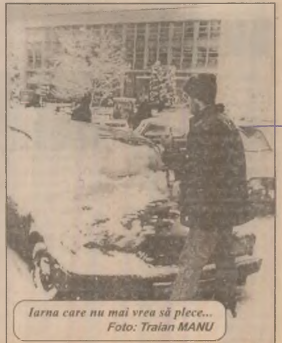
Iarna care nu mai vrea să plece...