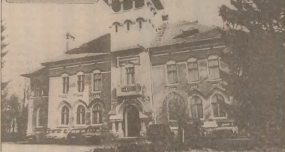
Clădirea Primăriei comunei Geogălu

Hainele din blană de nură, nutrie sau caracul au devenit o raritate chiar și pentru producătorii lor, Compania de Blănuri "Vidra" din Orăștie. Preturile prohibitive pentru piața românească și orientarea vestului spre protecția animalelor și promovarea produselor ecologice au coborât producția acestor repere la nivelul câtorva zeci anual. În 1998, compania din Orăștie a confecționat 22 de astfel de luxoase veșminte. Dacă mai adăugăm că prețul unei haine de nură lungă atinge valoarea de 30 de milioane de lei, e lesne de închipuit că se pot număra pe degete cucoanele ce-și pot strecura nuri în intimitatea refugiu ambulant al unei blăni naturale. (A.S.)