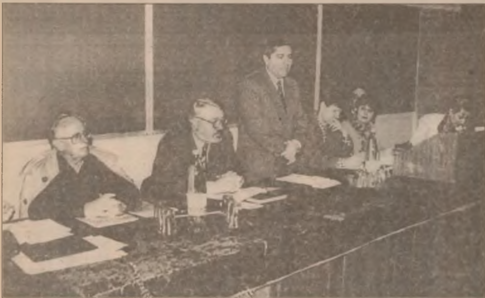
Potențialii investitori întreabă, autoritățile răspund în cadrul seminarului organizat de curând la Petroșani pe tema zonelor defavorizate.

În perioada decembrie 1990 - decembrie 1998, în România și-au încetat activitatea 19.353 de firme particulare. Dintre acestea, 68 la sută au fost societăți comerciale cu răspundere limitată, 10,5 la sută persoane fizice, 9,2 la sută societăți în nume colectiv, 6,5 la sută societăți comerciale pe acțiuni.