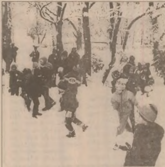
În aceste zile parcul central din Deva a răsunat de glasurile cristaline ale copiilor ce au primit cu bucurie această iarnă bogată.