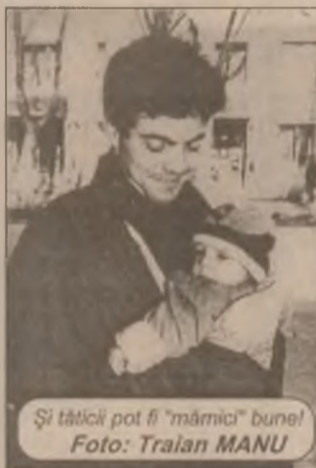
Și tăticii pot fi "mămici" bune!

Procurorul general, Mircea Criste, este de părere că ar trebui înființate noi instanțe militare, cele deja existente nenaifacând față numărului mare de dosare. Criste susține că este nevoie și de un al doilea tribunal militar, având în vedere, faptul că singurul care există în prezent, cel de la București, are puțini judecători și un număr foarte mare de dosare din teritoriu. Criste spune că în urma unui control la instanțele militare s-a constatat că militarii lucrează în acest moment la dosarele cele mai importante cum ar fi cele legate de revoluție, mine-riade sau acte de corupție. Mircea Criste apreciază că numărul magistraților militari ar trebui dublat, mai ales pentru că și în acest an continuă preluarea dosarelor judiciare de la SRI.