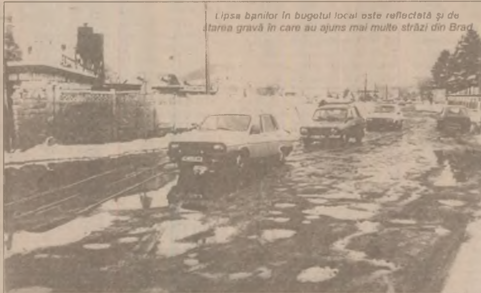
Lipsa banilor în bugetul local este reflectată și de starea gravă în care au ajuns mai multe străzi din Brad

Le adresăm tuturor celor care urmează a fi încorporați în această săptămână celebra urare "Armată ușoară".