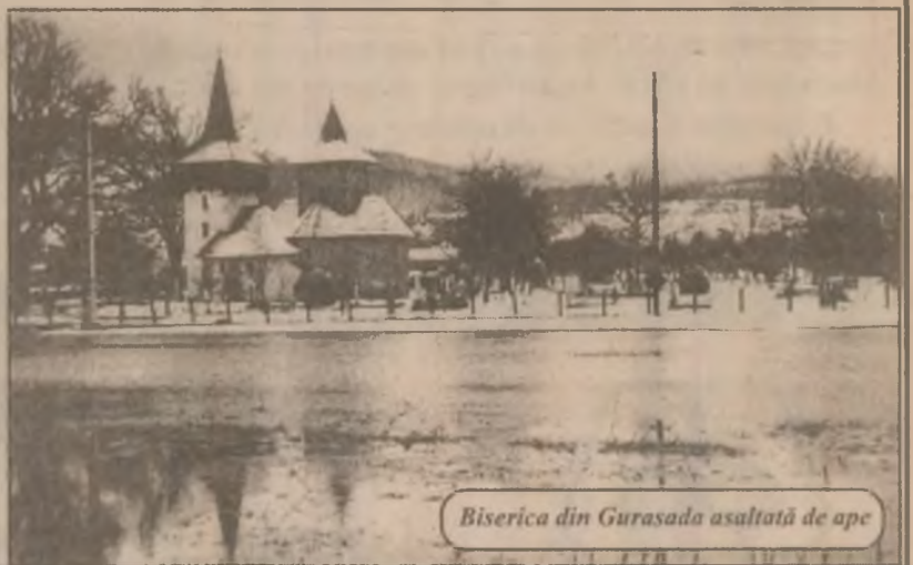
Biserica din Gurasada asaltată de ape