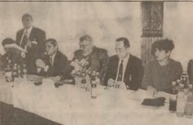
Autorități județene în dialog cu potențiali investitori în Valea Jiului, în cadrul "Parteneriatului pentru dezvoltare", organizat de curând la Lupeni.

Dincolo de ce se întâmplă și se discută în jurul problemei Bancorex, această instituție bancară trebuie să fie restructurată și privatizată urgent, ea rămânând să fie viabilă și datorită acoperirii pierderilor pe seama unor resurse bugetare. Poate că după privatizare, fără amestecul politicului în activitatea bancară, băncile noastre vor arăta mai curate, sănătoase și, de ce nu, mai atractive pentru potențialii clienți.