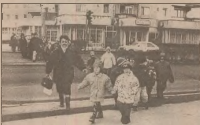
Insoții de doamnele educatoare copiii de la o grădiniță din Orăștie merg frumos încononați la un film pentru copii.

Intrarea pentru iubitorii cântecului și dansului popular a fost gratuită. Unde există pasiune și dragoste pentru cultură se poate. Sala căminului cultural a fost plină. "Doamne ajută și dă bine!" (V. BUTAȘ)