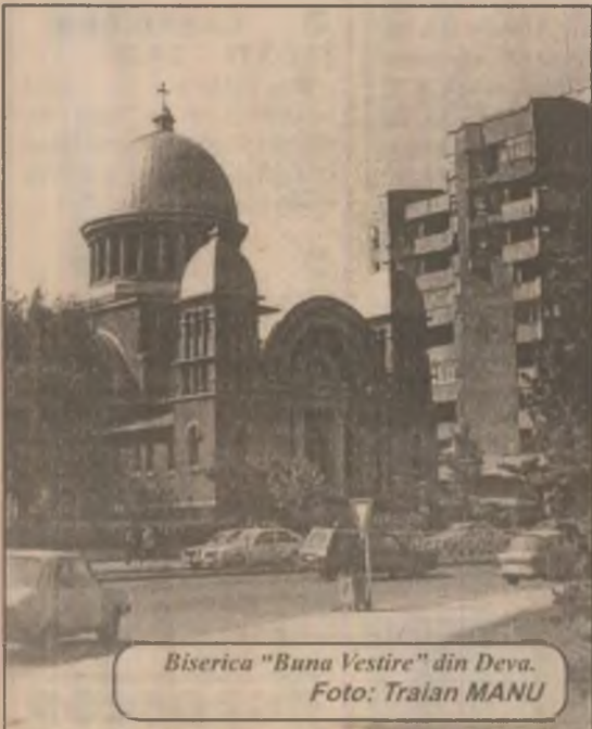
Biserica "Buna Vestire" din Deva.