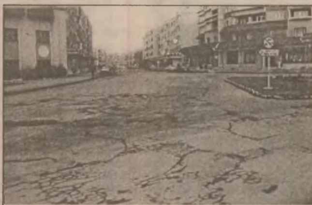
Brad. O dată cu topirea zăpezii au apărut gropile în asfalt. Pentru evitarea lor ești nevoit să faci un adevărat slalom.

similară se poate intui și în cazul sectorului siderurgic. În aceste condiții, 1999 este anul în care sindicatele joacă totul pe o carte. Trecerea punții cu minime pierderi te obligă să te faci frate și cu dracul, darămite cu "colegii" sindicali, chiar dacă, până mai ieri, aceștia reprezentau, într-un fel, "concurrenta".