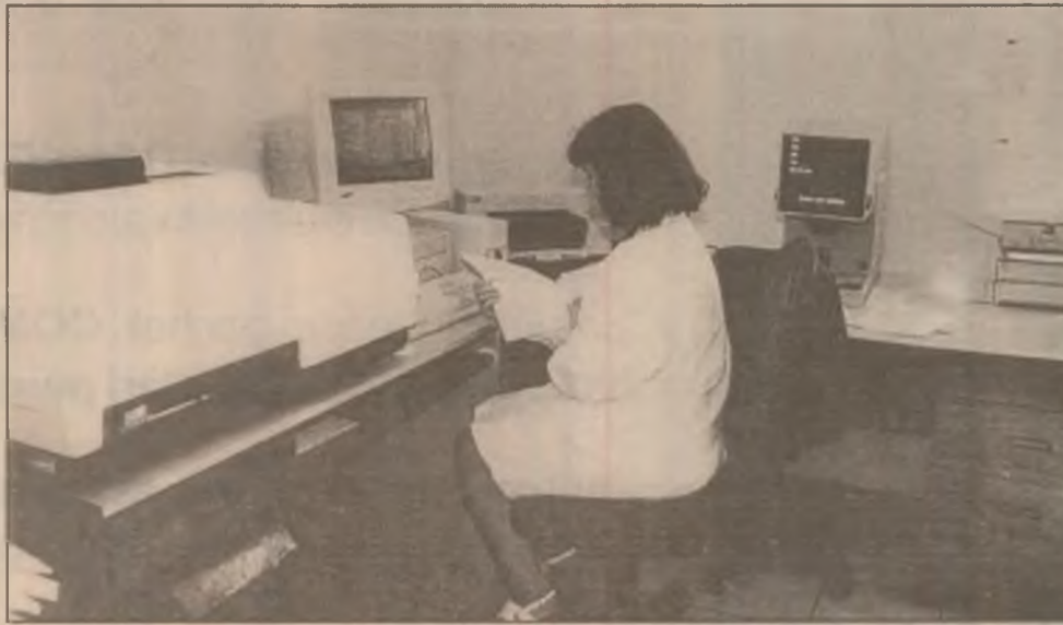
Dotări moderne în laboratorul de stabilire a calității producției al SC "Calcita" SA Vața.

Până la 1 iulie a.c., Ministerul Educației Naționale (MEN) va promova un proiect de lege privind introducerea unei taxe de susținere a învățământului de stat. Plătitorii acestei taxe vor fi societățile comerciale, regiile autonome, societățile și companiile naționale, precum și firmele străine cu sediul în România. În proiectul de act normativ se arată că taxa va fi suportată din fondul brut de salarii, fiind dedusă din impozitul pe profit.