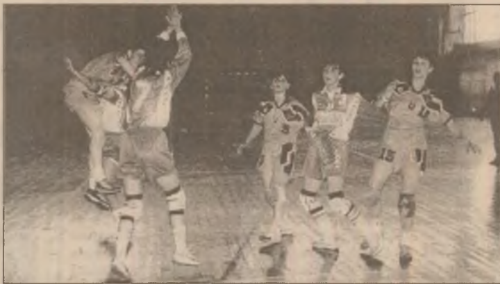
O fază frumoasă din campionatul trecut dintre Univ. Remin Deva - Viromet Victoria, în care gazdele au învins cu 31 - 28