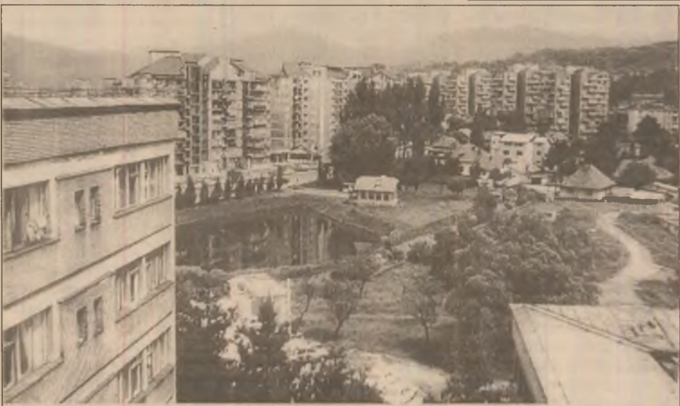
Petroșani - În Valea Jiului, viața văzută de sus arată ceva mai bine

Spectacolul va fi transmis în direct de către Tele 7 ABC și va reprezenta o manifestare de excepție pentru perioada amintită. (Comel POENAR)