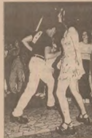
Una dintre cele trei perechi câștigătoare ale concursului de dans desfășurat la Pepsi Music Show

știu și se pot simți bine fără a face neapărat pe "teribiliști" și a se da în spectacol, într-un "mediu" considerat de unii ca fiind dintre cele mai propice pentru asemenea manifestări. (G.B.)