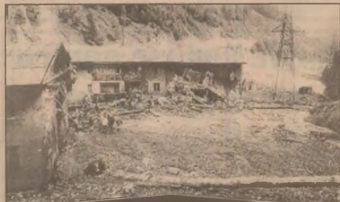
Sub mormanul de pământ, lemne și moloz, zac încă nedescoperite 12 victime ale dezastrului de la Gura Apei. De aceea, zi și noapte, aici lucrează zeci de oameni la degajarea dărâmăturilor.