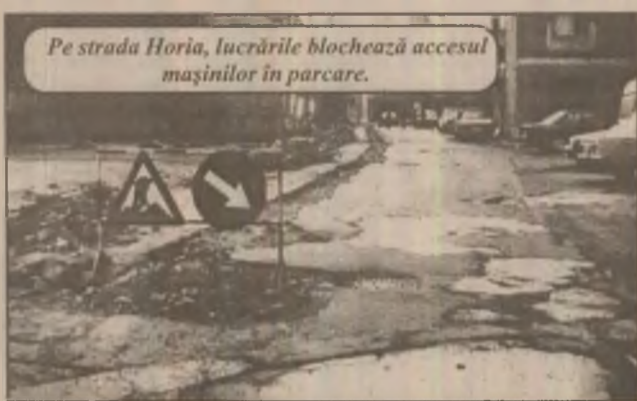
Pe strada Horia, lucrările blochează accesul mașinilor în parcare.