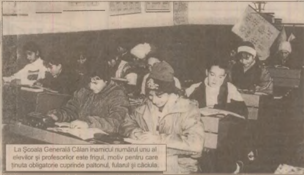
La Școala Generală Călan înamicul numărului unu al elevilor și profesorilor este frigul, motiv pentru care ținuta obligatorie cuprinde paltonul, fularul și căciula.

Incepută cu surle și trâmbițe în 1991 odata cu aprobarea de către Parlament a Legii 18, retrocedarea pământurilor către foștii proprietari pare a fi sortită să se finalizeze abia în mileniul trei. Acest proces s-a dovedit a fi mai dificil decât se așteptau cei implicați. În cele 14 sate care constituie suburbiile ale orașului Călan punerea în posesie s-a lovit de numeroase probleme. În multe cazuri comisiile locale de fond funciar le-a fost foarte greu să găsească documentele necesare în baza cărora să stabilească proprietarii de drept. În alte situații mai mulți oameni solicitau aceeași bucată de pământ - de care-și aminteau ei că a fost a părinților - astfel că de aici apăreau noi probleme. Și nu în ultimul rând, specialiștii topografi chemați să măsoare și să rezolve situația în teren au fost de multe ori de... negăsit. Cert e că la ora actuală doar în opt din cele 14 sate s-a finalizat punerea în posesie. În schimb, în satele Nădăștia de Sus, Nădăștia de Jos, Sântămăria de Piatră, Crișeni "încă se lucrează", iar în satele Valea Sângeorzului și Sâncraii lucrările încă nici nu au început.