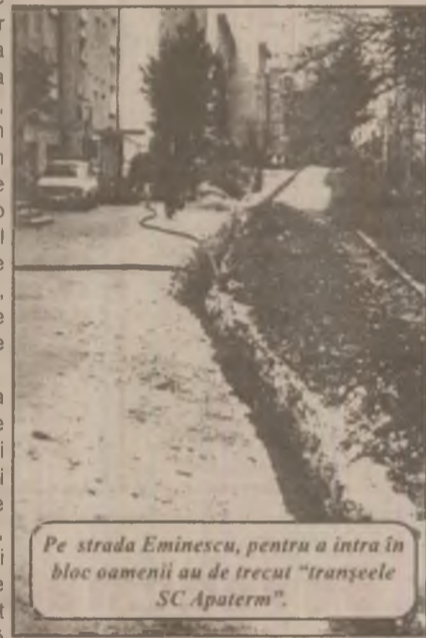
Pe strada Eminescu, pentru a intra în bloc oamenii au de trecut "tranșeele SC Apaterm".