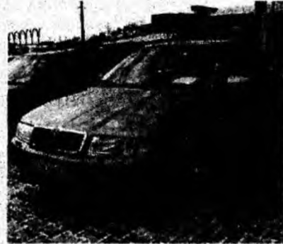
Skoda Octavia 1,9 TDI, af. 2003, fulloption, climatronic, 110 cp. Preț 10 950 euro. Tel. 0727/228473.