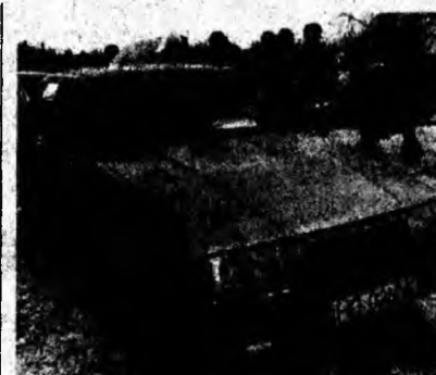
Volvo, af. 1992, benzină, servo, ABS. Preț 4 000 euro, negociabil. Tel. 0745/839437 ; 0254/236156.