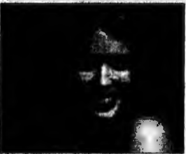
Kylie Minogue

Minogue s-a adresat Curții Supreme, a statului australian Victoria, reclamând de la PAL Productions, condusă de Water-