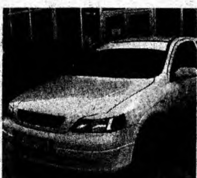
Opel Astra, af. 2002, diesel, fulloption. Preț 8 100 euro, negociabil. Tel. 0258/817906.