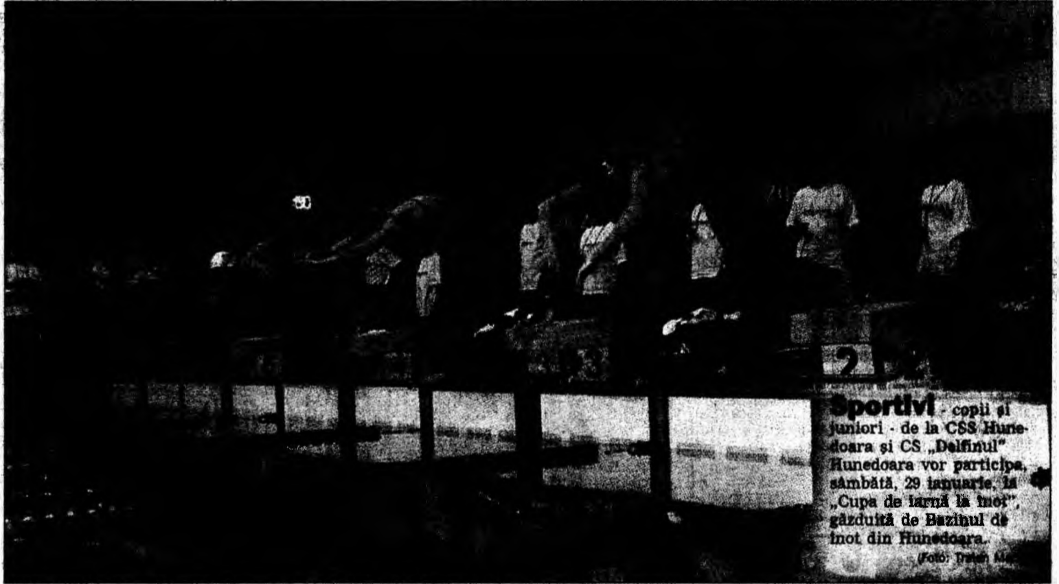
Sportivi - copii și juniori - de la CSS Hunedoara și CS „Delfinul” Hunedoara vor participa, sâmbătă, 29 ianuarie, la „Cupa de iarnă la inot”, găzduită de Bazinul de inot din Hunedoara.

La etapa județeană, Direcția pentru Sport și Judo din Hunedoara, principalul organizator al întrecerii, a oferit tinerilor judoka clasări pe primele locuri premii constând în diplome și materiale sportive.