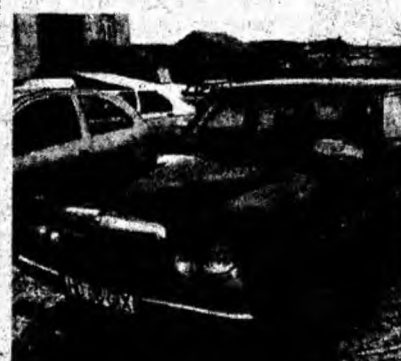
Mercedes Cobra, af. 1980, diesel. Preț 2 400 euro, negociabil. Tel. 0723/382923.