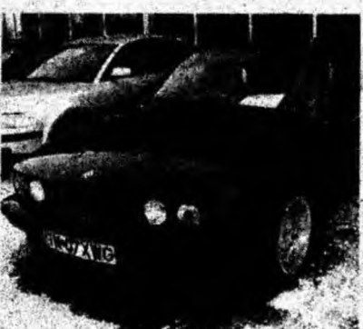
BMW 524 TD, af. 1989, gearmuri și oglinzi electrice, jenți aluminiu. Preț 4 990 euro, negociabil. Tel. 0722/140940.