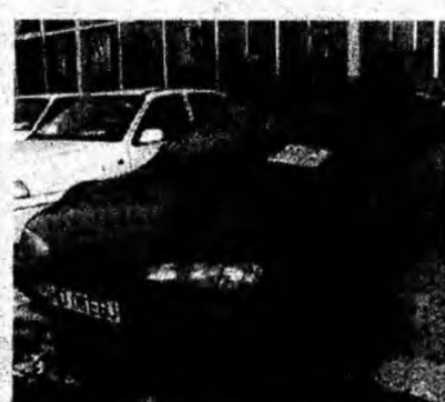
Ford Mondeo 1,8 TDI, af. 1995, diesel, ABS, alarmă. Preț 5 600 euro, negociabil. Tel. 0723/808519.