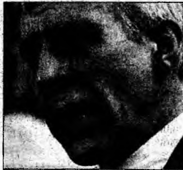
Jack Straw

Săptămâna trecută, George W. Bush a declarat că nu exclude o acțiune militară împotriva Iranului, în cazul în care abordarea diplomatică va eșua.