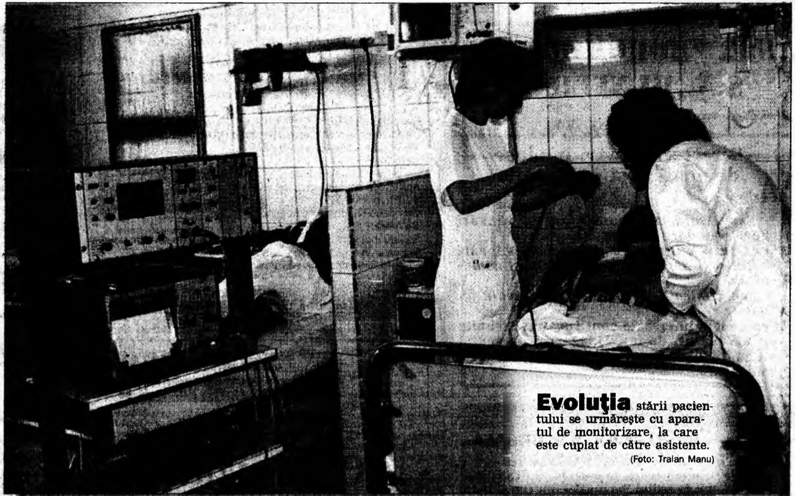
Evoluția stării pacientului se urmărește cu aparatul de monitorizare, la care este cuplat de către asistente.