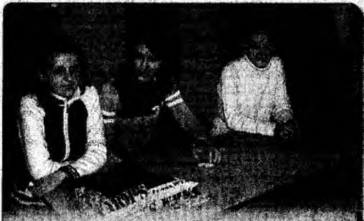
Elove ale Liceului Pedagogic „S. Drăgoi” Deva asistând la ore în cadrul practicii pedagogice.