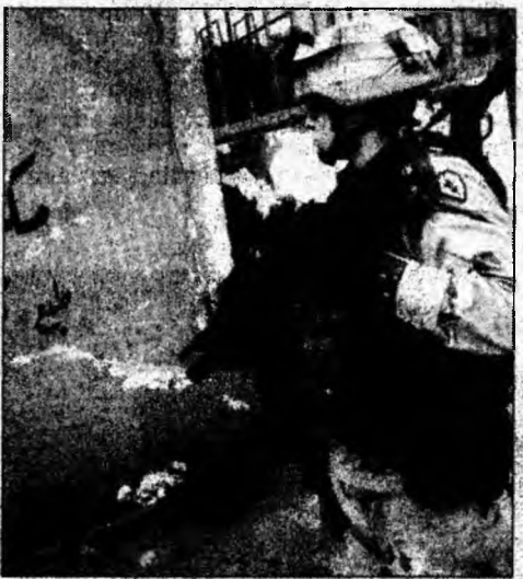
În ciuda controalelor forțelor de ordine, atacurile nu sînt tot mai ușoare.

■ Referendum incert. Premierul belgian liberal, Guy Verhofstadt, nu mai beneficiază de susținerea politică necesară pentru organizarea unui referendum asupra Constituției europene. Partenerul său din coaliție, Partidul Social-Liberal Spirit, a decis în mod surprinzător să renunțe la susținerea promisă pentru organizarea consultării publice.