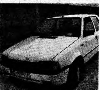
Dacia Nova, af. 1997. Preț 2 600 euro, negociabil. Tel. 0724/369313.