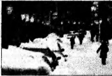
Zăpadă în Boston

Gubernatorul statului Massachusetts, Mitt Romney, a decla-