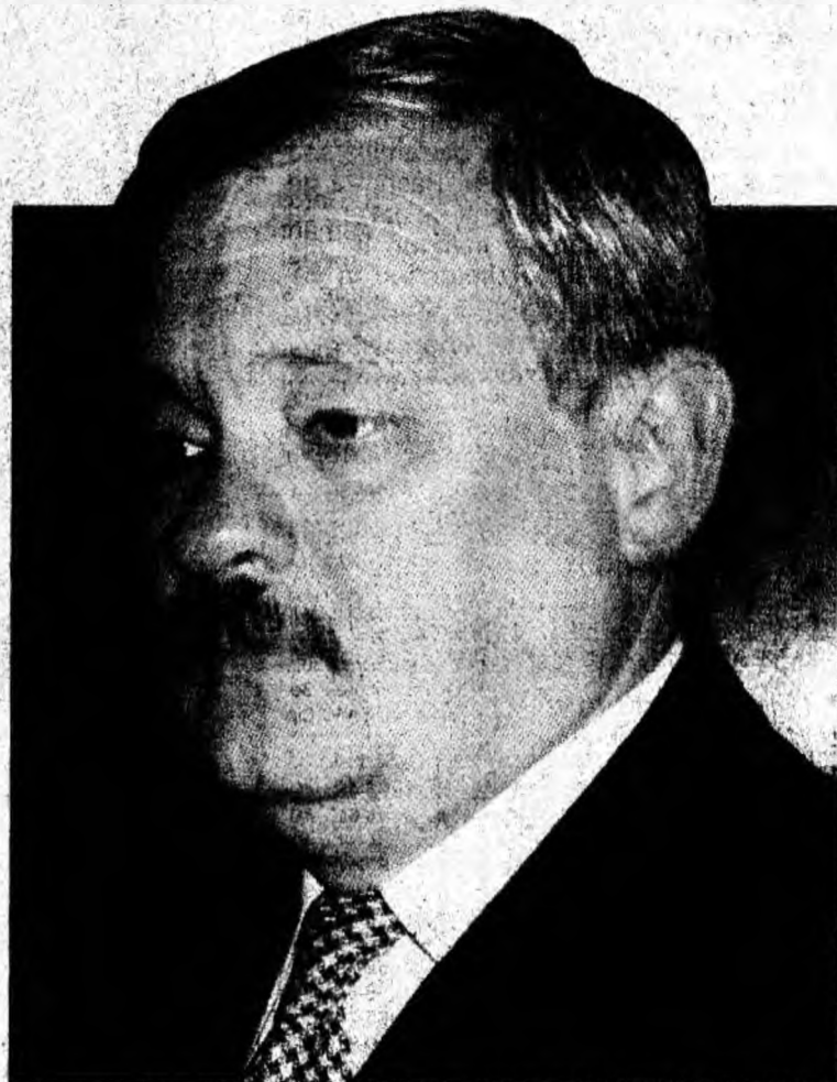
Gheorghe Firczak, deputat în Parlamentul României.

Gh.F.: Prin diverse pretexte. Motivul constă în aceea că, inițial, în 1996, noi am discutat dosarele celor care solicitau certificate. O comisie compusă din 7 membri a lucrat peste o lună, analizând fiecare caz în parte. Eu am fost secretarul asociației și comisiei. După aceea, lipsind o săptămână din Deva, am fost schimbat din