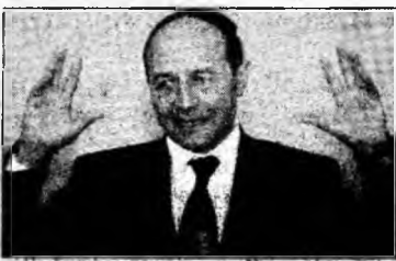
Traian Băsescu

Iași (MF) - Președintele României, Traian Băsescu, a participat ieri la ceremoniile desfășurate la Iași cu ocazia aniversării zilei Unirii Principatelor, el ținând un discurs în Piața Unirii din municipiu și depunând o coroană de flori la statuia domnitorului Alexandru Ioan Cuza.