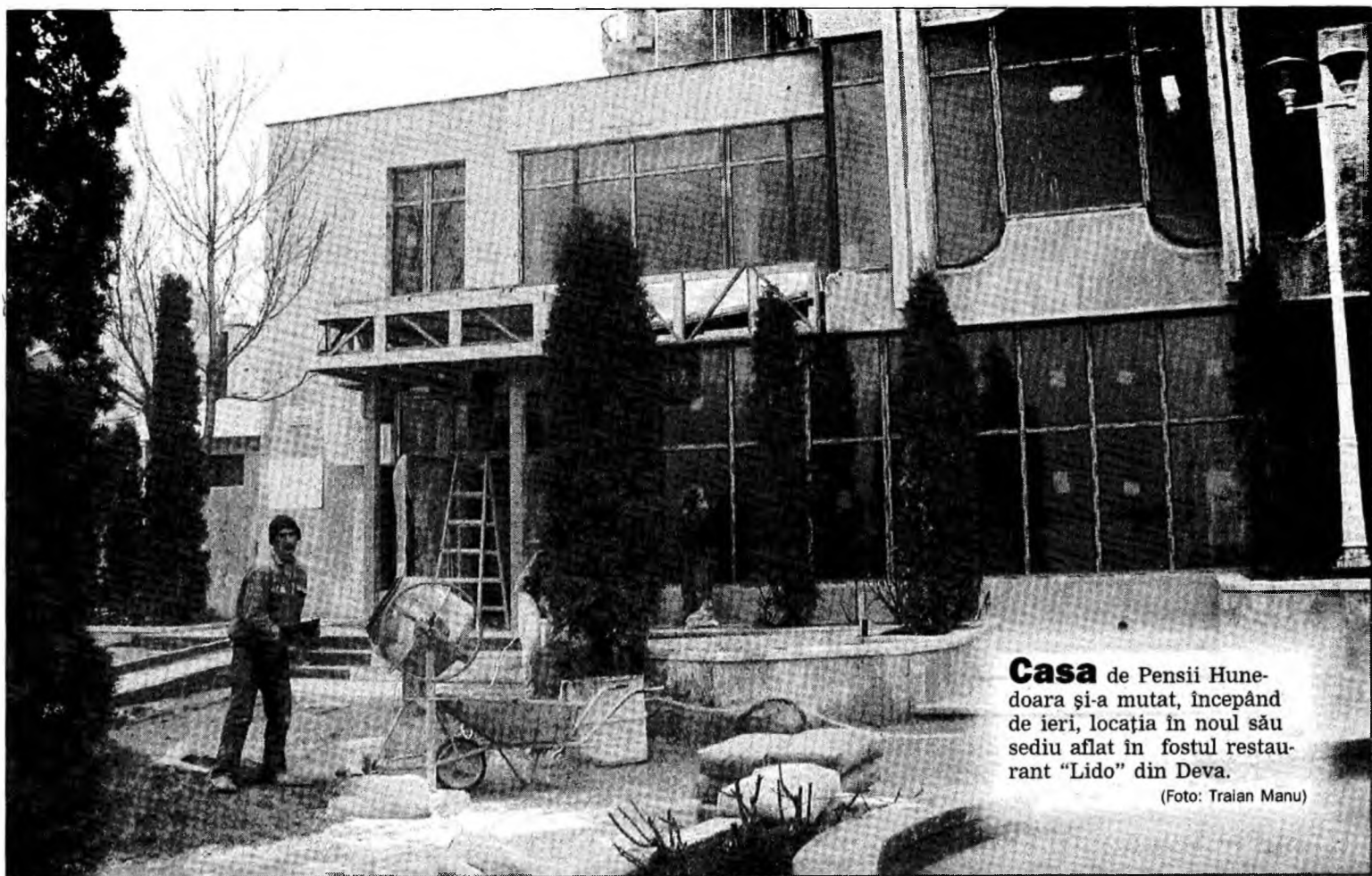
Casa de Pensii Hunedoara și-a mutat, începând de ieri, locația în noul său sediu aflat în fostul restaurant „Lido” din Deva.