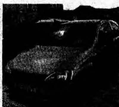
Opel Corsa, af. 2001, benzină, fulloption. Preț 6 500 euro. Tel. 0723/276200.