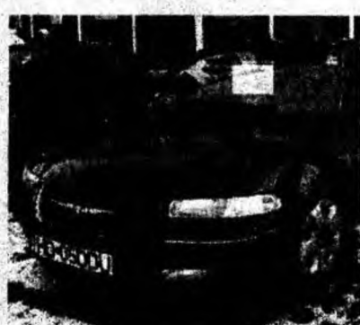
Chrysler Stratus 2,5 I, super întreținută, rulată numai la extern, fulloption. Preț 8 000 euro, negociabil. Tel. 0722/639426 ; 0744/567063.