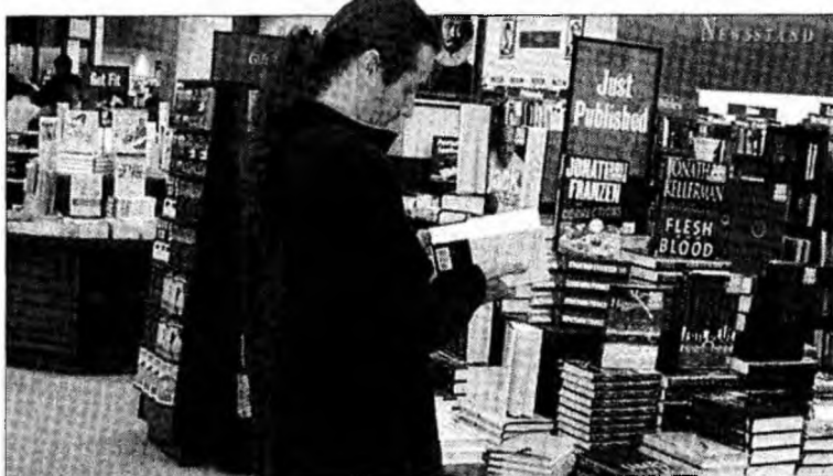
Cele mai citite cărți sunt romanele de dragoste și cele polițiste.

Majoritatea cumpărătorilor de cărți sunt cei trecuți de 40 de ani. Cele mai scumpe cărți achiziționate de la anticariat sunt Coranul și Tora.