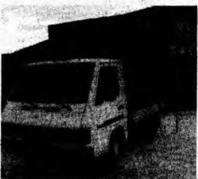
Mercedes MB 100, af. 1988, camionetă, masă totală 2 700. Preț 5 200 euro, negociabil. Tel. 0721/497171.