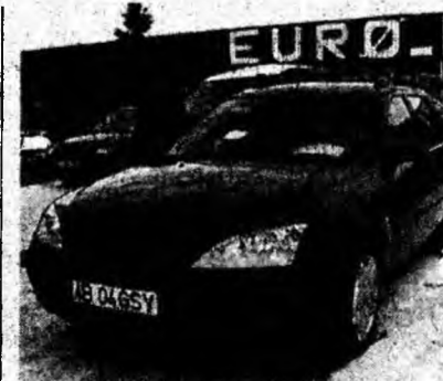
Ford Mondeo 2,0 TDI, af. 2001, fulloption. Preț 9 700 euro. Tel. 0744/799121.