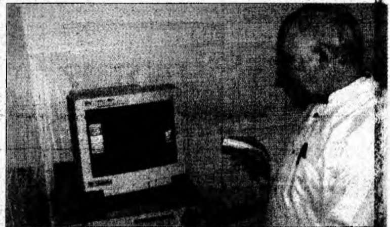
Aparatul Eco doppler color este prezentat invitaților și presei.

restul secției fiind amplasată la etajul trei al clădirii, într-un spațiu luat de la ginecologie nou-născuți.