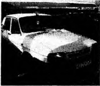
Dacia 1310 L, af. 1998, vopsea originală, bord CN, unic proprietar. Preț 74 mil. lei. Tel. 0723/729444.

Se pot înscrie absolvenții ai învățământului superior de orice specialitate.