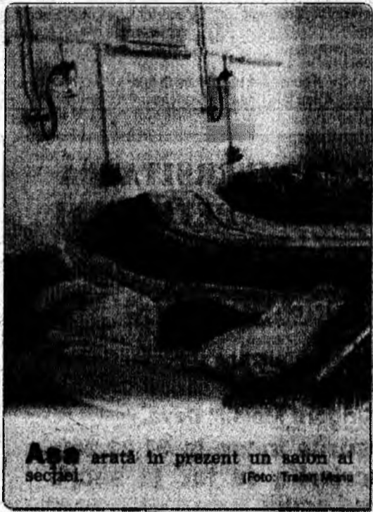
Ass arată în prezent un salon al secției.

☑ Inaugurarea de ieri a produs și nemulțumiri medicilor din alte secții. Unul dintre cei nemulțumiți, trecând prin mulțimea invitaților la eveniment, a șoptit necăjit: „unii au parte de toate, alții n-au nimic”.