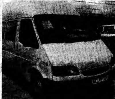
Ford Transit, af. 1996, ABS, 8+1 locuri. Preț 8 500 euro, negociabil. Tel. 0744/539331.