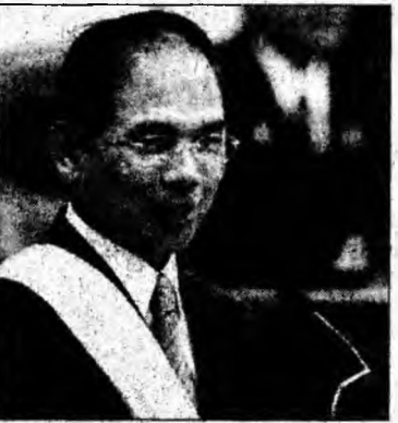
Premierul Yu Shyi-kun

Opoziția din Kuomintang, în mod tradițional mai apropiată de China comunistă, a obținut controlul asupra Camerei, cu 114 mandate.