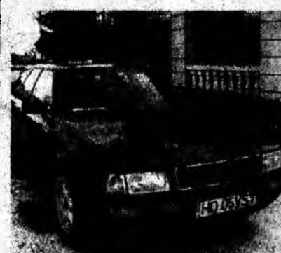
Audi B4 Avant, af. 1994, diesel, servo, ABS. Preț 7 000 euro, negociabil. Tel. 0722/976726.