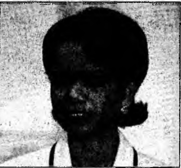
Condoleezza Rice

În documentul transmis Camerei Comunelor săptămâna trecută, Straw susține o soluție pașnică pentru a împiedica Iranul să producă arme de distrugere