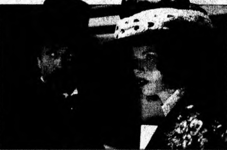
John Malkovich alături de Veronica Ferres

Malkovich recunoaște că nu are timp să-și studieze foarte mult personajele, spre deosebire de alți actori pe care îi admiră, precum spaniolul Javier Bardem. „Mă gândesc la o scenă atât timp cât o filmăm”, a declarat actorul, a cărui marcă este însă jocul foarte intens. „Nu știu prea multe despre Klimt. Tot ce pot face este să îmi imaginez cum