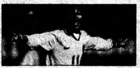
Romario de Souza Faria.

București (C.M.) - Fostul internațional Romario de Souza Faria, de 39 de ani, a semnat un contract pe trei luni cu echipa la care și-a început cariera, Vasco da Gama, informează cotidianul Marca. Detaliile financiare ale contractului nu au fost făcute publice. Fost jucător al echipei FC Barcelona și Valencia, Romario a anunțat la sfârșitul anului trecut că nu intenționează încă să se retragă din activitate, dar presa locală notează că durata contractului cu Vasco da Gama este un indiciu că jucătorul se apropie de finalul carierei.