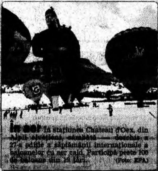
Un actor în stațiunea Chateau d'Oex, din Alpi, în timpul competiției de schi. — deschis a 27-a ediție a săptămânii internaționale a baloanelor cu aer cald. Participă peste 100 de baloane din 15 țări.

Ú Încă un premiu. Sindicatul Producătorilor Americani de Film (Producers Guild of America) i-a premiat pe Michael Mann și Graham King, producătorii filmului „The Aviator”, pentru cel mai bun film al anului, în cadrul unei ceremonii care s-a desfășurat sâmbătă la studiourile Culver.