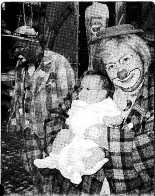
Și clovni își au rostul lor în creșterea copiilor.

Valoarea estimată a investiției este de 50 miliarde de lei, întreaga sumă fiind suportată din bugetul Consiliului Local Petroșani. Investiția se va derula în 3 etape.