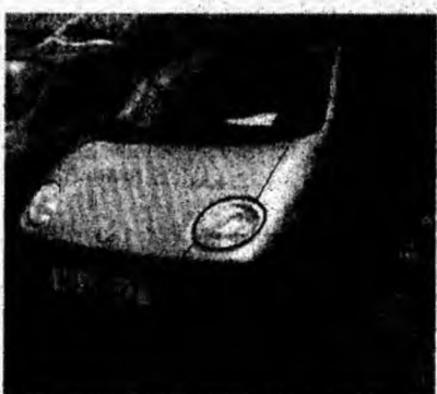
Daewoo Matiz, af. 2003, alarmă, climă, garanție. Preț 4 200 euro, negociabil. Tel. 0740/863462.