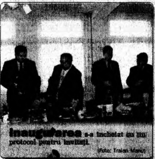
Inaugurarea s-a încheiat cu un protocol pentru invitatii.

Deva (V.R.) - Pentru Secția de cardiologie devenă s-au primit ajutoare materiale substanțiale din partea dr. Goia, plecat în urmă cu mai mulți ani din România. Deși nu mai este în țară, n-a uitat că a pus bazele cardiologiei la Deva și de aceea a trimis aici un holter, monitoare ș.a. Ajutoarele din partea celui care a rămas legat sufletește de spitalul deven vor continua.