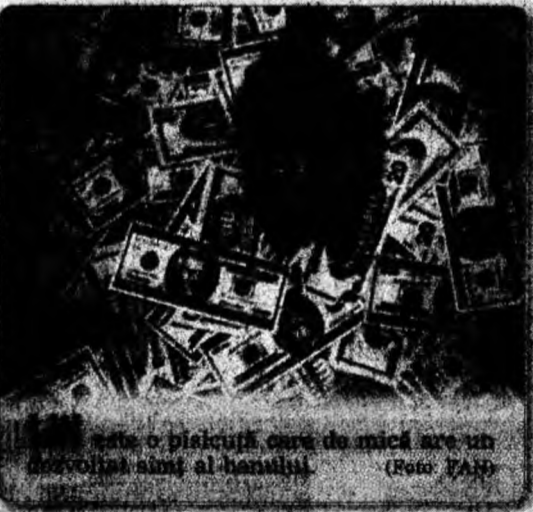
Un disc jockey care de mică are un comportament al hănușii.

Foarte popular, Johnny Carson a fost introdus în „Hall of Fame” în 1987, iar în 1992 a fost decorat cu medalia prezidențială pentru libertate, una dintre cele mai înalte distincții americane.