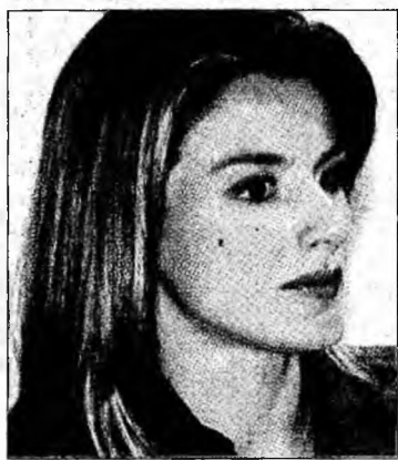
Letizia

Prințesa, o jurnalistă divorțată, în vârstă de 33 ani, care s-a căsătorit cu prințul Felipe la 22 mai 2004, ar trebui, în mod normal, să nască la jumătatea lunii noiembrie. Prințul și-a exprimat dorința de a asista la naștere.