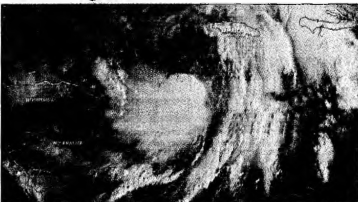
Wilma ar putea deveni al 21-lea uragan

Potrivit Centrului american al Uraganelor (NHC) de la Miami, Wilma, care provoacă deja intensificări ale vântului de până la 85 de kilometri pe oră, ar putea deveni, cel de-al 21-lea uragan al sezonului 2005. Este primul an, din 1933, când serviciile mete-