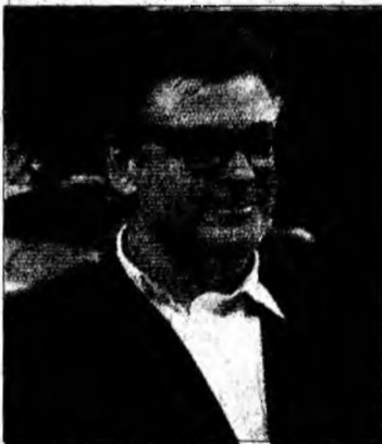
Alec Baldwin

Actrița a răspuns publicației germane la întrebarea dacă a avut de suferit în urma opoziției ei față de războiul din Irak, declanșat de George W. Bush în martie 2003.