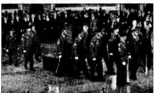
Sicriul Rosei Parks în clădirea Capitolului

Primul-ministru a amintit că nou înființata Direcție Generală Anticorupție din MAI are competențe de cercetare penală și că acest organism va iniția acte premergătoare de investigare, urmând ca dosarele de corupție să fie transmise la Parchete sau la Direcția Națională Anticorupție.