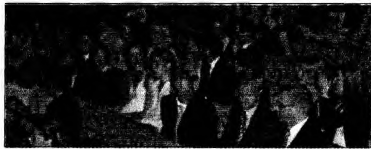
Vara este plăcut să fii spectator în Casa de Cultură Deva