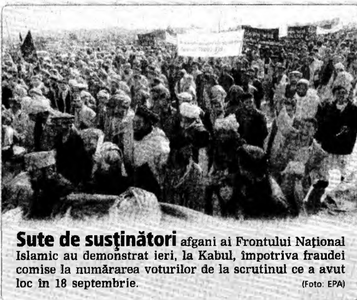
Sute de susținători afgani ai Frontului Național Islamic au demonstrat ieri, la Kabul, împotriva fraudei comise la numărarea voturilor de la scrutinul ce a avut loc în 18 septembrie.

La Montgomery, Alabama, unde Rosa a refuzat să cedeze locul în autobuz unei persoane albe, numeroși oameni au urmat sămbătă dricul ce transporta sicriul, tras de doi cai albi, care a traversat orașul.