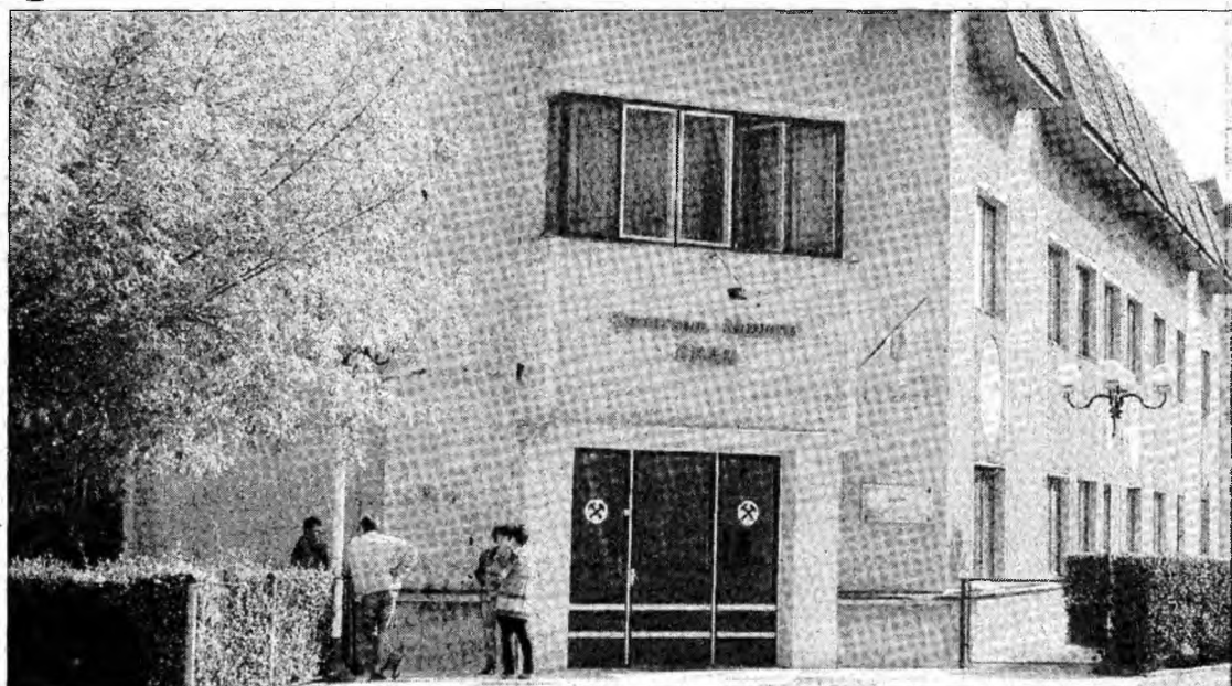
Există investitori interesați de privatizarea filialei Brad

Deva - Nivelul subvențiilor va scădea cu un sfert față de cel înregistrat anul acesta. Conducerea companiei devine susținătoare că din cele 1100 de miliarde de lei vechi solicitați se vor primi probabil 700 de miliarde de lei. Diminuarea subvențiilor va însemna și o nouă reducere de personal. „În condițiile preconizate ar însemna că vom funcționa cu o medie lunară de 1400 de angajați. Acum la Minvest Deva avem 3300 de salariați, iar la 1 ianuarie 2006 vom avea circa 3000. Până la finele lui 2006 vom continua procesul de disponibilizări. Acesta va viza 1600 de posturi și se va derula în etape diferite începând din