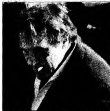
Depardieu