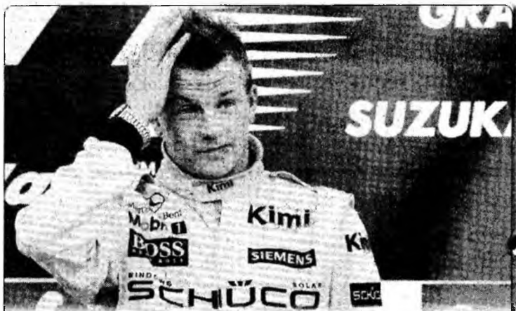
Pilotul finlandez Kimi Raikkonen, vicecampion mondial de Formula 1 cu McLaren, a fost operat la genunchi la o clinică din Helsinki și nu se va putea antrena timp de o lună, relatează Reuters.