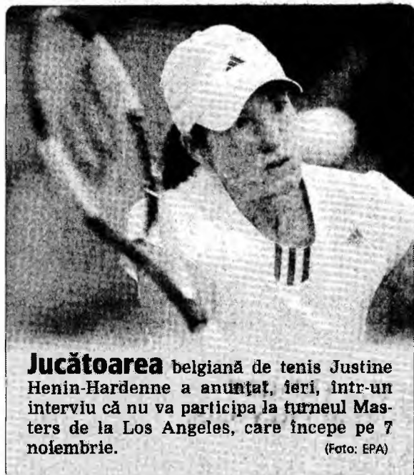
Jucătoarea belgiană de tenis Justine Henin-Hardenne a anunțat, ieri, într-un interviu că nu va participa la turneul Masters de la Los Angeles, care începe pe 7 noiembrie.

● Rădoi, pe tușă. Fundașul Stelei, Mirel Rădoi, a fost supus, ieri, unei rezonanțe magnetice, la Spitalul Militar din București, în urma căreia s-a stabilit că va fi indisponibil încă 3 săptămâni, după accidentarea la glezna dreaptă, suferită în partida cu Rapid. Rădoi va purta o orteză specială câteva zile, iar de luni va începe pregătirile. (C.M.)