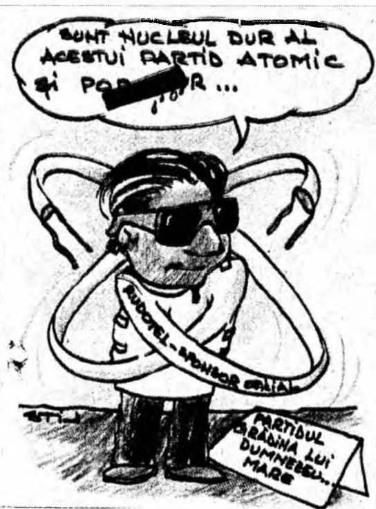
Caricatură de Liviu Stănilă