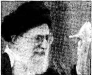
Ayatollahul Ali Khamenei

Teheran (MF) - Ayatollahul Iranului, Ali Khamenei, a declarat că „rezistența palestiniană” va distruge „regimul sionist”, sugerând astfel că poziția iraniană față de Israel a rămas neschimbată. „Rezistența palestiniană va fi cea care va distruge regimul sionist”, a subliniat el. Khamenei a făcut această declarație la patru zile după ce afirmațiile președintelui iranian, Mahmoud Ahmadinejad, au suscitât critici aspre pe plan internațional. El declarase că Israelul „trebuie șters de pe hartă”. Aceste declarații, condamnate de Consiliul de Securitate al ONU, au alimentat suspiciunile Statelor Unite și Israelului privitoare la încercarea Iranului de a obține arma nucleară.