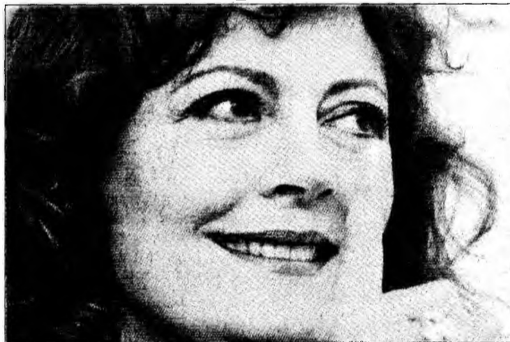
Demonstrațiile contra războiului din Irak nu i-au afectat cariera.

„Nu m-am confruntat niciodată cu o asemenea răutate. Cutia noastră de scrisori este