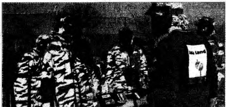
Una din echipe își stabilește strategia de concurs

Să mai spunem că în ultimul an nivelul întrecerilor a crescut foarte mult. De asemenea, numărul echipelor concurente, ceea ce înseamnă că acest sport place românilor.