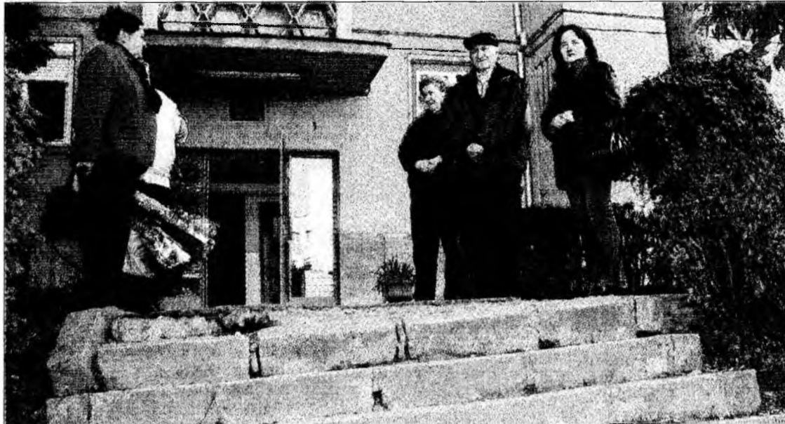
Locuitori adunați în fața blocului 41 bis de pe Strada Minerului