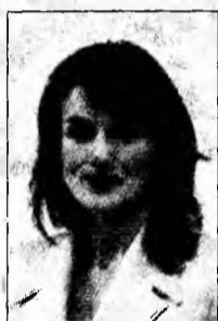
Letizia

Los Angeles (MF) - Fosta protagonistă a serialului „Totul despre sex”, actrița Sarah Jessica Parker, și-a luxat piciorul după ce a alergat pe stradă încălțată în pantofi cu toc. „Aceasta este o atenționare că nu mai am 27 de ani. Am 40 de ani și organismul pur și simplu nu mai este așa de rezistent cum era odată. Dar, cu toate acestea, o să port mereu tocuri!”, a declarat Parker.