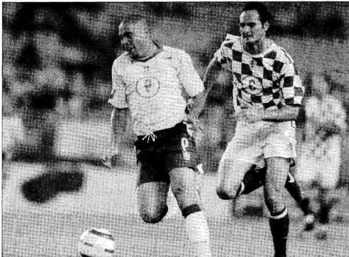
Aerul de vedetă și numeroasele accidentări au afectat imaginea lui Ronaldo

Seleccionerul Carlos Alberto Parreira a anunțat că va