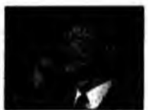
Joseph Lieberman