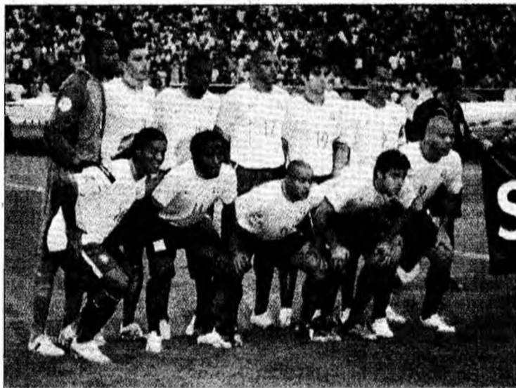
Echipa Braziliei, marea decepție a CM 2006

„Am crezut într-o fantasmă conform căreia Brazilia trebuie să ajungă în finală. Acum, că Brazilia a pierdut, este normal ca echipa să fie criticată. În fotbal am un curriculum de învingător, cu mai multe victorii decât înfrângeri. Mă voi gândi mai mult la victorii decât la înfrângeri. Acum trebuie să ne gândim la următoarele