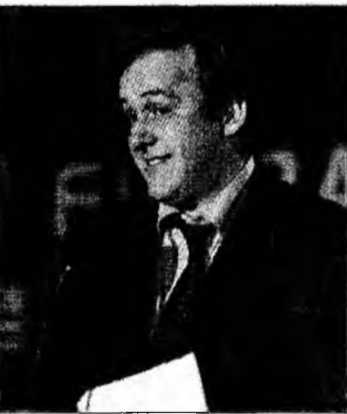
Michel Platini

Berlin (MF) - „Au fost meciuri bune și partide mai puțin bune. Cred că nivelul fotbalului practicat nu este prea ridicat. Acest lucru ține de presiunea enormă care este exercitată asupra jucătorilor”, a spus Platini. Fostul antrenor al Franței a făcut o paralelă între perioada când evolua și cea de acum: „Când eram fotbalist, de exemplu în 1984, vorbeam doar cu un jurnalist. În prezent, jucătorii sunt urmăriți de o mulțime de jurnaliști”. Platini a precizat că brazilianul Ronaldinho, deși este cel mai bun fotbalist din lume, „aproape că nu s-a văzut la primele meciuri ale Braziliei”, spre deose-