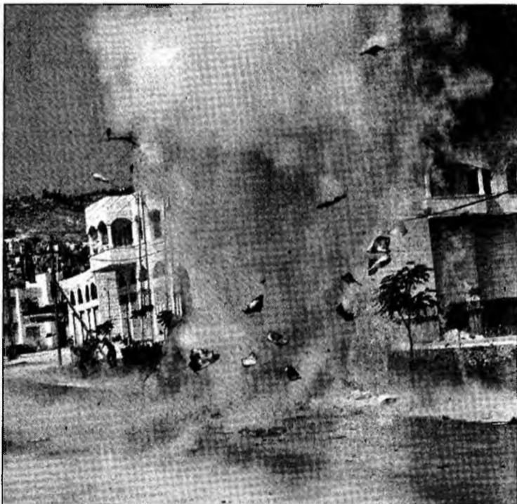
Momentul exploziei unei mașini, după ce a fost țintită de către trupele israeliene, în tabăra de refugiați din Jenin

Washington (MF) - Senatorul american Joseph Lieberman, nominalizat de Partidul Democrat pentru funcția de vicepreședinte la alegerile din 2000, a declarat că va încerca să candideze ca independent la scrutinul din noiembrie, în cazul în care nu va obține nominalizarea din partea partidului său. Pentru a candida ca independent la alegerile pentru Congres din noiembrie, Lieberman (64 ani) va încerca să strângă cele 7.500 de semnături necesare. La alegerile din 2000, el a fost nominalizat de Partidul Democrat pentru funcția de vicepreședinte, candidând alături de Al Gore, învins de republicanul George W. Bush.