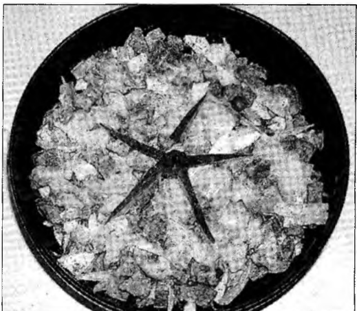
Poftă bună!

Mod de preparare: Se fierbe carnea de vită și ouăle, separat, în apă cu sare. Ouăle se curăță de coajă și se taie bucățele mici. Carnea se taie și ea bucățele mici. Se pune într-un castron carnea, se adaugă ouăle. Se taie castravetele murat în cubulețe mici și se stoarce bine de zeamă. Ceapa se taie fidea. Se pune maioneza și bulionul. Se amestecă bine. Se lasă câteva ore la frigider. Se poate decora cu castravete murat, ceapă verde sau după imaginația fiecăruia.