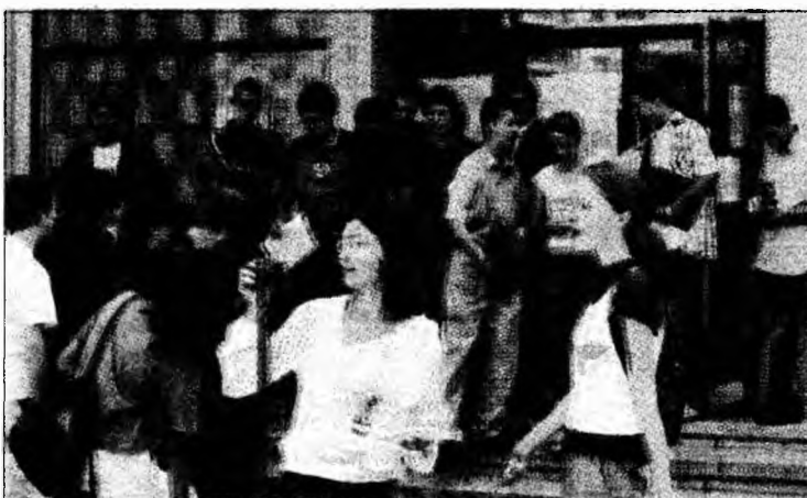
Elevii se înscriu la liceu

În aceeași perioadă au continuat și activitățile de informare și consiliere a elevilor