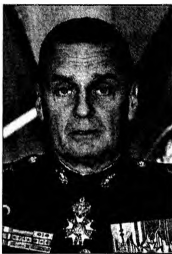
Comandantul suprem al forțelor aliate din Europa, James Jones

Extinderea misiunii de menținere a păcii ISAF condusă de NATO spre sudul Afganistanului implică alianța în cea mai dură misiune te-