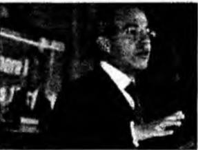
Felipe Calderon

Mexico City (MF) - Candidatul forțelor de dreapta, Felipe Calderon, a câștigat alegerile prezidențiale organizate în Mexic, conform rezultatelor oficiale parțiale, prezentate luni, însă autoritatea electorală va aștepta o nouă numărătoare a voturilor pentru a proclama oficial câștigătorul. Potrivit datelor prezentate de Institutul Federal Electoral, după înregistrarea rezultatelor obținute în 95,59 la sută din birourile de vot, candidatul Partidului Acțiunii Naționale (PAN), Felipe Calderon, a beneficiat de 13,8 milioane de voturi (36,48 la sută), devansându-l pe Andres Manuel Lopez Obrador, candidat din partea Partidului Revoluției Democratice (PRD), care a primit 13,4 milioane de voturi (35,42 la sută).