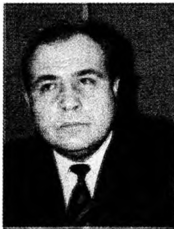
Cristian Vladu

Prefectura Județului Hunedoara a pregătit un proiect de Hotărâre de Guvern prin care solicită fonduri de la bugetul de stat în valoare de 8,815 milioane de lei pentru refacerea unor lucrări de infrastructură, în special poduri și podețe. Potrivit prefectului Cristian Vladu, în județ există 189