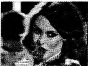
Kylie Minogue

Londra (MF) - Cântăreața australiană Kylie Minogue vorbește pentru prima dată într-un interviu televizat despre șocul pe care l-a trăit când a fost anunțată de medic că are cancer la sân. „Am simțit că mă prăbușesc când