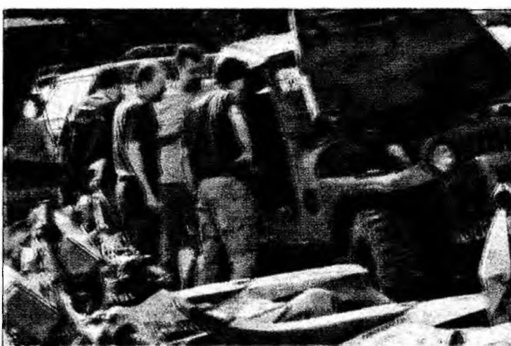
După o singură zi de concurs o reparație la o astfel de mașină poate duce și spre 10000 de euro

Cu toate acestea, an de an, tot mai mulți îndrăgostiți de această luptă se află din nou în județul Hunedoara. Chiar dacă, bunăoară, pentru această aventură „unică în Europa” un echipaj din Spania cheltuie 30.000 de euro. Chiar dacă o mașină a organizatorilor zace de trei zile undeva într-o râpă din