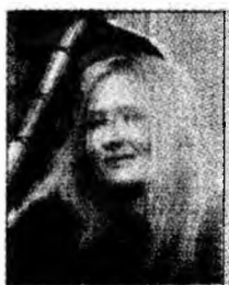
J.K. Rowling