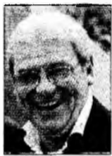
Emerich Jenei

Oradea (G.N.) - Reputatul om de fotbal orădean Emerich Jenei a remarcat faptul că semifinalele de astăzi, dintre Franța și Portugalia, pune față în față două echipe cotate cu șanse minime la câștigarea titlului mondial înaintea startului. „Microbiștii și specialiștii acordau puține șanse Franței la momentul debutului CM 2006. Cred că nimeni nu se gândea, după meciurile din grupe, că Franța va ajunge printre primele patru echipe ale Mondialului. Cu toate acestea, francezii au reușit să elimine campioana mondială, Brazilia. Astăzi, „cocoșii” vor trebui să învingă din nou o echipă „braziliană”, „Brazilia Europei”, cum este supranumită Portugalia, dacă vor să intre în finală. De cealaltă parte, Portugalia este o formație redutabilă, care știe să păstreze balonul, să schimbe rapid ritmul de joc sau să se apere în stil european. Alături de Figo, portughezii au în echipă staruri ca Deco, Cristiano Ronaldo, Maniche sau Pauleta, care le pot face viața grea lui Thuram și coechipierilor săi din apărarea Franței”, a spus fostul antrenor al Stelei și al echipei naționale.