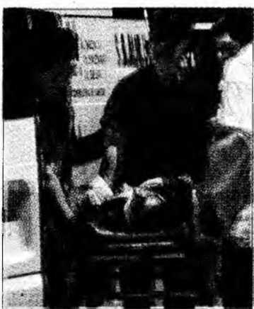
O victimă a accidentului

Valencia (MF) - Autoritățile din regiunea Valencia, Spania, au anunțat că în urma gravului accident de metrou petrecut luni, se vor ține trei zile de doliu. Deraierea a două din vagoanele unui tren de metrou s-a soldat cu moartea a cel puțin 41 de persoane și circa 40 de răniți. Vagoanele au deraiat și s-au răsturnat într-un tunel de lângă stația Jesus, aflată în centrul orașului Valencia. Oficialitățile spaniole au exclus rapid ipoteza unui atac terorist. Potrivit primelor evaluări, viteza excesivă și o roată defectă ar fi fost cauzele accidentului. S-a formulat și ipo-