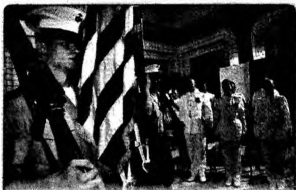
De 4 iulie Soldații marinei americane au iert dat onorul, la Ambasada Statelor Unite din Bagdad, cu ocazia zilei de 4 iulie, zi națională a SUA.

● Plângere. O serie de avocați olandezi intenționează să depună plângere împotriva guvernului de la Haga și Națiunilor Unite în numele a 7.930 de rude ale victimelor masacrelor de la Srebrenița, din 1995. Circa 8.000 de bărbați și tineri musulmani au fost uciși în această enclavă din estul Bosniei, plasată sub protecția căștilor albastre olandeze.