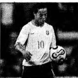
Ronaldinho, o decepție

Chapeco (MF) - O statuie de șapte metri înălțime reprezentându-l pe Ronaldinho a fost distrusă într-un oraș din sudul Braziliei, după eliminarea echipei pregătite de Carlos Alberto Parreira la Cupa Mondială din Germania. Un purtător de cuvânt al Primăriei a declarat că statuia, din rășină și fier, care se afla în piața orașului, a fost arsă în noaptea de sâmbătă spre duminică. „Nu a mai rămas decât structura metalică”, a declarat sursa citată. Statuia îl reprezenta pe Ronaldinho cu un