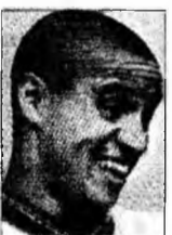
Roberto Carlos

Rio (T.B.) - Internaționalul brazilian Roberto Carlos și-a anunțat retragerea din echipa națională. „Am terminat cu echipa națională. A fost ultima mea partidă”, a declarat fundașul, în vârstă de 33 de ani, extrem de criticat pentru evoluția sa în meciul cu Franța, el fiind considerat unul dintre responsabili pentru golul marcat de Thierry Henry.