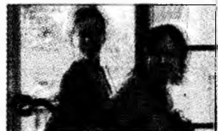
Nicole și Keith

Sydney (MF) - Nicole Kidman și Keith Urban au oferit publicațiilor mondene o fotografie de la nunta lor, cerând în schimb ca reprezentanții acestora să facă donații unei fundații pentru ajutorarea copiilor din Sydney, dar nu au obținut rezultatele scontate. Cuplul a oferit această fotografie la câteva ore după ce a luat sfârșit nunta care a avut loc la Sydney, Australia, pentru a scăpa de curiozitatea paparazilor. În loc să vândă fotografiile în exclusivitate unor publicații mondene, cuplul a cerut reprezentanților media să utilizeze fotografia în schimbul unor donații pentru Children's Hospital Foundation din Sydney. Potrivit spuselor reprezentanților spitalului, s-au primit „șase sau opt donații” cu o valoare de 550 de dolari fiecare.