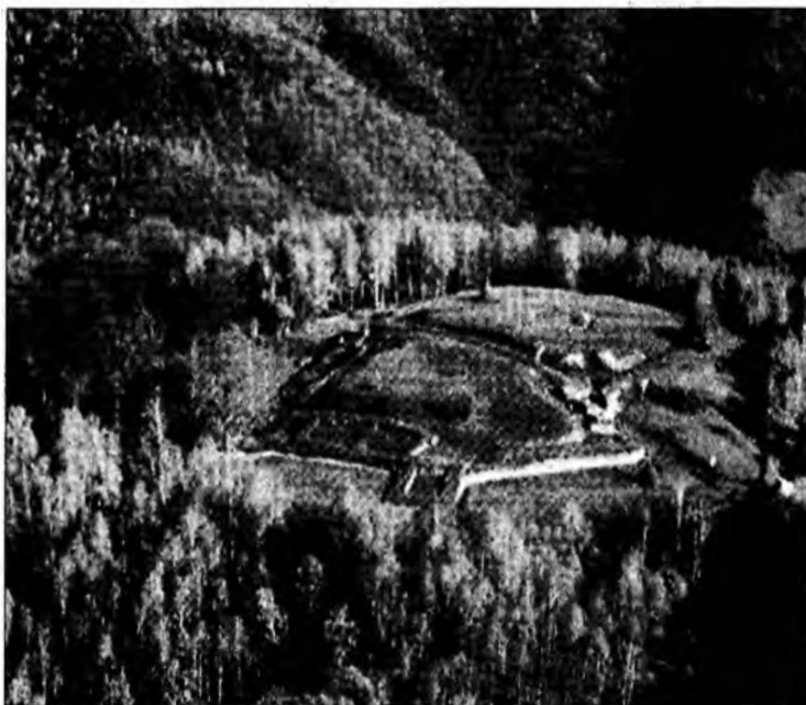
Cetatea Costești - Blidaru