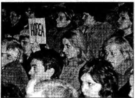
Salariații cer respectarea convenției

Deva (S.B.) - Ca urmare a plângerii formulate în luna iunie de Federația Sindicatelor Libere din Învățământ (FSLI) referitoare la violarea sistematică de Guvern a Convenției Organizației Internaționale a Muncii (OIM) privind protecția salariatului, conducerea organizației a hotărât să trimită o misiune în țara noastră. Aceasta este așteptată în ianuarie 2007 și va verifica modul în care Executivul a respectat drepturile salariale ale personalului din învățământ. Potrivit AM Press, comisia va stabili dacă legislația privind salarizarea prejudiciază drepturile salariale ale profesorilor și dacă creează discriminare în salarizarea diferitelor categorii de bugetari. De asemenea, Organizația Internațională a Muncii a decis introducerea României pe lista cazurilor speciale discutate de către Comisia de Norme OIM cu prilejul Adunării Generale din luna iunie 2007.