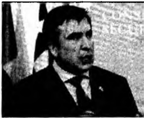
Mihail Saakașvili

Londra (MF) - Președintele georgian Mihail Saakașvili s-a declarat dispus să „deschidă dialogul” cu Moscova, cu condiția respectării independenței țării sale. „Nu puteți pretinde că aveți acces la civilizația modernă, la democrație, la piața economică, și în același timp să vă intimidati vecinii. Avem propriul domeniu de vânătoare”, a declarat Saakașvili pentru BBC. Arestarea de către autoritățile georgiene a patru ofițeri ruși acuzați de spionaj a provocat, săptămâna trecută, o criză între Moscova și Tbilisi. Georgia a predat, luni, prizonierii ruși moscovei. Rusia a decis însă menținerea blocada aeriană, maritimă, poștală și rutieră împușă micii republici caucaziene.