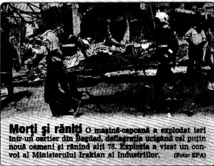
Morți și răniți O mașină-căpcană a explodat ieri într-un cartier din Bagdad, deflagrația ucigând cel puțin nouă oameni și răniind alți 76. Explosia a vizat un convoi al Ministerului Irakian al Industriei.

Întrebat dacă se aștepta să nu primească votul Parlamentului, George Maior a precizat că nu și-a pus această problemă. „Dacă Parlamentul nu m-ar fi votat, înseamnă că nu eram pregătit pentru asemenea post”, a opinat Maior.