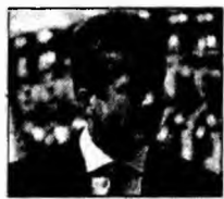
Gheorghe Părvanov

Cei doi turci care au deturnat avionul companiei Turkish Airlines, forțat să aterizeze pe aeroportul Brindisi din Italia, s-au predat și vor cere azil politic.