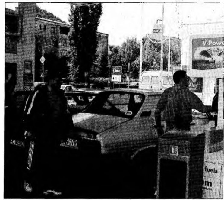
Noul nivel al accizelor va majora de la 1 ianuarie prețul carburanților și implicit cheltuielile cu transportul.

șocul creșterii prețurilor. S-au scumpit alimentele, băuturile alcoolice, au crescut cheltuielile de întreținere și s-au majorat cheltuielile de sănătate. În țări precum Cehia, Ungaria și Polonia integrarea a bulversat prețurile alimentelor. Cele mai sensibile au fost lactatele, carnea și cerealele. În Ungaria, după integrare, s-au scumpit carnea de vită și cerealele. Producătorii n-au mai vândut procesorilor interni, mai zgârșciți la preț, ci statului, care a cumpărat o bună parte din producție la un preț de intervenție, apropiat de cel european. În scurt timp, însă a apărut un efect neașteptat: stocuri de cereale de peste 6 milioane de tone. Pe piața laptelui, situația a fost cu totul alta. Laszlo Vajda, director în cadrul Ministerului