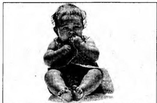
Bebelușii au nevoie de odihnă

Deva (S.B.) - În jurul vârstei de 2 ani este nevoie de multă grijă pentru somnul copilului. În această perioadă durata de somn se va mai micșora puțin și va ajunge la 13-14 ore pe zi, din care 10-11 în timpul nopții și restul în reprize de somn de după-amiază. Acum este timpul să-l antrenezi pe micuț să adoarmă de unul singur. Deja i se poate explica, cu puține cuvinte, de ce este mai bine să doarmă noaptea decât ziua. De asemenea, îi pot fi arătate și câteva poziții de somn dintre care el să o aleagă pe cea mai confortabilă.