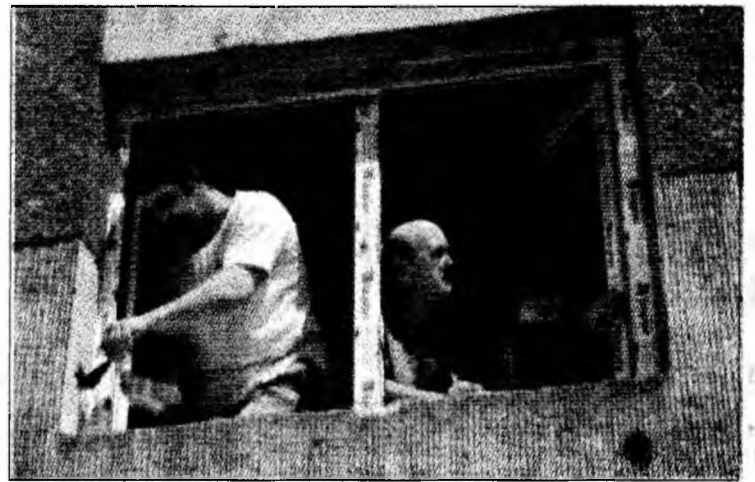
Firmele includ în preț geamul, transportul și montajul acestuia la domiciliul clientului

Pentru un geam cu trei ochiuri (2 ochiuri fixe plus un ochi cu deschidere oscilobatantă), prețul este de aproximativ 260 euro, iar prețul unei uși de balcon (jumătate sticlă, jumătate panel PVC) oscilează între 185 și 210 euro.