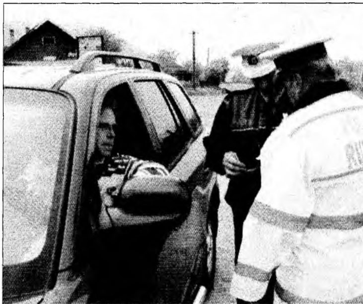
Șoferii sunt obligați să rămână în mașină

În situația în care conducătorul de autovehicul, oprit în trafic pentru încălcarea unei norme rutiere, nu are asupra sa nici un act de