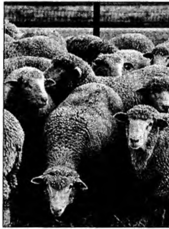
Peste 190.000 de oi din rasa Țurcană sunt crescute în județ

mai buni crescători de ovine, un program artistic.