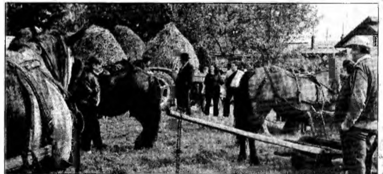
Proprietarii primesc despăgubiri pentru caii bolnavi

Animalele bolnave vor fi duse la sacrificare, sperându-se că în acest fel se va eradică maladia în rândul cailor. Proprietarii vor primi des-