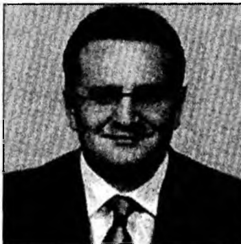
George Maior

După vot, George Maior și Claudiu Săftoiu au depus jurământul în fața Parlamentului ca directori ai SRI și, res-