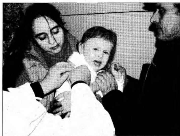
Vaccinul asigură un plus de sănătate

Există situații în care vaccinarea trebuie amânată: infecții, medicație ce afectează sistemul imunitar (antibiotice