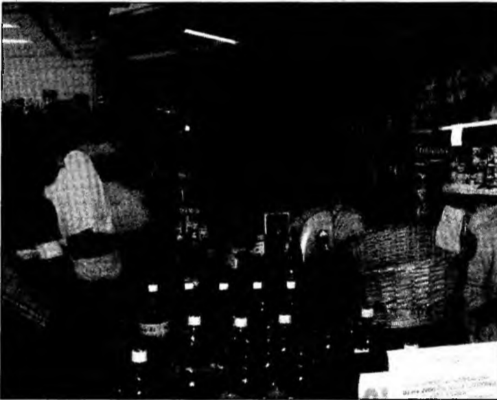
Prețul alimentelor va evolua diferit, de la produs la produs.

Cele 10 state care au aderat la UE în 2004 au resimțit