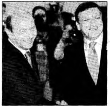
Băsescu și Barroso

Conform Tratatului de Aderare, Parlamentul European va fi consultat în privința noilor comisari. Cea mai probabilă dată pentru audierea noilor comisari, potrivit comunicatului citat, este 27-28 noiembrie, iar pentru organizarea votului sunt luate în calcul perioada de dinainte de 25 decembrie, 4 ianuarie sau 9 ianuarie.