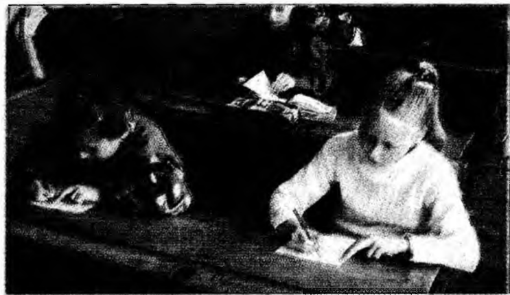
Şcolarii din Lupeni nu se pot spăla nici pe mâini