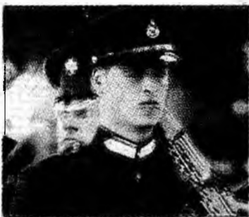
Prințul William

„Din fericire, mitraliera nu era încărcată, dar pierderea armei este una din cele mai mari