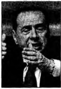
Silvio Berlusconi