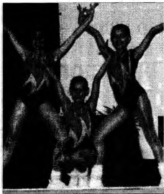
Gimnastele și-au etalat grația și talentul