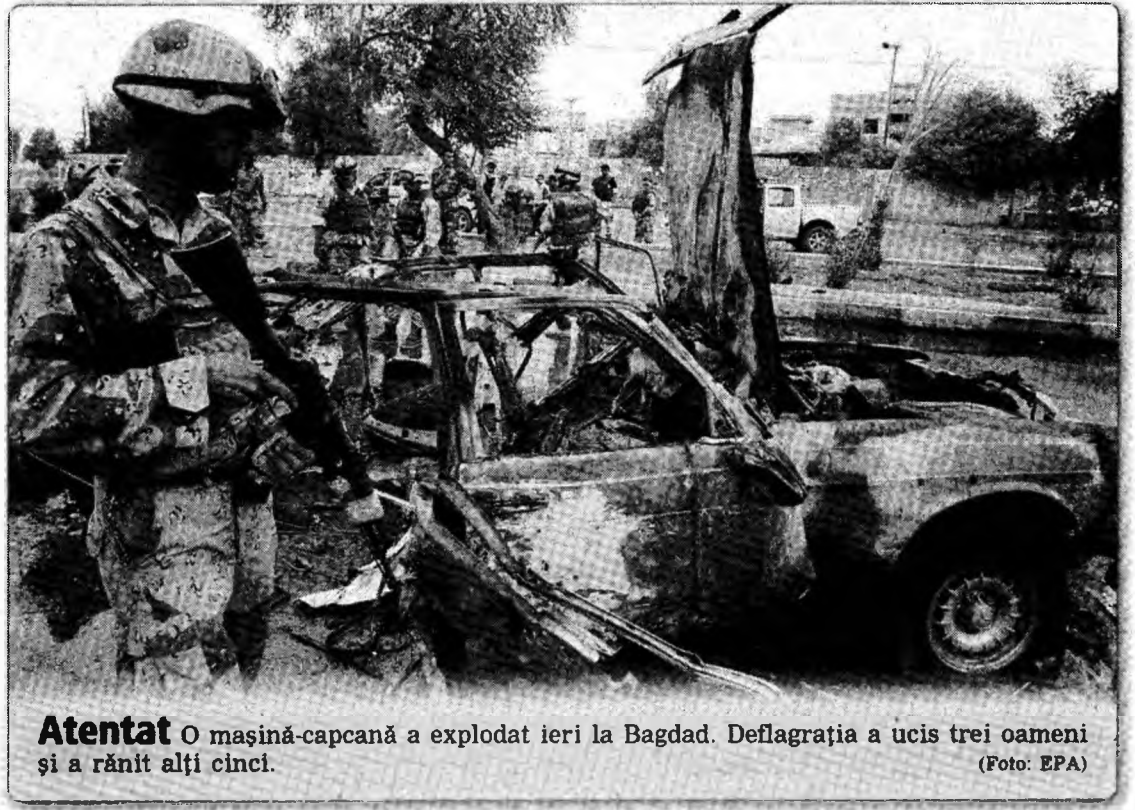
Atentat O mașină-capcană a explodat ieri la Bagdad. Deflagrația a ucis trei oameni și a rănit alți cinci.

Discuțiile multilaterale în dosarul nuclear nord-coreean, blocate de aproximativ un an, vor fi reluate până în luna noiembrie, a declarat, ieri, la Beijing, emisarul american Christopher Hill.