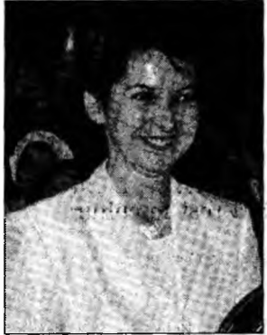
Barbara Prammer

Viena (MF) - Parlamentul austriac, dominat de social-democrați după alegerile de la 1 octombrie, va fi condus de o femeie, Barbara Prammer, fapt fără precedent în istoria țării. Prammer, o social-democrată cu vederi feministe care era vicepreședintele Camerei inferioare a Parlamentului Naționalrat, a fost aleasă în noua funcție cu 135 de voturi din totalul de 183. De formare sociolog, mamă, divorțată, Prammer s-a lansat în politică în provincia natală, unde s-a angajat în apărarea drepturilor omului în general și a femeilor în particular. Prammer s-a afirmat în politica federală în anii 1990 ca ministru pentru Condiția Femeii. În 2004, ea a devenit vicepreședinte al Naționalrat.