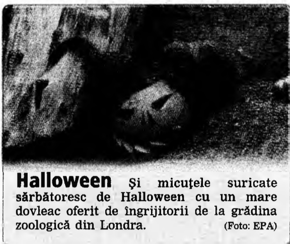
Halloween și micuțele suricate sărbătoresc de Halloween cu un mare doivleac oferit de îngrijitorii de la grădina zoologică din Londra.

Los Angeles (MF) - Actrița Reese Witherspoon și soțul său, actorul Ryan Philippe, au hotărât să se despartă, conform unui comunicat emis de reprezentanții cuplului. „Anunțăm cu tristețe că Reese și Ryan au decis să se despartă. Vor continua să se implice în familia lor și vă cerem să respectați intimitatea și siguranța copiilor lor”, se indică în acest comunicat. Witherspoon și Ryan Philippe s-au întâlnit pe platourile de filmare la drama „Tentația seducției”, în 1997.