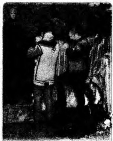
Intervenție Din peștera denumită Grotta Bossi, din Elveția, echipe de speologi urmau să scoată cadavrul unui speolog italian care fusese într-o tură de explorare împreună cu alți trei colegi.