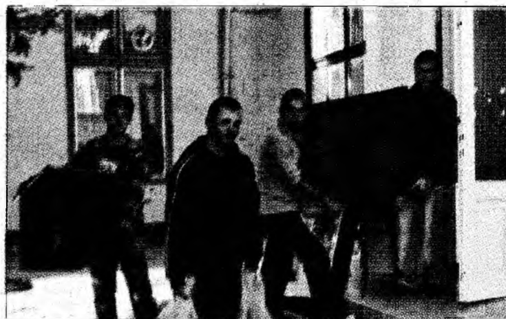
Cultura se mută a doua oară în trei săptămâni

Dar să revenim la schimbarea sediilor Direcției. Asta pentru că ieri s-a petrecut o nouă mutare. De la grădinița de pe strada G. Barițiu, birourile Direcției s-au pus din nou în mișcare. Sediul nou a fost stabilit la etajul trei al clădirii Minvest. Cea mai mare nedumerire a tuturor celor care au aflat este faptul că imobilul se află sub pază militarizată și că la intrare toată lumea trebuie legiti-