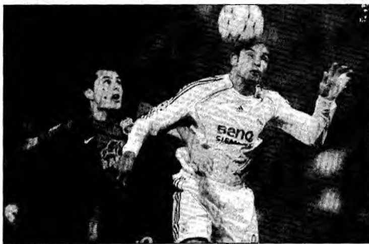
Duelul Dică-Emerson poate fi cheia meciului

Gigi Becali a afirmat că este posibil să se întâmple o minune, iar Steaua să câștige partida cu Real. „Plec cu gândul să facem un rezultat bun.