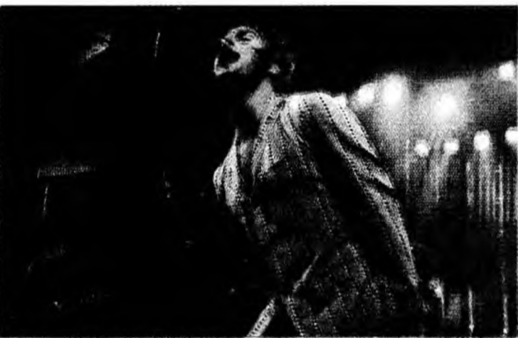
Oasis, „cea mai bună trupă din lume”

Oasis a fost premiată la categoria „cea mai bună trupă din lume”, în timp ce Noel Gallagher, solistul trupei, a primit premiul pentru cel bun compozitor. Trupa Arctic Monkeys a câștigat premiul pentru cel mai bun album și premiul publicului, în timp ce trupa irlandeză U2 a primit premiul pen-