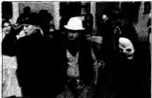
Elevii şi-au etalat costumele de Halloween