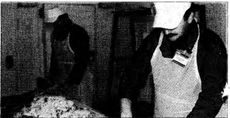
În judeţ vor exista două abatoare moderne pentru sacrificarea animalelor

gramul SAPARD. Dintre acestea, 117 proiecte sunt conforme, 99 dintre ele primind finanţare. Valoarea totală a proiectelor este de 85,7 mil. euro, ceea ce situează judeţul pe locul doi în Regiunea V Vest, după judeţul Timiş. În cadrul acestor proiecte, 11 vizează