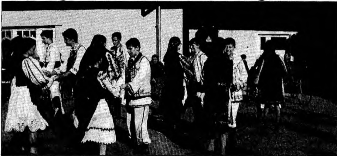
Ansamblul de copii de la școala din Luncoiu de Jos au prezentat un program artistic