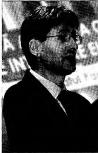
Leonard Orban

Leonard Orban (45 ani) a semnat Tratatul de aderare a României la UE în aprilie 2005, în calitate de negocia-