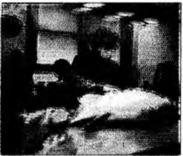
Cercetătorii sunt în alertă

Hong Kong (MF) - Cercetătorii au identificat o nouă tulpină, deosebit de rezistentă, a virusului H5N1 al gripei aviare, ceea ce generează noi temeri în legătură cu riscul izbucnirii unei pan-