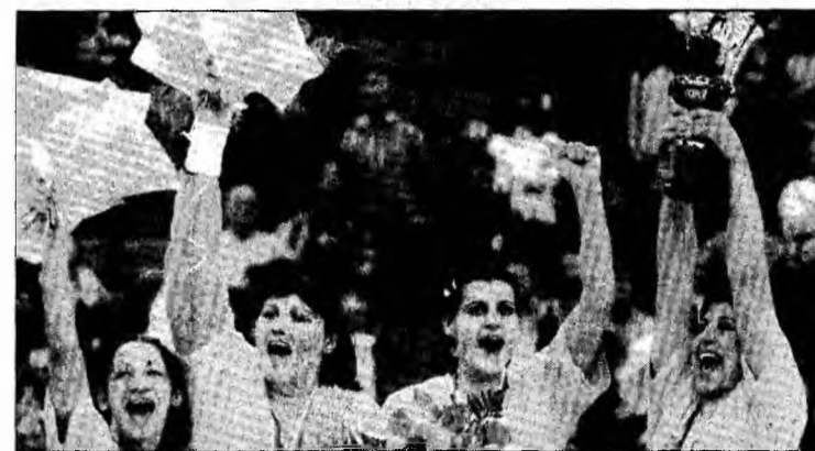
Tricolorele pe podiumul Campionatului Mondial din 2005

Conform regulamentelor EHF jucătoarele care evoluează în străinătate pot fi convocate la națională doar 30 zile într-un an calendaristic, iar echipa României mai are trei acțiuni până la finalul anului 2006 (Cupa Mondială din Danemarca, Cupa Turcin din Ucraina și turneul de calificare în play-off-ul CM din