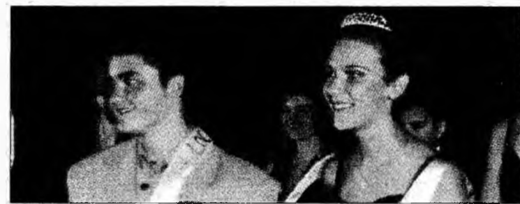
Miss și Mister la Balul Liceului Sportiv

Proba opțională a fost cea care a dat culoare atmosferei care s-a incins în final cu parada modei. Publicul a participat afectiv și a susținut concurenții prin incurajări. Participanții au fost încântați de reușita balului. „Am așteptat acest bal cu sufletul la gură. Sunt două luni de când