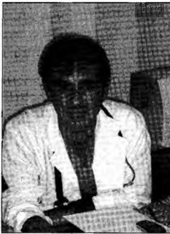
Medicul de familie recomandă cine nu plătește sănătatea

Chiar dacă se știe că nu plătesc asigurări, ei trebuie să facă dovada faptului că pot beneficia de calitatea de asigurat. O primă condiție în acest sens este să se prezinte la medicul de familie, care va stabili dacă se înscriu sau nu într-o anumită categorie. Medicul va trimite CJAS actele doveditoare și va trebui să fie informat despre orice mo-