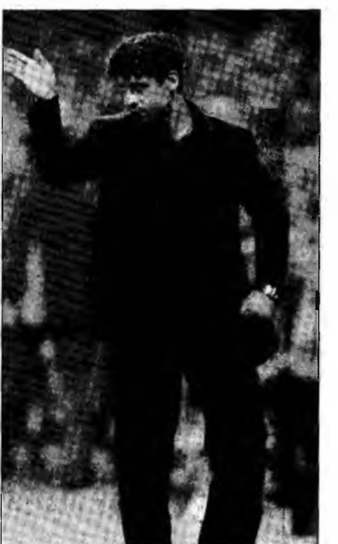
Frank Rijkaard

El Mundo Deportivo mai susține că președintele catalanilor, Joan Laporta, ar fi la curent cu această situație și deja caută un succesori. Printre tehnicienii doriți de Laporta s-ar afla chiar Marco van Basten, dar și Ronald Koeman, antrenorul echipei PSV Eindhoven. O a treia opțiune ar fi Bernd Schuster, actualul antrenor al echipei Getafe. Frank Rijkaard a mai antrenat echipa Olandei, cu care a ajuns până în semifinalele Campionatului European din 2000, iar apoi și-a reziliat contractul.