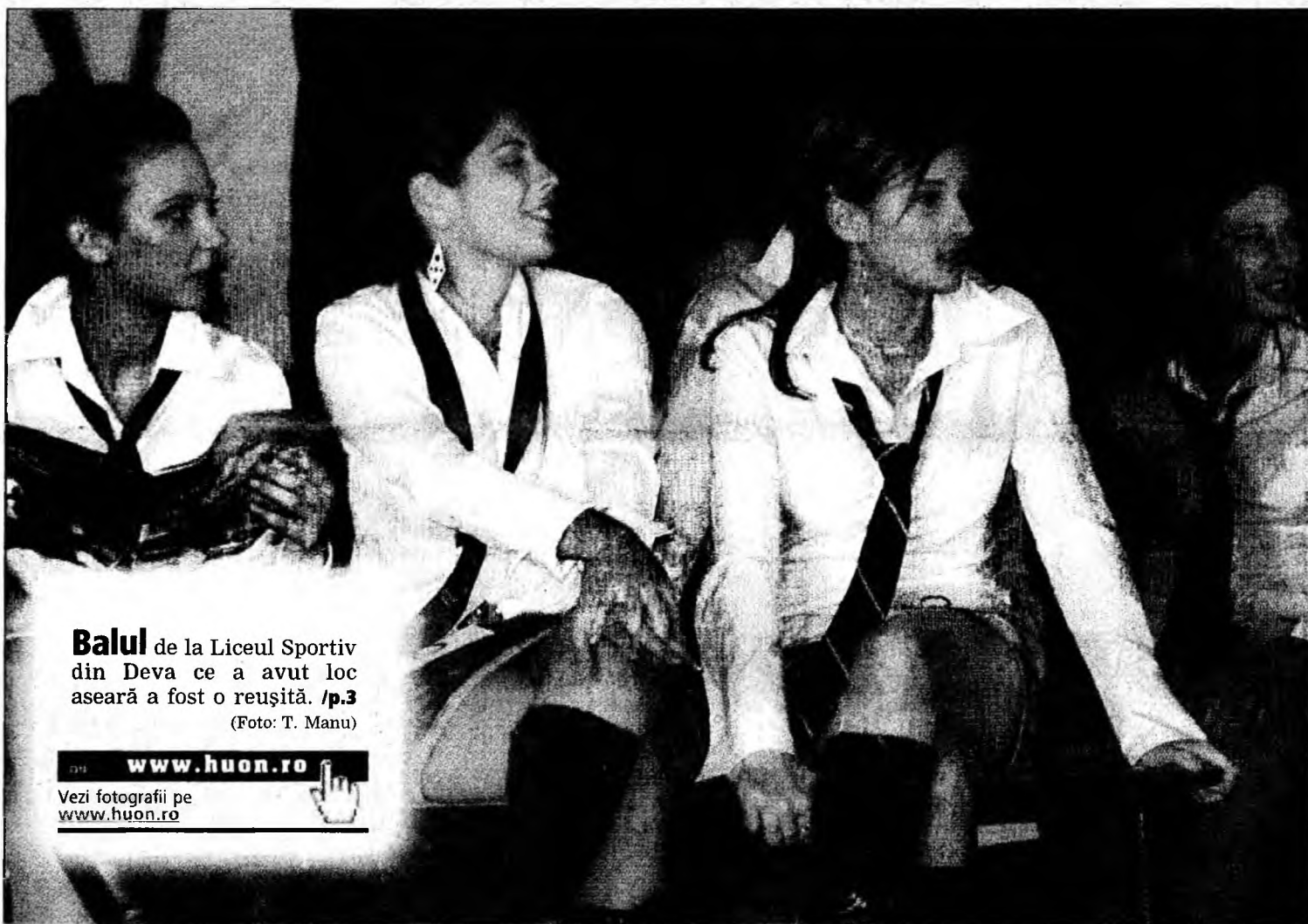
Balul de la Liceul Sportiv din Deva ce a avut loc aseară a fost o reușită. /p.3

www.huon.ro Vezi fotografiile pe www.huon.ro