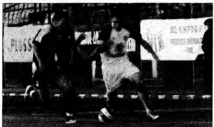
Minierii au nevoie de puncte ca de aer

Misiunea Jiului nu va fi ușoară, pentru că Marius Lăcătuș, antrenorul arădenilor, e conștient că locul ocu-