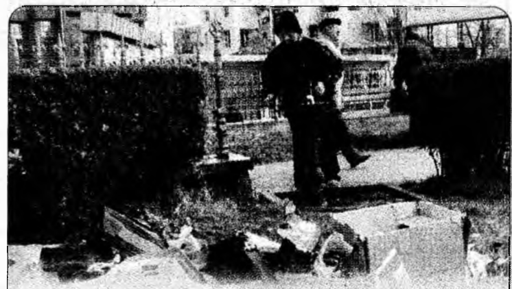
Nu ne place! În plin centrul Devei, parcul de la Opera mai are puțin și ajunge groapă de gunoi.