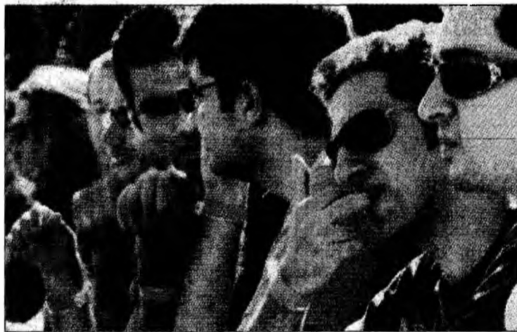
Homosexualilor, participanți la paradă

În oraș au fost desfășurate militari și membri ai poliției de frontieră, în special în zona în care se află stadionul Universității Ebraice, unde s-a desfășurat manifestația