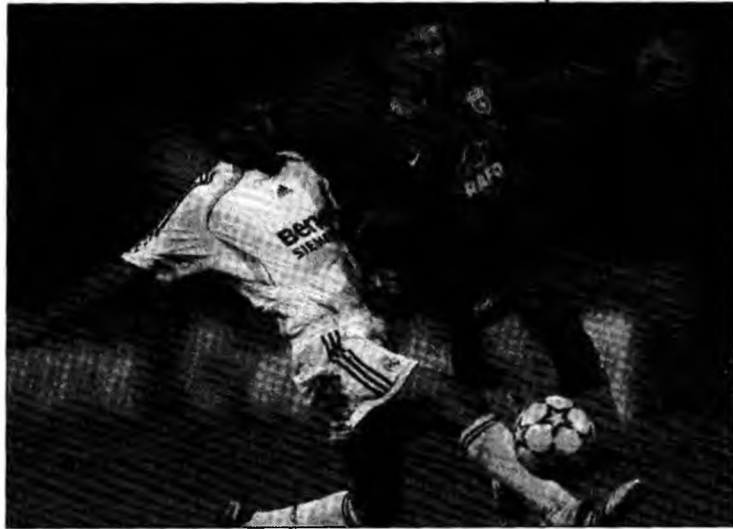
Steaua a scăpat de penalizare, unicul penalizat fiind patronul

La finalul derbiului din etapa a VIII-a a Ligii I, Becali l-a făcut „hoț” și „șpagangiu” pe arbitrul Sorin Corpodean, acuzându-l că a favorizat