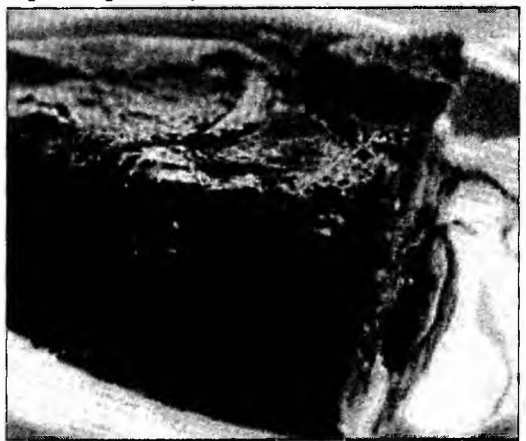
Poftă bună!

Ingrediente: 5 mere (soiul Golden), 3 ouă, 150 g miere, 150 g făină, 200 g unt. Pentru caramel - 20 bucăți de zahăr (100 g). Mod de preparare: Încingeți cuptorul la 180 grade și preparați zahărul ars, punând pe foc, într-o craticioară cu fundul gros, zahărul împreună cu 2 linguri de apă. Când începe să se îngălbenească, turnați-l într-o formă cu pereți detașabili pe care-o înclinați pe toate părțile, pentru că zahărul ars să acopere atât fundul, cât și pereții. Curățați merele și tăiați-le în sferturi. Topiți untul și amestecați-l cu ouăle, mierea și făina (în robotul de bucătărie sau cu telul). Așezați merele în tavă peste zahărul caramel, turnați peste ele aluatul și dați prăjitura 40 de minute la cuptor. După ce o scoateți din cuptor, răsturnați-o pe un platou și serviți-o caldă sau rece.