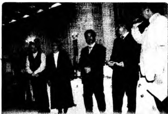
CCI Hunedoara a premiat, într-un cadru festiv, oamenii de afaceri cu cele mai bune rezultate economice. /p.5 Alte poze pe www.huon.ro