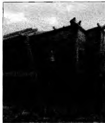
Salariile în construcții cresc

lună. Pentru a împiedica migrația forței de muncă către alte state cu salarii mai mari, ar trebui ca într-un an și jumătate salariul mediu brut să ajungă măcar la nivelul celui înregistrat în statele care au aderat în 2004 la Uniunea Europeană, respectiv 400-450 euro pe lună”, a spus vicepreședintele ARACO, la un seminar pe teme economice. Forța de muncă calificată în construcții este tot mai greu de găsit, iar ARACO va propune instituțiilor europene un set de mecanisme prin care va fi diminuată recrutarea de angajați din România. „În toate țările UE există firme specializate în recrutarea forței