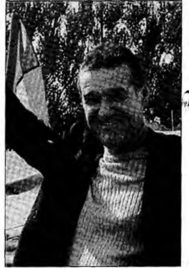
Gigi Becali

Patronul Stelei, Gigi Becali, a declarat că membrii Comisiei de Disciplină a FRF i-au făcut un mare bine atunci