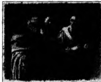
Tabloul lui Caravaggio

Caravaggio (1571-1610) este considerat primul mare reprezentant al școlii de artă barocă.