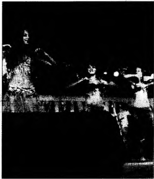
Se vor organiza spectacole în Petroșani

Petroșani (S.B.) - Manifestările derulate în preajma sărbătorilor de iarnă au cuprins toate localitățile județului. De plidă, la Petroșani se va derula, vineri 15 decembrie, de la ora 17.00, spectacolul de dans modern intitulat „Vine, vine Moș Crăciun”, care a ajuns la cea de-a VI-a ediție. Spectacolul are loc la Teatrul Dramatic „I.D. Sârbu”, pe scena căruia vor evolua 130 de copii. Pe lângă copiii din Petroșani vor evolua elevi de la cercurile de dans modern de la Clubul Copiilor Vulcan și Palatul Copiilor Deva. În aceeași zi, la Muzeul Mineritului din Petroșani se va vernisa expoziția „Suflet de copil în prag de Crăciun”, în cadrul căreia sunt expuse și lucrări realizate de copii de la Cercul de pictură și Cercul de metaloplastie din cadrul Clubului Copiilor Petroșani.