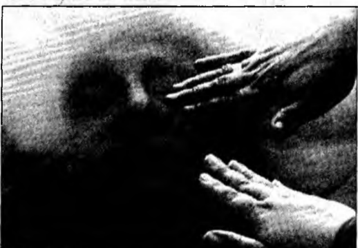
Sicriul lui Pinochet atins de susținătorii acestuia

Ulterior, violențele s-au extins în cartierele periferice ale orașului Santiago, unde manifestanții au incendiat baricade și cel puțin trei vehicule, iar forțele de ordine au tras focuri de armă.