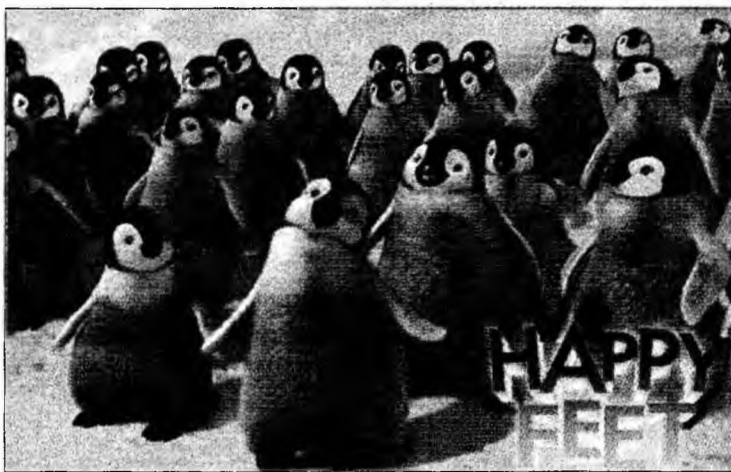
„Happy Feet”, cel mai bun lungmetraj animat

Filmul în limba japoneză „Letters from Iwo Jima”, în regia lui Clint Eastwood, a luat premiul pentru cel mai bun film al anului 2006. Actorul Forest Whitaker a fost desemnat cel mai bun actor pentru rolul dictatorului Idi Amin din