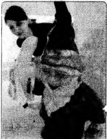
Piticul de grădină face parte dintr-o expoziție deschisă la Bonn, având alte 1.000 de exponate care prezintă simboluri ale Republicii Democratice Germania, respectiv ale Germaniei Federale.