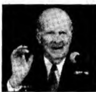
James Baker