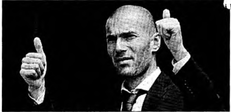
Zidane a fost primit cu mare bucurie în Algeria

București (MF) - Fostul internațional francez Zinedine Zidane a sosit, luni, în Algeria, țara de origine a părinților săi, el fiind întâmpinat pe aeroportul din Alger de 150 de reprezentanți mass-media. Zidane a zâmbit, dar nu a dat declarații în incinta aeroportului, iar agenții de securitate au avut probleme cu cei 150 de fotografi, cameramani și reporteri care doreau să ajungă la avionul ce a oprit în fața salonului oficial. Zinedine Zidane, însoțit de mama și tatăl său, a fost întâmpinat de ministrul algerian al Tineretului și Sporturilor, Yahia Guidoum, și de ministrul Muncii