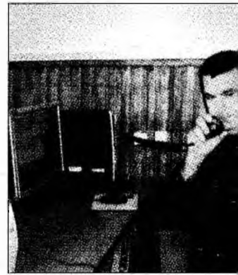
În timpul demonstrației practice

puns unei solicitări fictive: aplanarea unui conflict violent izbucnit între două „găști de cartier”. Odată verificată veridicitatea solicitării, dispecerul de la 112 a transmis informația jandarmilor, care au pornit în trombă spre locul incidentului. Au reușit să aplaneze starea conflictuală și să acorde primul ajutor unei persoane rănite în urma așa-ziselor încăierări dintre membrii celor două găști. Generalul de brigadă Olimpiodor Antonescu a de-