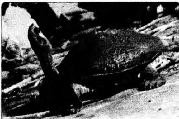
Țestoasa se bucură de puțin soare în iarna friguroasă care s-a instaurat la grădina zoologică Guwahati, India

Berlin (MF) - Dieter Bohlen, fost membru al trupei Modern Talking, a fost legat și jefuit, ieri dimineață, de doi bărbați. Cei doi, ale căror fețe erau acoperite de măști, l-au amenințat pe portarul imobilului cu un cuțit de bucătărie și o armă de foc pentru a putea intra în locuința cântărețului aflată în apropiere de Hamburg. Hoții au sustras obiecte de valoare, apoi l-au legat pe Bohlen, pe iubita sa, pe portar și pe o menajeră, după care au plecat. Nimeni nu a fost rănit, a declarat poliția care a precizat că nu se cunoaște încă valoarea pagubelor.