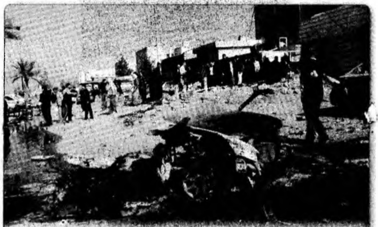
Explozie O bombă a explodat ieri în fața unei universități din Bagdad, deflagrația ucigând un civil și răniind alți patru.

La rândul său, Gheorghe Flutur a declarat, că a fost „o