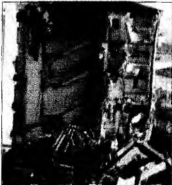
Clădirea de cinci etaje s-a prăbușit

Imobilul făcea parte dintr-un complex de două clădiri de câte cinci etaje și includea circa zece apartamente. Un comunicat oficial a exclus ipoteza unui atac terorist, autoritățile afirmând că este vorba despre o explozie accidentală.