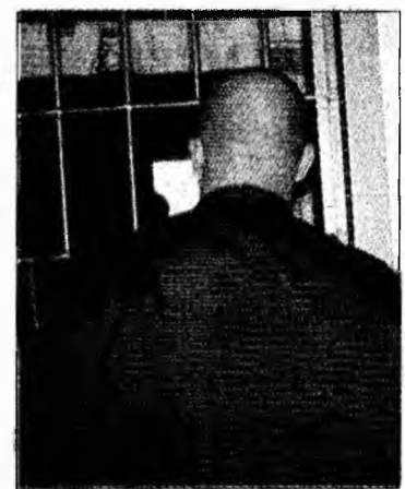
Deținuții vor să fie grațiați

gătură cu lipsa regulamentului de aplicare a Legii 275/2006 privind executarea pedepselor, dar și în ceea ce privește inițiativa legislativă privind emiterea unui decret de grațiere”, a menționat purtătorul de cuvânt, care a precizat că protestul a început ca urmare a solidarizării deținuților cu ceilalți condamnați care se află în diferite penitenciare din țară.