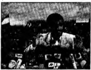
Mahmud Ahmadinejad

Teheran (MF) - Zeci de studenți iranieni au încercat să boicoteze discursul președintelui Mahmud Ahmadinejad, fiind întâmpinați violent de colegii de-ai lor, susținători ai controversatului lider de la Teheran. Potrivit agenției semioficiale FARS, studenții de la Universitatea Amir Kabir au scandat „Moarte dictatorului” și au încercat să urce pe podiumul unde Ahmadinejad rostea un discurs. Protestatarii au dat foc unor portrete ale președintelui și au lansat petarde. Ei au fost contracarați de susținătorii ai președintelui, care au scandat „Ahmadi, Ahmadi, noi te susținem!”. Potrivit agenției ISNA, Ahmadinejad a răspuns: „Toată lumea trebuie să știe că președintele este pregătit să fie ars în drumul spre libertate, independență și justiție”.