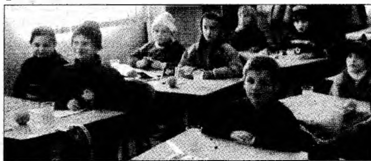
Elevii din Visca s-au bucurat de atenția studenților din Petroșani

Visca - În week-end-ul recent încheiat studenții din Petroșani, reprezentanți ai Sindicatului Studenților Democrați (SSD) de la Universitatea din Petroșani, au avut o acțiune prin care au oferit cadouri și au ținut diferite ședințe de training elevilor Școlii Generale din Visca, județul Hunedoara. Aici, la clasele I-IV ei au dat cadouri constând în portocale, cioco-