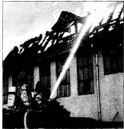
Intervențiile pompierilor vor fi mai scumpe