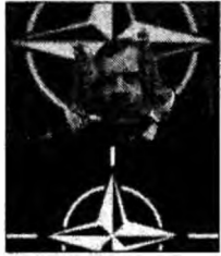
Jaap de Hoop Scheffer

Bagdad (MF) - Schimbările de focuri au încetat în cursul nopții de marți spre miercuri în cartierul Haifa, din centrul Bagdadului, unde trupele americane și irakiene au lansat, marți, o vastă operațiune comună împotriva insurgenților sunniți.