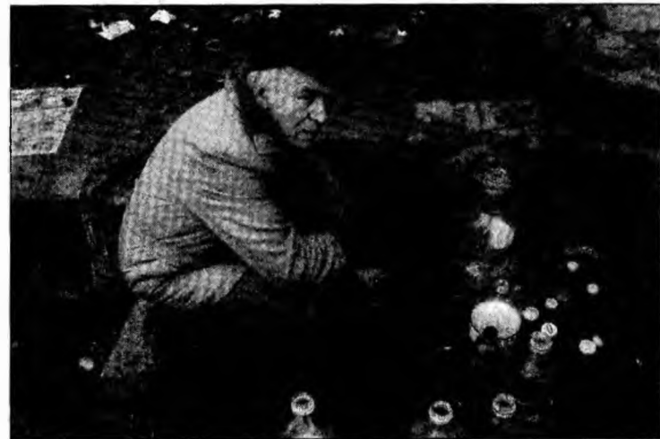
La izvorul de la Bejan vin cu preponderență locatarii din cartierul Micro 15, care nu au apă rece la robinete.

Până se va găsi vinovatul și se vor achita banii, oame-