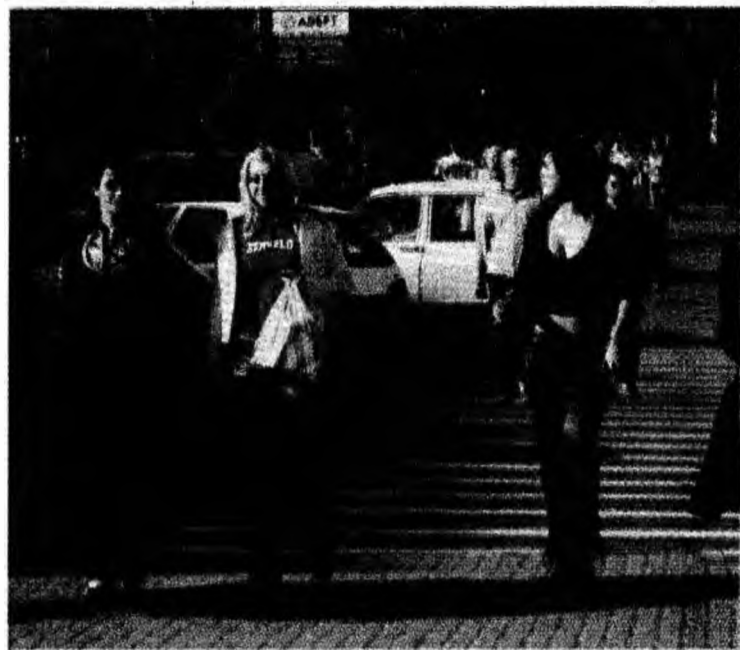
Peste 500 de cetățeni străini din statele UE și cele terțe Uniunii Europene sunt locuitori ai județului Hunedoara