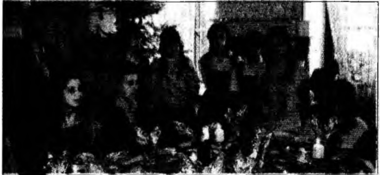
Elevii de la „Decebal” în timpul unei acțiuni despre UE

grarea” liceului la care învață, Colegiul Național „Decebal”, încă de la sfârșitul anului trecut. În cadrul unui proiect care are ca obiectiv cunoașterea, de către tineri, a simbolurilor, obiceiurilor și tradițiilor statelor membre UE, „decebaștii” vor scoate un număr special al revistei liceului, „Noduri și Semne”, dedicat în totalitate evenimentului de la 1 ianuarie 2007. După ce anul trecut elevii „Decebalului” au realizat spectacole prin care au scos în evidență atât obiceiurile și tradițiile românești, cât și cele ale statelor UE, acum ei își vor așterne ceea ce au studiat și pe hârtie. La numărul special al revistei vor participa toți cei 1200 de elevi ai liceului, dar cei care au depus cel mai mult efort sunt, alături de Consili-