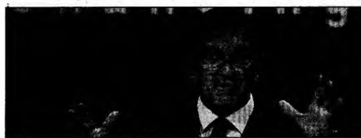
Președintele CE, Jose Manuel Barroso

„Nu este în interesul unei țări furnizoare sau de tranzit să nu apară credibilită. Este de datoria lor să reinstaureze credibilitatea de care au beneficiat pe o perioadă atât de lungă de timp”, a declarat el,