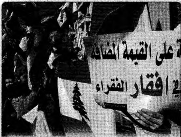
Anti Mii de libanezi, susținători ai mișcării Hezbollah, au protestat ieri la Beirut, pentru a doua zi, împotriva planului de reforme promovate de guvern.

Legea pentru modificarea și completarea Decretului-Lege 118/1990 urmărește să realizeze o reparație morală pentru persoanele care s-au împotrivit față de, chiar prin acțiuni armate, regimului totalitar comunist.