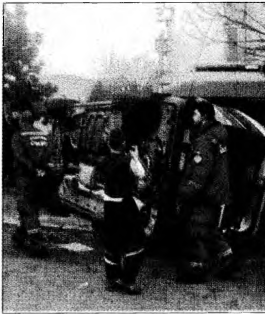
Nici una din persoanele aflate în ambulanță nu a suferit leziuni grave