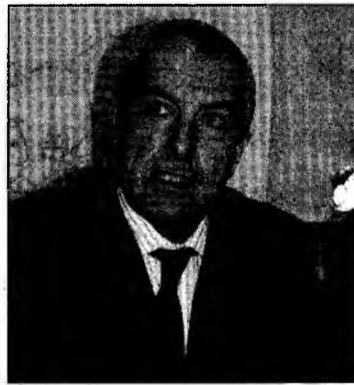
Călin Popescu Tăriceanu, singurul candidat la șefia PNL

Statutul care va fi aprobat la Congres va cuprinde o prevedere conform căreia depu-