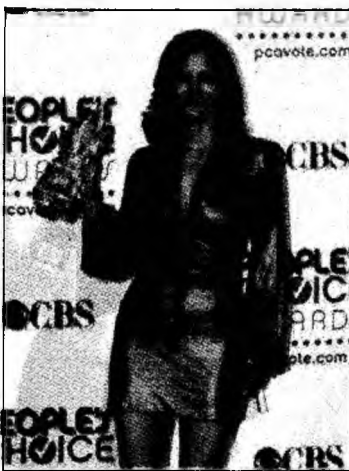
Halle Berry

Johnny Depp, nominalizat la trei categorii, a câștigat premiul pentru actorul favorit al publicului, pentru cel mai bun actor într-un film de acțiune, pentru care a concurat cu Samuel L. Jackson și Jet Li, și