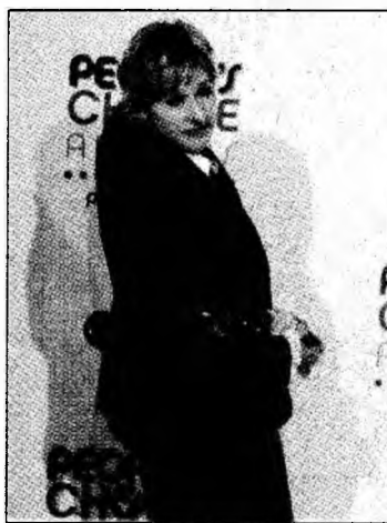
Ellen DeGeneris

pentru cel mai bun parteneriat pe ecran, cu colega sa, Keira Knightley. „Pirații din Caraibe: Cufărul omului mort”, lider de