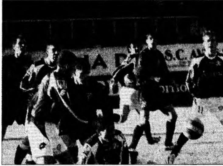
Jiul a început pregătirile pentru retur