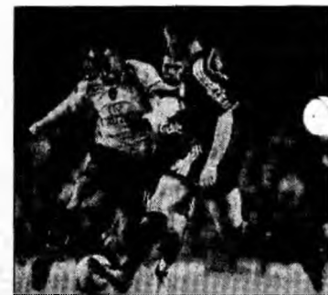
Liverpool a fost învinsă de două ori de Arsenal în doar o săptămână

învățat să accept înfrângerea și să încerc să le uit cât mai repede posibil. Nu este momentul să arătăm pe cineva cu degetul sau să dăm vina pe cineva. Câștigăm împreună și pierdem împreună. Acum trebuie să ne gândim la Premiership și Champions League”, a spus Benitez.