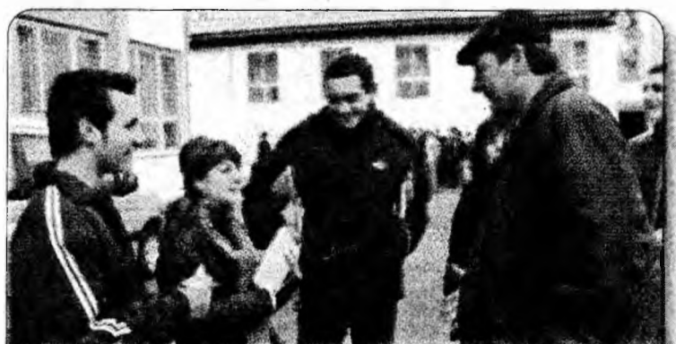
A treia zi de practică a elevilor din clasa a XI-a de la Colegiul Tehnic „Transilvania” Deva, în „haină de jurnalist”, i-a purtat... pe la școli.

manifestat reticență, am reușit să convingem și sperăm ca procesul început să continue cu succes. Un caz aparte legat de opoziția comunității locale l-am întâmpinat la Clopotiva, dar și acolo lucrurile s-au rezolvat! În munca noastră de convingere am fost ajutați de repartizarea microbuzelor. La Pui au fost repartizate două microbuze pe motivul că prin comasarea școlilor elevii sunt mai numeroși”, a precizat inspectorul general al IȘJ Hunedoara. Anișor Părvu.