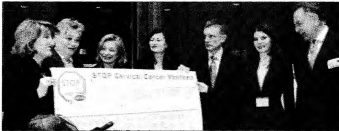
Monica Iacob Ridzi (a doua din dreapta) împreună cu semnatarii apelului

Deva (M.S.) – Europarlamentarul Monica Iacob Ridzi, membru al PD, a anunțat că se va implica în elaborarea unui proiect de lege care să asigure accesul gratuit al femeilor din România la teste și vaccinare împotriva virusului care declanșează cancerul de col uterin. „În momentul de față, la nivelul Uniunii Europene nu există o directivă prin care să se impună statelor membre anumite programe pentru prevenția cancerului de col uterin, deși această boală a fost identificată ca fiind una dintre bolile care provoacă cele mai multe decese”, afirmă deputatul hunedorean. Un grup de parlamentari europeni, printre care Monica Iacob Ridzi, a