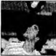
Gonzalo Higuain