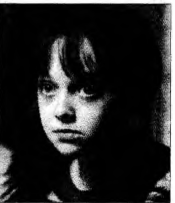
Dakota Fanning

Serviciile meteorologice din Spania au anunțat că valul de frig care a cuprins Peninsula iberică se va menține în următoarele zile, fiind prognozate căderi masive de zăpadă și temperaturi foarte scăzute.