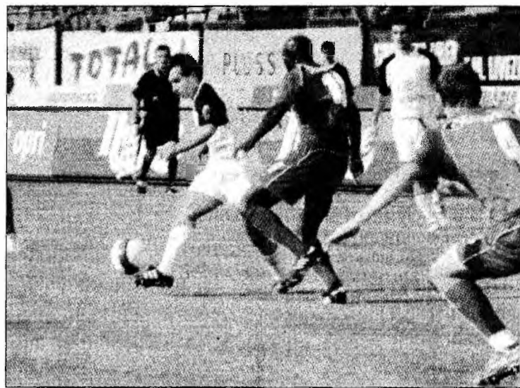
Oficialii echipei vor face apel