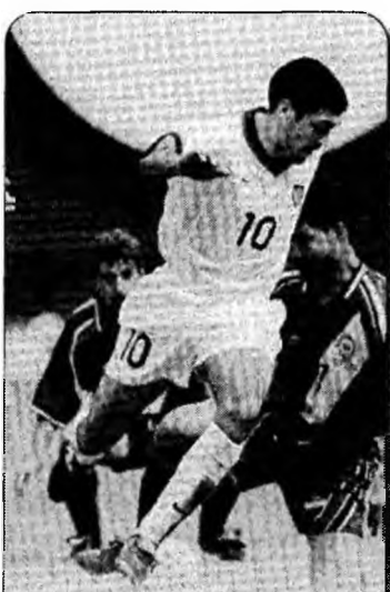
Gruparea Manchester City a decis să rezilieze contractul jucătorului american Claudio Reyna, acesta urmând să părăsească echipa engleză.

avea loc tot joi, se vor întâlni jucătoarea americană Serena Williams și sportiva cehă Nicole Vaidisova, cap de serie numărul 10.