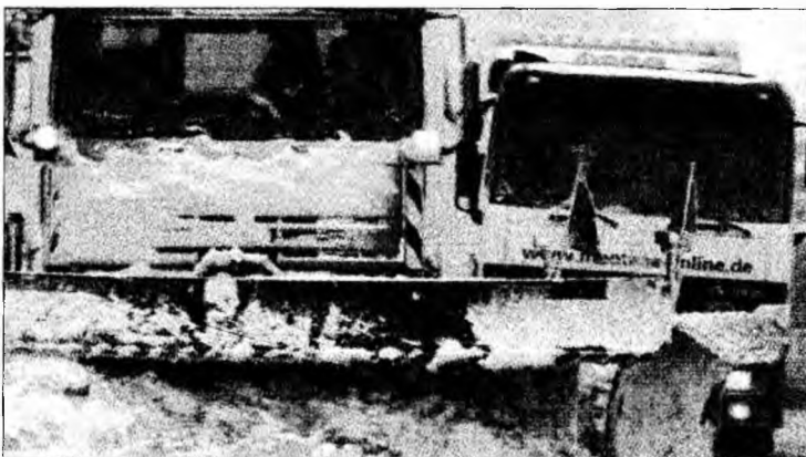
Autostrada A8, în apropiere de Holzkirchen, Germany, a fost deblorată

Berlin (MF) - Mai multe țări europene sunt afectate de căderi masive de zăpadă, fiind înregistrate numeroase accidente în timp ce mai multe aeroporturi și-au întrerupt activitatea. Traficul rutier și aerian a fost puternic perturbat, ieri, în sudul Germaniei, din cauza căderilor de zăpadă care au provocat moartea a doi automobilisti. Mai multe porțiuni de autostradă au fost blocate din cauza accidentelor auto provocate de stratul de polei. Ninsorile au început marți