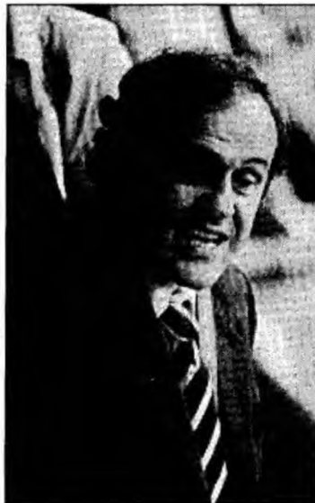
Michel Platini

Victoria lui Platini ar fi un triumf al fotbalului asupra politicului. După o primă experiență nefericită în fruntea naționalei Franței, echipă pe care a părăsit-o a doua zi după eliminarea din primul tur la Euro-92, fostul jucător a intrat în culisele instituțiilor de fotbal. Consilier special al