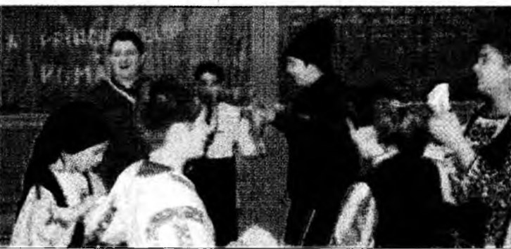
Scenetă interpretată de copii: „Moș Ion Roată și Unirea”

în Europa”. La Școala Generală Simeria, elevii s-au adunat pentru a recrea atmosfera de acum 138 de ani. După ce au cântat și au dansat „Hora Unirii”, școlarii au prezentat două scenete istorice în care protagoniști au fost Alexandru Ioan Cuza și țăranul Moș Ion Roată. Clubul Copiilor din Hunedoara a organizat concursul județean „Minunea veșniciei uniri”, la care au participat 100 de copii de clasa a IV-a de la diferite școli din Deva, Hunedoara și Călan. Cu această ocazie, actorii Cercului de Teatru de la Clubul Copiilor din Hunedoara au interpretat o scenetă intitulată „Ocaua lui Cuza”.