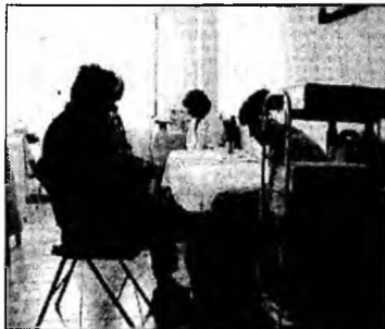
Reduceri la sejur în stațiuni

la cele de două stele, și 330 lei la unitățile de trei stele. Tarifele cuprind TVA și un comision de 10% pentru agențiile de turism vânzătoare.