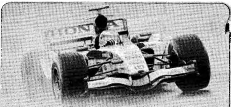
Noul monopost al echipei Super Aguri-Honda, SA07, a eșuat la testul Federației Internaționale de Automobilism (FIA), obligând astfel echipa de Formula 1 să amâne debutul pe pistă al noii mașini.

abandonat în turul 36 din cele 70 ale primei curse din istoria CM de F1, câștigată de italianul Emilio Giuseppe „Nino” Farina (Ferrari). El a reușit să câștige cursa din Marea Britanie în 1949, când s-a aflat la volanul unui Maserati. Emmanuel de Graffenried, care deținea titlul de baron, s-a retras din competiții în 1956, el dedicându-se afacerilor cu mașini în Lausanne. În 1970, fostul pilot a devenit ambasadorul firmei Philip Morris, care devenise unul dintre prin-