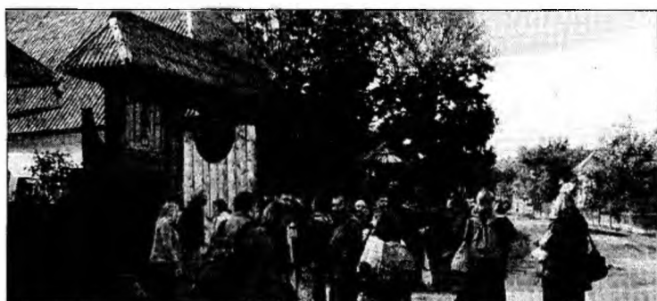
Pensiunile au nevoie de autorizații

lor de Păduri din România. Acțiunea se va desfășura la Casa de Cultură „Drăgan Muntean” din municipiul Deva, vineri, 26 ianuarie, cu începere de la ora 13. La ora actuală, în județul Hunedoara, funcționează un singur ocol silvic, cel de la Orăștie, care se află în subordinea Consiliului Local. Un altul, în Valea Jiului, la Petrila, se află aproape de finalizarea constituirii juridice. La nivel național, cel mai bine funcționează ocoalele silvice din județul Sibiu.