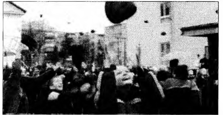
Sărbătorirea Unirii la Școala „Andrei Șaguna” din Deva