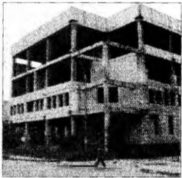
Clădirea aflată în construcție

merită să aibă un nou spațiu de învățământ deoarece elevii de aici obțin în fiecare an zeci de premii internaționale. O bucurie pentru muzicienii din liceu este recenta aprobare a sumei de un miliard de lei vechi pentru achiziționarea unui pian performant, de care elevii au mare nevoie.