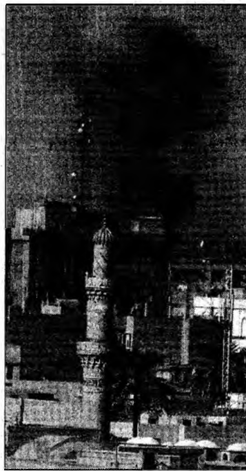
Fum deasupra centrului Bagdadului, unde au avut loc confruntări cu insurgenții

Bagdad (MF) - Forțele irakiene, susținute de trupele americane, au fost implicate, în cursul nopții de marți spre miercuri, într-o serie de confruntări violente cu insurgenții în centrul Bagdadului, luptele continuând și ieri dimineață, au anunțat serviciile de securitate.