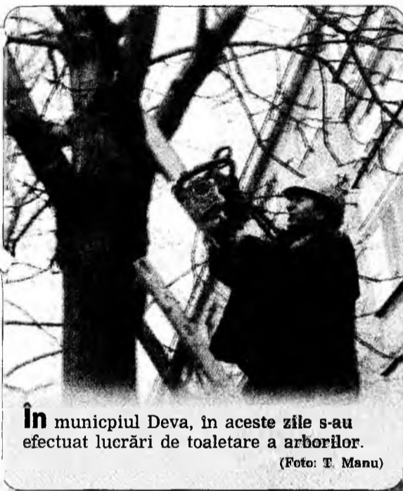
În municipiul Deva, în aceste zile s-au efectuat lucrări de toaletare a arborilor.

cu poliștii ai Serviciului Poliției Rutiere și cu cei din cadrul Postului de Poliție din localitatea Zam, în urma unui control i-au prins pe trei dintre aceștia. Pentru că i-au observat pe poliștii, ceilalți trei au reușit să fugă în pădurea din apropierea parcarii. /p.3