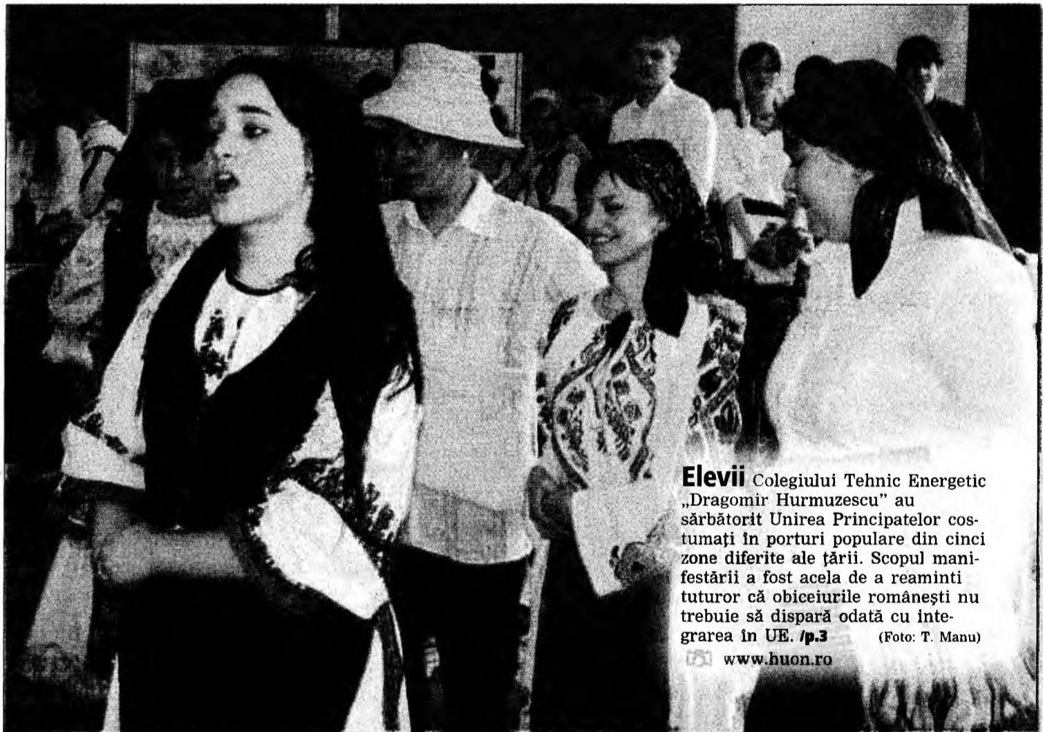
Elevii Colegiului Tehnic Energetic „Dragomir Hurmuzescu” au sărbătorit Unirea Principatelor costumați în porturi populare din cinci zone diferite ale țării. Scopul manifestării a fost acela de a reaminti tuturor că obiceiurile românești nu trebuie să dispară odată cu integrarea în UE. /p.3