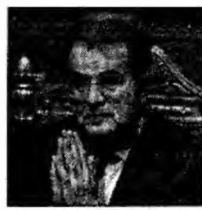
Romano Prodi

Potrivit sursei citate, atacatorul a fost arestat de forțele de ordine din Ciad.