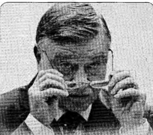
Președintele FRF, Mircea Sandu, candidază mâine, alături de alți 12 reprezentanți de asociații naționale, pentru un loc în Comitetul Executiv al UEFA.

Jucătorul rus Spahici a fost accidentat involuntar de portarul Bogdan Lobonț în timpul primei reprize, meciul fiind întrerupt timp de aproximativ cinci minute. După ce și-a revenit, jucătorul rus a reintrat în joc. În primul meci de pregătire, Dinamo a fost învinsă, cu scorul de 1-0, de Vitoria Guimaraes.