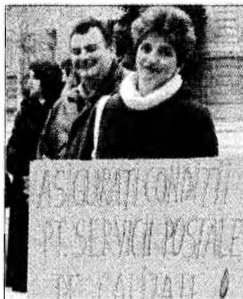
Poștașii vor continua protestele 4 zile, acest fapt va duce la blocarea totală a activității. Fe-

Deva – Acțiunile de protest ale sindicaliștilor din Poșta Română au debutat ieri cu pichetarea pentru două ore a Prefecturii Hunedoara. Sindicaliștii nu se vor opri aici și vor continua în 9 februarie cu programul de lucru conform normelor, fără să depășească cele opt ore de program. „În 3-