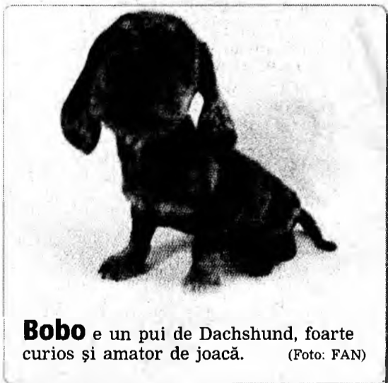
Bobo e un pui de Dachshund, foarte curios și amator de joacă.

Shipman a demarat în trombă și a oprit la o cabină telefonică unde a anunțat Poliția. Nowak a fost surprinsă în timp ce arunca la coș o perucă și un pistol cu aer comprimat. În geantă avea pardesiul, un ciocan, un cuțit, bandă adezivă, saci de plastic și 600 de dolari. În mașină s-au găsit mănuși chirurgicale, o hartă a zonei, o scrisoare de dragoste către Oefelein, adresa lui Shipman, precum și scutece. Nowak (43 de ani) a fost acuzată de asalt, tentativă de răpire, tentativă de jaf și distrugere de vehicul, Poliția recomandând arestarea ei fără posibilitatea de eliberare pe cauciuc.