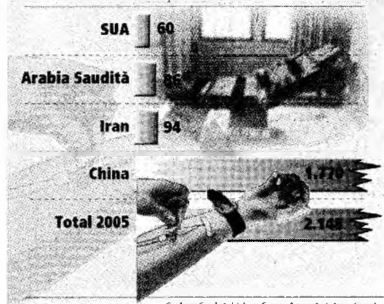
Grafică: Cuvântul Liber.

Deși europenii cer eliminarea pedepsei cu moartea, în lume șase oameni sunt uciși legal în fiecare zi - execuții în anul 2005 -