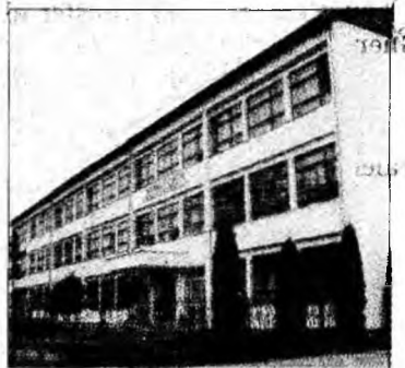
Colegiul devean al „italienilor”