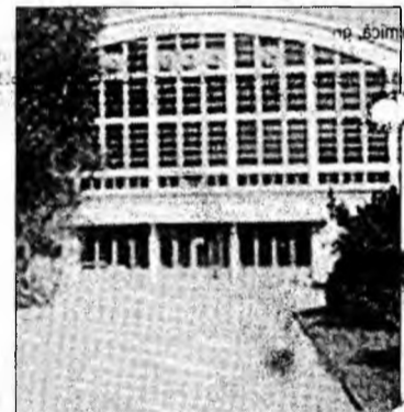
Sala „Lucian Grigorescu”

Dinamo de la ora 16.00 și Steaua, de la ora 18.00. Sâmbătă, derby-ul dintre cele două formații bucureștene nu s-a mai disputat, din cauza incidentelor dintre suporterii celor două formații, care au aruncat petarde și fumigene, inclusiv pe teren, obligând jandarmii să-i evacueze, iar pe oficialii meciului să anuleze disputarea acestuia.