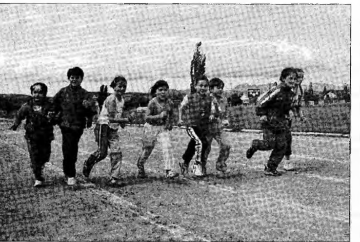
Se aleargă încă pe vechea pistă