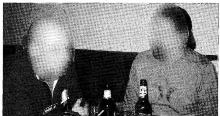
Tinerii, prea des atrași în baruri

Contactat de Cuvântul Liber, Gheorghe Răileanu, patronul barului Haos a fost interesat doar de modul în care am avut acces la această informație. „Nu comentez în nici un fel aceste acuzații. Vreau să văd raportul pentru a-i putea da în judecată pe cei care l-au întocmit. La mine în bar nu intră oricine. Am bodyguarzi care împiedică accesul polițiștilor în această incintă. Deci ei nu aveau de unde să vadă aceste lucruri”, a spus Răileanu. Dincolo de