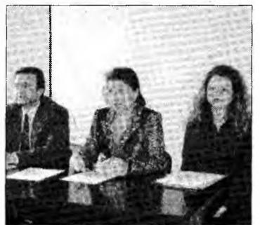
Momentul lansării noului proiect