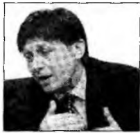
Crin Antonescu