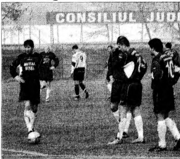
Corvinul s-a impus la limită în amicalul cu Mureșul Deva