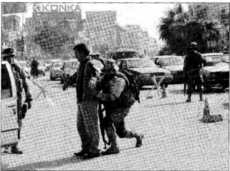
Punct de control în Bagdad

Noul plan a fost elaborat de irakieni, iar poliția și ofițerii armatei din comunitățile șiiite și sunnite fac parte din sistemul de comandă.