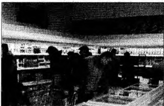
Nou magazin la Hunedoara

Hunedoara (M.S.) - Compania miniMax Discount deschide astăzi, în municipiul Hunedoara, un nou magazin, valoarea investiției ridicându-se la 750.000 de euro. Magazinul este amplasat în fosta Piață Viorele, din cartierul Micro 7, dispune de o suprafață de vânzare de o mie de metri pătrați și de 80 de locuri de parcare. Investiția creează 20 de noi locuri de muncă pentru hunedoreni. Compania miniMax Discount a ales să investească în municipiul Hunedoara datorită dinamicii constatate în viața economică a localității, dar și răspunsului prompt de care au dat dovadă autoritățile pentru dezvoltarea unui nou proiect. Noul magazin se înscrie și în strategia companiei de a se extinde în orașele cu peste 20.000 de locuitori, urmărindu-se practic crearea unei facilități moderne de comerț pentru consumatorii aflați în zonele ocolite încă de marile concerne internaționale, se arată într-un comunicat de presă.