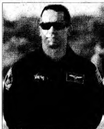
Bill Oefelein

rivala. Shipman când a ajuns la aeroport a observat că o femeie îmbrăcată într-un pardesiu o urmărea. A intrat în mașină și a încuiat ușile.