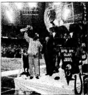
A câștigat Indianapolis Colts

Jakarta (MF) - Ploile torențiale care s-au înregistrat ieri au determinat creșterea nivelului apelor la Jakarta, unde autoritățile au avertizat cu privire la riscurile sanitare pentru cei 350.000 de sinistrați. Circa 40.000 de persoane au fost tratate pentru diferite afecțiuni, precum tuse sau boli diareice, potrivit oficialilor din sistemul sanitar. Autoritățile din domeniu au luat măsuri pentru prevenirea apariției unor maladii precum leptospiroza, o boală infecțioasă care se transmite în special prin mușcăături de șobolani, animale numeroase în capitala indoneziană. Maladii precum holera sau febra tifoidă ar putea apărea din cauza condițiilor sanitare precare.