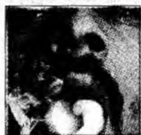
Snoop Dogg

Londra (MF) - Parodia „Borat! - Învățăturile din America pentru ca toată nația Kazahstanului să profite” ocupă primul loc în topul filmelor comandate de cinefilii kazahi de pe site-ul Amazon.co.uk. Parodia, distribuită de 20th Century Fox, compania deținută de News Corp., a avut încasări de 248 de milioane de dolari în lumea întreagă.