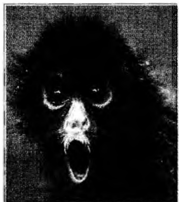
Maimuță păianjen

fetiță spațială care are două mame și una despre un pui de pinguin care are doi tați. Cărțile au fost introduse pentru început în 14 școli, iar dacă programul va avea succes, va fi extins. Grupurile religioase creștine au calificat inițiativa drept „imorală și păcătoasă” și au spus chiar că este o formă de abuzare a copiilor. Criticii spun că inițiativa încalcă legea care interzice propaganda gay în școli. Grupurile musulmane spun că poveștile „nu corespond invățăturilor islamice”. De cealaltă parte, susținătorii acestui proiect spun că homosexualitatea este un lucru normal care există în societate și că această inițiativă va ajuta la eliminarea atitudinilor homofobe în rândul copiilor.