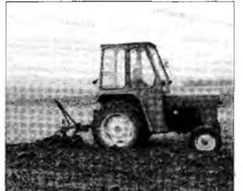
Se primesc cereri pentru subvenții

ții în Agricultură, în ziua și la ora programată, pentru întocmirea cererii în vederea obținerii sprijinului financiar pentru suprafața de teren agricol deținută.