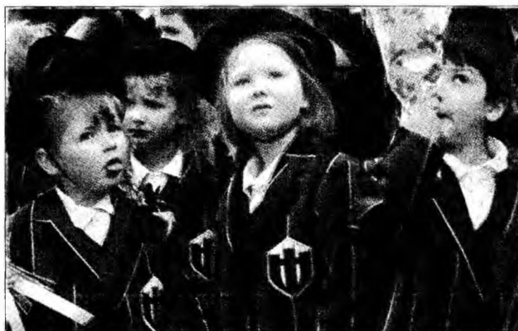
Copiii află că prinții nu se îndrăgostesc doar de prințese

Proiectul sprijinit de sindicatele profesorilor din Marea Britanie a costat 600.000 de lire sterline și este finanțat din bani publici. Inițiatorii proiectului „No Outsiders”, universitățile Sunderland și Exeter și Institutul pentru Educație,