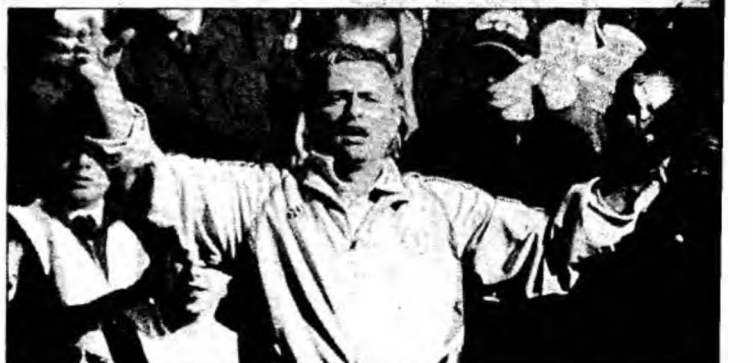
Antrenorul portughez a început să își spioneze viitoarea adversară

competițiile engleze. Am venit aici deoarece este singura posibilitate de a vedea Valencia la joc. Este greu de spus cine este favorit. Eu nu consider că Chelsea este favorită, așa cum nu vreau nici să consider Valencia favorită și trebuie să îmi pregătesc echipa cât mai bine posibil”, a spus Mourinho, sosit la Pamplona cu un avion privat.