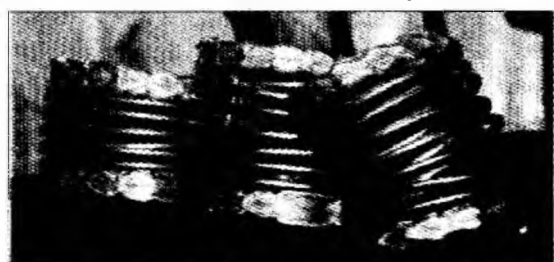
Brațările dacice se înmulțesc