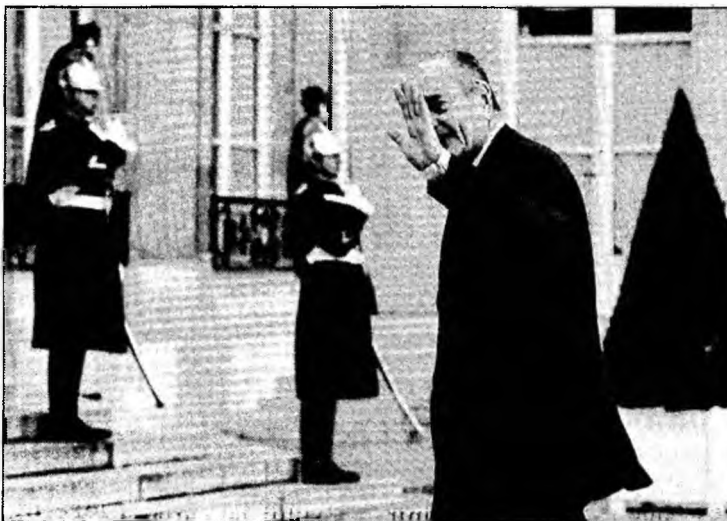
Președintele Chirac la final de mandat

„Jacques Chirac nu ar fi reușit să trezească Franța și francezii în special în domeniul economic”, potrivit cotidianului economic La Tribune. „Jacques Chirac va lăsa o Franță aflată într-o situație delicată”, subliniază publicația citată.