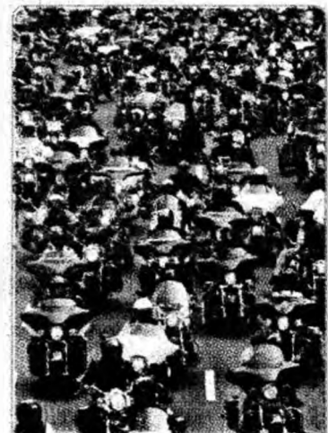
Bikeri La Jakarta s-au adunat la paradă bikeri pe Harley-Davidson. Sunt peste 6,5 milioane de vehicule înregistrate în Jakarta, din care aproape 51% sunt motociclete.

Londra (MF) - Milioane de primate sunt omorâte anual pentru mâncare, fapt ce a dus la dispariția a zeci de specii, avertizează două organizații care luptă pentru protecția mediului. Reprezentanții Care for Wild International și cei ai organizației germane Pro Wildlife spun că cea mai gravă situație în acest sens se înregistrează în America Latină. Doar populațiile rurale din zona Amazonului Brazilian consumă până la 5,4 milioane de maimuțe pe an, iar cifrele valabile pentru America de Sud și Centrală sunt și mai ridicate. Speciile mai mari precum maimuțele lănoase, păianjen sau capucin au dispărut deja din multe regiuni. Problema s-a înrăutățit pentru că metodele de vânătoare tradiționale au fost înlocuite de arme moderne.