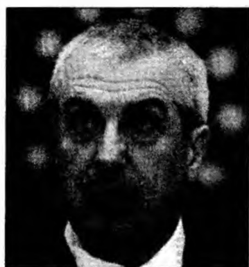
Premierul Tăriceanu amână alegerile pentru PE

Alegerile au fost amânate pentru semestrul al doilea al