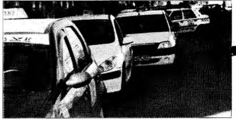
Liberalizarea taximetriei poate produce ambuteiaje