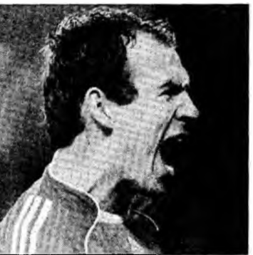
FC Barcelona îl curtează insistent pe olandezul formației Chelsea

promisese în campania electorală că internaționalul olandez va juca pe Santiago Bernabeu, la fel ca alți jucători precum Kaka, Cesc Fabregas, Mahamadou Diarra și Cristian Chivu. Clubul Chelsea cerut atunci FIFA să deschidă o anchetă în legătură cu oferta atacantului olandez Arjen Robben de către președintele Real Madrid.