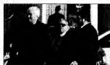
Membrii comisiei