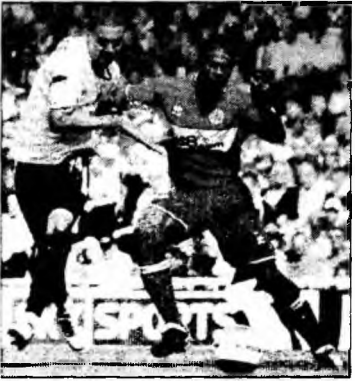
Boateng nu poate uita atmosfera creată de suporterii bucureșteni

Middlesbrough a terminat la egalitate, scor 2-2, meciul cu Manchester United din sferturile Cupei Angliei, iar partida se va rejucala 19 martie.