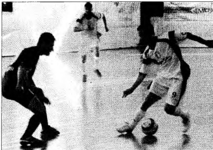
FC CIP a rămas lider autoritar

Constanța - Campioana României, FC CIP Deva, defilează autoritar în campionatul intern, dovadă că și-a continuat seria victoriilor în Liga I de futsal, câștigând lejer partida disputată, ieri, în deplasare, cu FM Constanța. Scenariul meciului de pe litoral a fost similar cu orice joc al FC CIP în prima ligă, devenii dominând autoritar și impunându-se fără probleme, deși echipa din Constanța este considerată una dintre formațiile de prim rang ale competiției naționale.