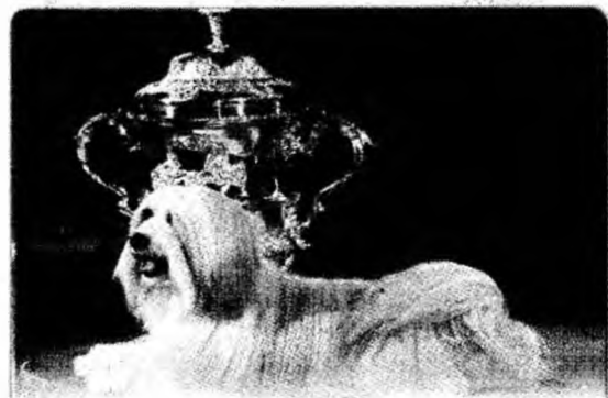
Câștigător „Araki Fabulous Willy”, așa se numește un terrier tibetan care a câștigat premiul pentru „cel mai bun show” la expoziția canină Crufts 2007, de la Birmingham.

Paris (MF) - O serie specială de zece timbre cu portretele protagoniștilor din seria „Harry Potter” - Ron Weasley, Harry Potter și Hermione Granger - va fi pusă în circulație grație unui proiect comun al Poștei Franceze și al companiei de producție Warner Bros. Consumer Products. Colecția, care costă 6,18 euro, a fost prezentată în premieră la Festivalul Poștei Franceze care a debutat la sfârșitul săptămânii trecute.