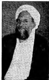
Ayman al-Zawahiri

Diyala a devenit deja un centru al violențelor zilnice, forțele americane și irakiene confruntându-se cu o amenințare sunnită în creștere, care i-a pus în dificultate pe liderii šiiti ai provinciei.