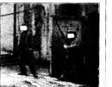
Mineri la ieșirea din șut