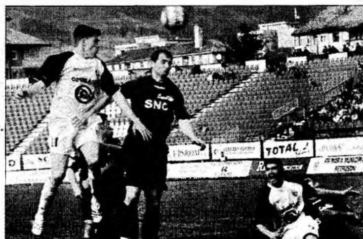
Partida Jiul - Farul se anunță încrâncenată

"Ambele echipe au nevoie de victorie și totul va fi o luptă contra cronometru. Sunt convins că jocul va fi unul încrâncenat, dar și echilibrat. Noi jucăm pe teren propriu și trebuie să luăm cele trei puncte pentru că avem nevoie de ele ca de aer. Farul este un adversar dificil care nu merită să fie pe locul care este", a explicat tehnicianul. Și antrenorul marinariilor, Basarab Panduru, știe că-l așteaptă un examen dificil. "Va