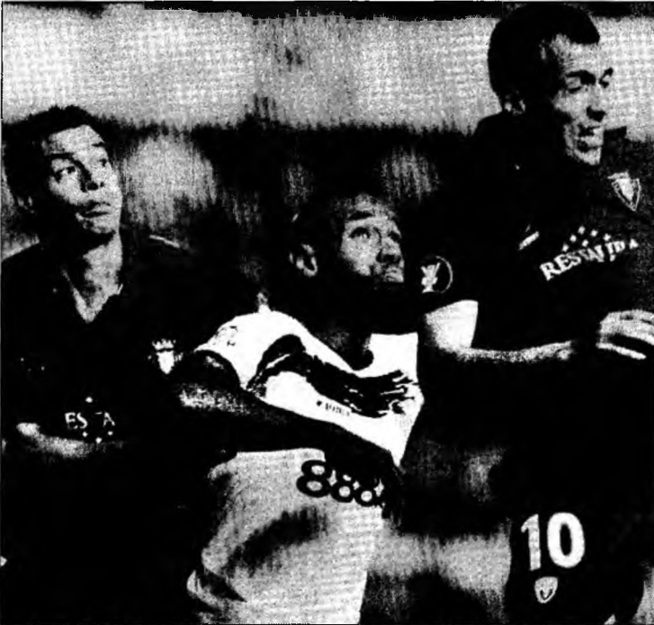
Jucătorii de la Osasuna au fost peste cel de la Sevilla