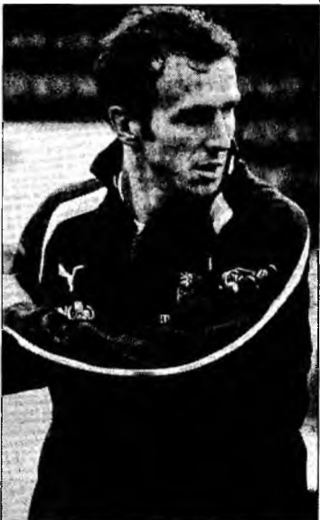
Karel Poborsky

El s-a retras din echipa națională în luna iulie, după eliminarea Cehiei în primul tur al Cupei Mondiale din Germania.