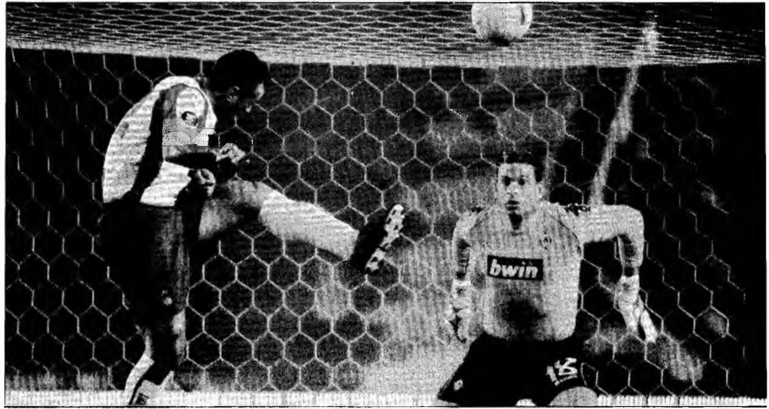
Spaniolii au fost, mai tot timpul, în fața porții adverse

„Am făcut un meci foarte bun, dar în fotbal greșelile sunt hotărâtoare și ei au făcut prea multe. Am obținut un rezultat mare împotriva unei echipe excelente, dar nimic nu este hotărât. În acest sezon am făcut eforturi mari în Cupa UEFA și avem o motivație deosebită. Am înscris goluri și suntem o echipă organizată. Când conduceam cu 2-0, am făcut un joc tactic și știam că de fiecare dată când adversarii noștri pierdeau mingea îi puteam surprinde pe contraatac. Nu vrem să fim foarte încrezători, totuși,