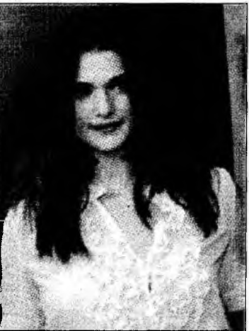
Rachel Weisz și Adrien Brody