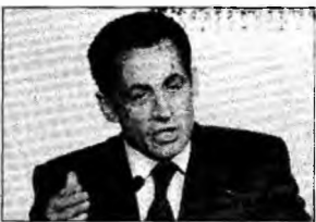
Nicolas Sarkozy

Londra (MF) - Cancelarul german Angela Merkel, președintele Comisiei Europene Jose Manuel Barroso și premierul britanic Tony Blair au discutat ideea unui parteneriat strategic cu Nicolas Sarkozy, candidatul de dreapta la alegerile prezidențiale franceze, relatează Financial Times. Liderii celor trei state consideră că Sarkozy este persoana cea mai potrivită pentru a readuce o Franță reformată în acord cu principala tendință politică, transformând această țară în cel de-al patrulea membru al unui puternic grup de state modernizatoare.