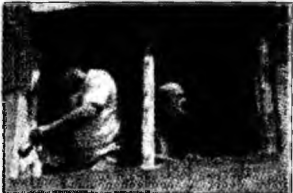
În construcții vor fi slujbe vacante

București (C.P.) - Numărul de angajați din companii va crește în toate domeniile în perioada aprilie-iunie estimează managerii chestionați recent de INS. Industria rămâne singurul domeniu în care numărul de salariați va stagna. Managerii din construcții anticipează, pentru următoarele trei luni, o creștere cu 28%. Angajatorii prognozează o tendință de ușoară creștere cu 10% a numărului de salariați în sectorul de comerț cu amănuntul. Managerii estimează o creștere a numărului de salariați în următoarele trei luni cu 13% în sectorul serviciilor.