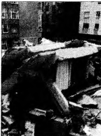
Se caută printre dărâmături

Primarul orașului a anunțat că lângă blocul prăbușit se desfășurau lucrări de demo-