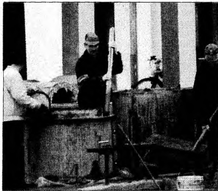
Tuburile de beton au adus 10000 de lei bugetului local