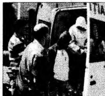
Agresorii au fost prezentați justiției

ceilalți doi, prinși ieri dimineață, au mandate de arestare pentru 29 de zile.