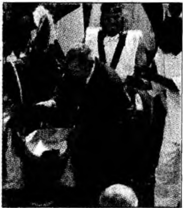
Bush bate toba

Africa. „America este o țară care oferă mâncare celor săraci, medicamente celor bolnavi și protecție celor amenințați. Pentru că așa e bine. Ziua de combatere a malariei îmi oferă ocazia să le mulțumesc americanilor care au făcut donații pentru această cauză și să-i îndemn și pe ceilalți să facă același lucru”, a susținut George W. Bush.