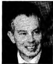
Tony Blair