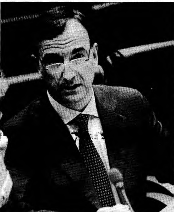
Comisarul pentru Justiție, Franco Frattini, acuzat că s-a apropiat prea mult de țările pe care le monitorizează

Ambasadorii europeni au denunțat că evaluarea publică a lui Frattini privind progre-