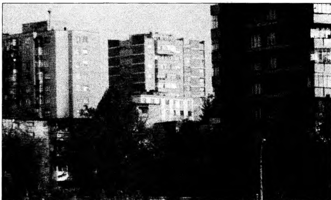
Opinia hunedorenilor este importantă