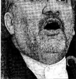
Manouchehr Mottaki

Sharm el-Sheikh (MF) - Experti iranieni și americani s-au întâlnit, ieri, în stațiunea egipteană Sharm el-Sheikh, cu ocazia conferinței internaționale pe tema Irakului, a declarat ministrul irakian de Externe, Hoshyar Zebari.