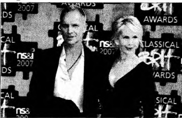
Sting a fost învins de Mc Cartney

Londra (MF) - Starul muzicii pop Paul McCartney a fost recompensat cu premiul Classical Brit pentru cel mai bun album, „Ecce Cor Meum” (Behold My Heart), într-o ceremonie care a avut loc joi, la Royal Albert Hall din Londra, informează Reuters. Paul McCartney l-a învins astfel pe un alt star al muzicii pop/rock, Sting, care fusese nominalizat pentru albumul „Songs from the Labyrinth”. Albumul „Ecce Cor Meum” este cel de-al patrulea album de muzică clasică în limba latină compus de