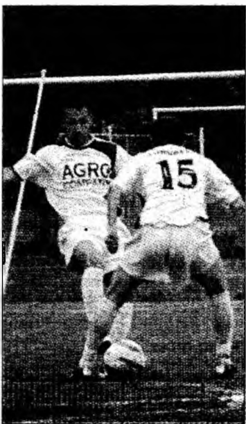
Derby-ul primelor clasate a dezamăgit

Deva (C.M.) - Partida dintre primele două clasate în seria a V-a a Ligii a III-a, Mureșul Deva (locul 2) și Arieșul Turda (locul 1), desfășurată ieri la Deva, a dezamăgit. Programat într-un moment în care situația în vârful clasamentului nu mai putea fi schimbată, derby-ul a fost lipsit de miză și de calitate. Cele două frunțase ale clasamentului s-au complăcut într-un joc anost, lipsit de orice velleitate spectaculară, fazele de poartă fiind foarte, foarte rare. În aceste condiții de joc plictisitor, una dintre preocupările spectatorilor a fost răspunsul la întrebarea dacă merită Arieșul să promoveze și Mureșul să joace baraj pentru eșalonul secund. Poate că da, dar nu după cum s-au prezentat la acest derby.