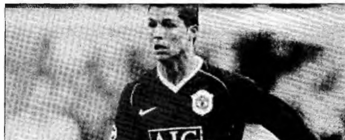
Cristiano Ronaldo e - din nou - cel mai bun

Londra (MF) - Fotbalistul echipei Manchester United, Cristiano Ronaldo, a fost desemnat jucătorul anului în Anglia și de Asociația Jurnaliștilor de Fotbal (FWA), la aproape două săptămâni după ce a primit o distincție similară din partea Asociației Fotbaliștilor Profesioniști (PFA).