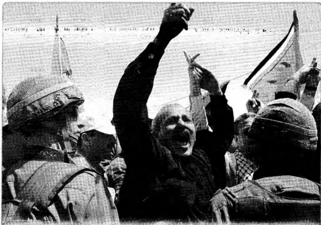
Violențe între polițiștii israelieni și sutele de protestatari palestinieni s-au iscat ieri, lângă Bethleem. Violențele. Palestinenii au demonstrat din nou împotriva ridicării zidului de separație pe care Israelul susține că îl ridică pentru propria protecție.

Potrivit recentelor sondaje de opinie, peste două-treimi dintre israelieni cred că Olmert și Peretz ar trebui să demisioneze.