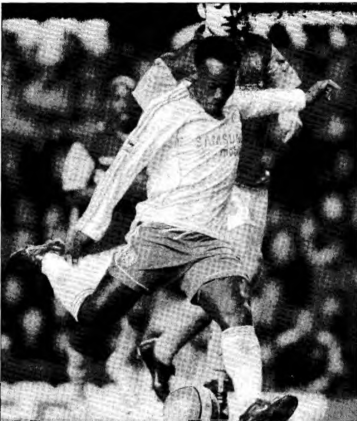
Essien se ocupă doar de fotbal, nu și de alcool