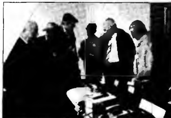
Radioamatorii din 15 județe se vor întâlni la Deva

noastră rubrică în cadrul programului, și anume faza județeană a „Campionatului Național de Creație Tehnică”. Pe lângă toate acestea, radioamatorii vor prezenta și două rețele pentru situații de urgență. În această perioadă, în județ se desfășoară și „Cupa Decebal” la radiogoniometrie, sau vânătoarea de vulpi, așa cum e cunoscut concursul de cei din branșă.