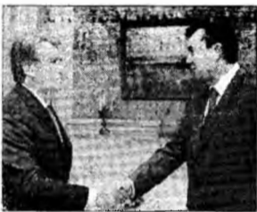
Iușcenko și Ianukovici

Kiev (MF) - Președintele ucrainean Viktor Iușcenko a anunțat ieri că a obținut un acord cu adversarul său politic, premierul Viktor Ianukovici, pentru organizarea de alegeri legislative anticipate. Ucraina este afectată, timp de o lună, de o criză politică gravă, generată de dizolvarea Parlamentului, decisă de Iușcenko și contestată de Ianukovici.