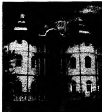
Castelele au două-trei nivele