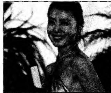
Jeon do-Yeon, premiul pentru rol feminin