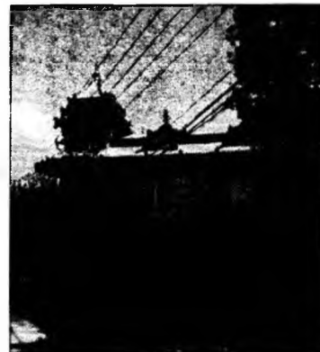
Au acoperiș cu turnulețe