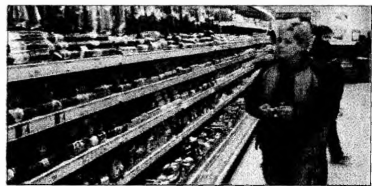
Promoțiile supermarket-urilor atrag cumpărătorii economi