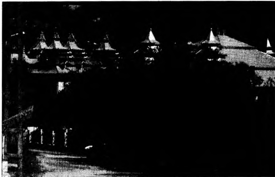
Cartierul cu palatele romilor de la Hășdat

Toate palatele aparțin nepoților bulibașei, care deși e „șef” continuă să trăiască într-o casă modestă. Clădirile, deși nefinalizate, sunt impunătoare prin dimensiuni. Cât au cheltuit nepoții săi pentru ridicarea palatelor nu știe, „dar sunt tare scumpe! Mai trebuie tencuite și adus mobilierul. Fiecare palat are