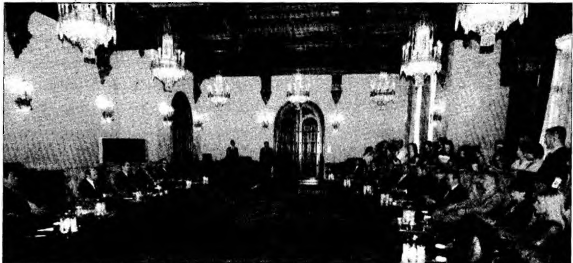
Președintele Traian Băsescu și delegația Partidului Democrat, la Palatul Cotroceni

Ierusalim (MF) - Shimon Peres, un veteran pe scena politică din Israel, va fi candidatul din partea partidului de centru Kadima la alegerile prezidențiale, a anunțat ieri premierul israelian Ehud Olmert. Peres, în vârstă de 83 de ani, își va prezenta candidatura oficială cel târziu la 3 iunie, alegerile prezidențiale urmând să se desfășoare la 13 iunie. Peres, deținător al premiului Nobel pentru Pace, este în prezent numărul doi în Cabinetul Olmert, după ce a deținut funcția de premier și decanul de vârstă al Parlamentului. Dacă își va confirma candidatura, el îi va succeda în funcție lui Moshe Katzav, al cărui mandat de șapte ani se va încheia în iulie.