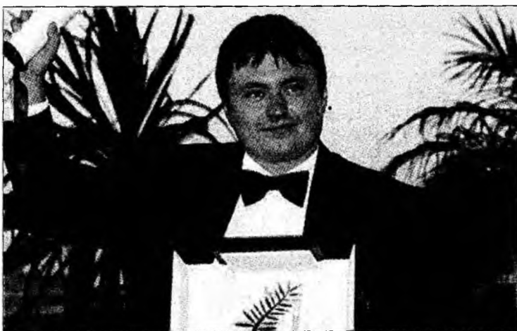
Cristian Mungiu a crezut foarte mult în acest proiect

■ Regizorul Cristian Mungiu a câștigat cel mai important premiu din istoria filmului românesc.