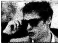
Brad Pitt

Los Angeles (MF) - Actorul Tom Cruise a vizionat recent un avion de luptă de tipul Mustang P-51, din timpul celui de-al doilea război mondial, pentru care trebuie să plătească 2,6 milioane de euro. Un prieten care l-a însoțit la aeroportul din Burbank, California, unde se află un alt avion al actorului, a declarat că Tom părea bucurat ca un copil care are o nouă jucărie. Actorul mai are un avion de vânătoare cu elice de tipul P-51 „Mustang” fabricat în 1943, care a fost restaurat, și un avion pentru cascadorii de tipul Pitts Special S-2B.