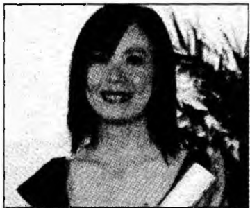
Naomi Kawase, marele premiu

facultății a fost asistent de regie la diverse producții străine turnate în România. După absolvire, în 1998, a regizat el însuși scurtmetraje, iar primul lui lungmetraj, „Occident”, a avut premiera la Cannes în 2002, în secțiunea Quinzaine des Réalistes. Acest film a primit, printre altele, premiul publicului la Festivalul de la Salonice, premiul FIPRESCI la Sofia, Marele Premiu al Festivalului de la Mons, Belgia, și cinci distincții din partea Uniunii Cineaștilor din România. „Occident” i-a adus regizorului Premiul Prometheus pentru Opera Prima în 2003. A fondat casa de producție Mobra Film în 2003, împreună cu Oleg Mutu și Hanno Hofer. Mungiu a mai realizat scurtmetrajul „Curcanii nu zboară” inclus în filmul „Lost and Found” (ce a avut premiera la Berlinale în 2005), a fost producător executiv la „Offset” (regia Didi Danquart) și și-a făcut un