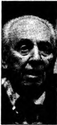
Shimon Peres (Foto: EPA)

Sub asediu Soldați libanezi în tabăra de refugiați palestinieni din Nahr al-Bared, nordul Libanului. Armata libaneză continuă atacurile asupra milițiilor islamiste din tabără. (Foto: EPA)