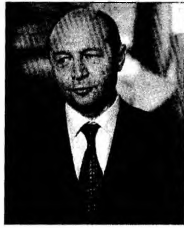
Președintele Traian Băsescu se va adresa mâine plenului Parlamentului

Până acum, Parlamentul nu a dat un răspuns la solicita-