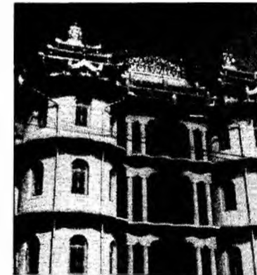
Tâmplăria este din lemn masiv sau din aluminiu cu termopan