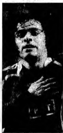
Fabrizio Miccoli