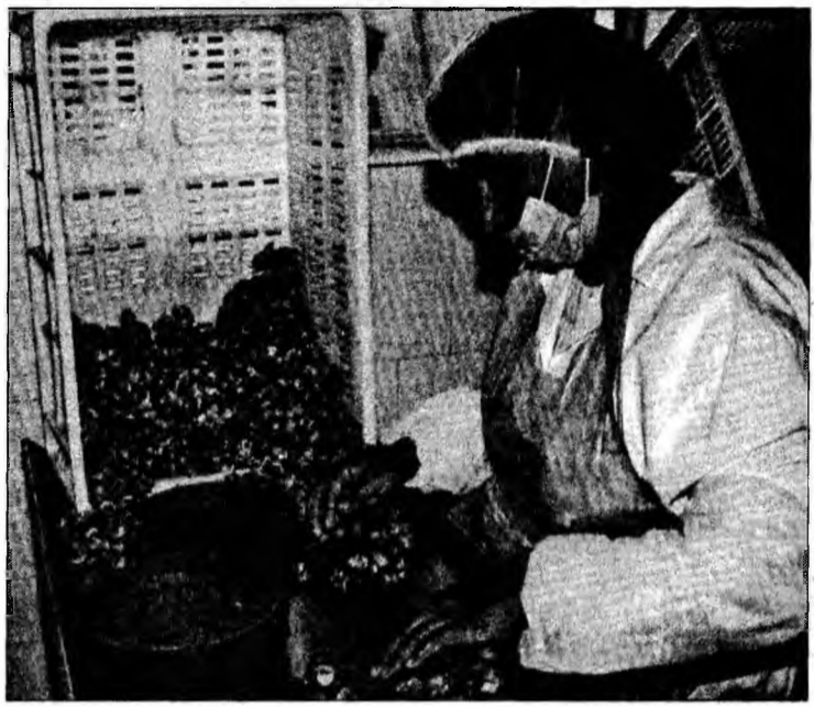
Melcii sunt sortați manual

Carnea de melc este transportată apoi pe alte mese de prelucrare, se îndepărtează aparatul digestiv și organele interne ale melcului, cu ajutorul unui foarfece special. În