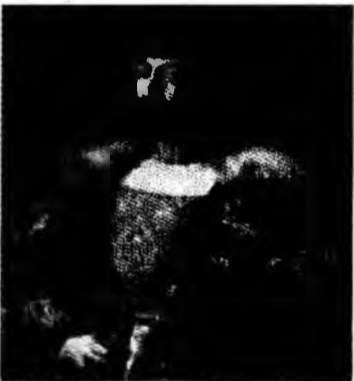
Pictura lui Rafael

Londra (MF) - O pictură a artistului renascentist Raphael a fost vândută la prețul record de 18,5 milioane de lire ster-