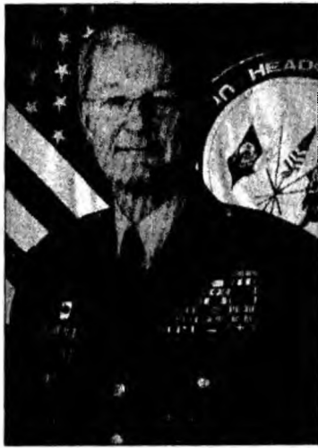
Generalul John Craddock

El a mai spus, referindu-se la transformarea armatei Ro-