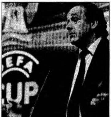
Forul prezidat de Michel Platini a dat dovadă de clemență

„Suntem parțial mulțumiți. Sunt sigur că majoritatea suporterilor danezi împărtășește frustrarea noastră, pentru că nu putem să jucăm toate partidele pe Parken din cauza comportamentului stupid al unei singure persoane”, a declarat secretarul general al fotbalului danez, Jim Stjerne.