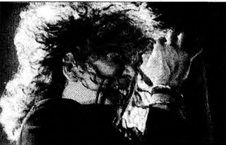
Robert Plant a mai concertat în România în 1998

București (MF) - Robert Plant va sosi azi după amiază pe aeroportul Henri Coandă, cu un avion particular. Cântărețul englez este faimos mai ales ca membru al legendarii trupe rock Led Zeppelin, dar și pentru cariera sa solo. Pentru concertul din România, el a cerut organizatorilor să îi fie puse la dispoziție mai multe borcane cu miere, pentru protejerea vocii. El va pleca din România luni, urmând ca marți să susțină un concert la Budapesta. Concertul lui Robert Plant face parte dintr-un