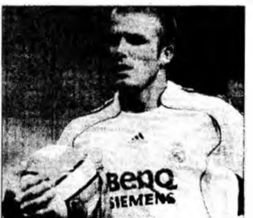
David Beckham a reprezentat o super-afacere pentru clubul Real Madrid

Beckham a fost unul dintre „galacticii” creați de fostul președinte al clubului, Florentino Perez.