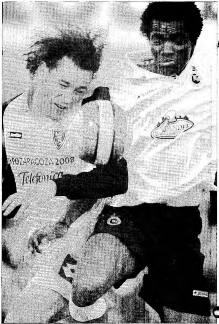
Catalanii vor neapărat să se „blindeze” cu Milito în linia defensivă, unde au dat semne de slăbiciune în campionatul trecut.

Jurnalul Sport notează că Rijkaard și Begiristain sunt convinși că un cuplu de fundași centrali format din Puyl și Milito impune respect.