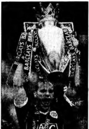
Rio Ferdinand