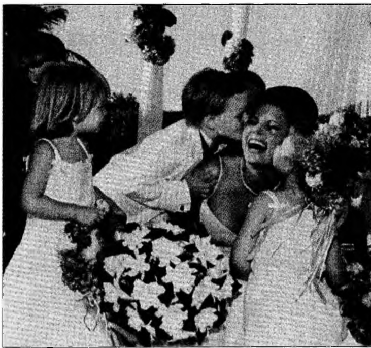
Miri și-au ales o zi norocoasă pentru căsătorie