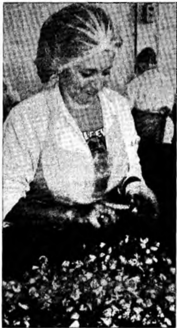
Se efectuează decochilarea