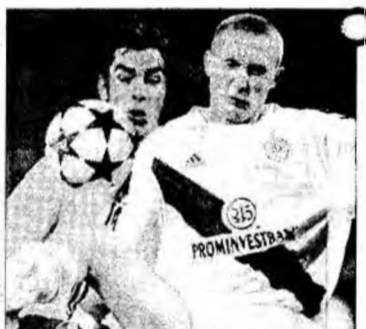
Jucătorul echipei Dinamo Kiev a marcat unul din cele șase goluri ale ucrainenilor

Dorinel Munteanu a declarat că nu este supărat, dar așteaptă mai mult de la elevii săi.