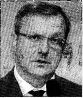
Olli Rehn

Bruxelles (MF) - Comisarul european pentru Extindere, Olli Rehn, a avertizat Franța să evalueze cu atenție consecințele continuării dezbaterii pe tema aderării Turciei la UE. „Cine demarează o nouă dezbateră ar trebui să ia în calcul toate consecințele posibile”, a afirmat Rehn într-un interviu din Financial Times Deutschland. Comentariul lui Rehn face referire la intenția președintelui francez, Nicolas Sarkozy, de a declanșa o dezbateră pe tema granițelor finale ale Uniunii, programată pentru decembrie. Sarkozy a explicat de mai multe ori că se opune aderării Turciei la UE, precizând că o amplă analiză a subiectului este „inevitabilă”.