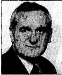
Bertie Ahern