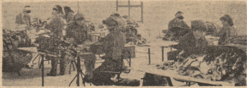
Fabrica „Vidra” Orăștie. Noua secție din Hunedoara — atelierul de croit.