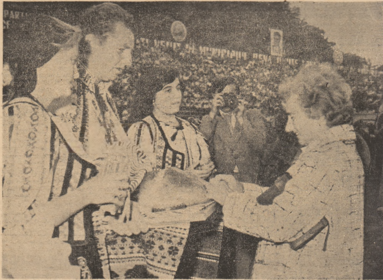
În mijlocul oamenilor muncii hunedoreni.

Înconjurînd cu profundă căldură copiii, tineretul, femeile, fiind mereu un luminos îndemn și călăuză, tovarășa Elena Ceaușescu marchează prin personalitatea sa epoca pe care o trăim. Numele său este rostit și aici, pe pămîntul Hunedoarei socialiste, cu respect și afecțiune pentru exemplara viață de luptă și muncă dedicată ctitoriei unei României demne și prospere.