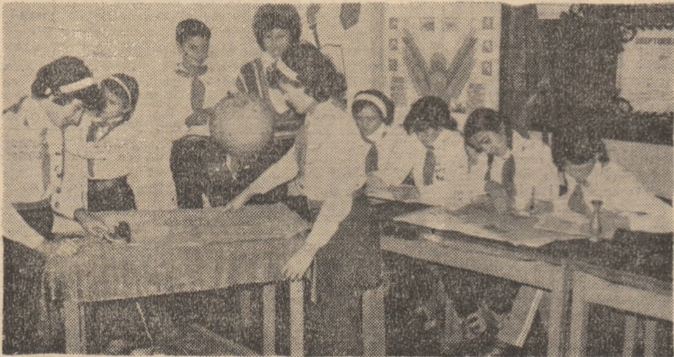
Orientare turistică — etapa în cabinet, cu elevi al școlilor generale nr. 1 și nr. 2 din Hațeg, membri ai cercului de turism de la casa pionierilor și șoimilor patriei din localitate.