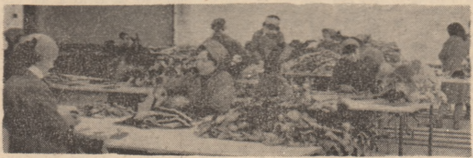
„Vidra” Oraștie, secția Hunedoara. Atelierul croit.