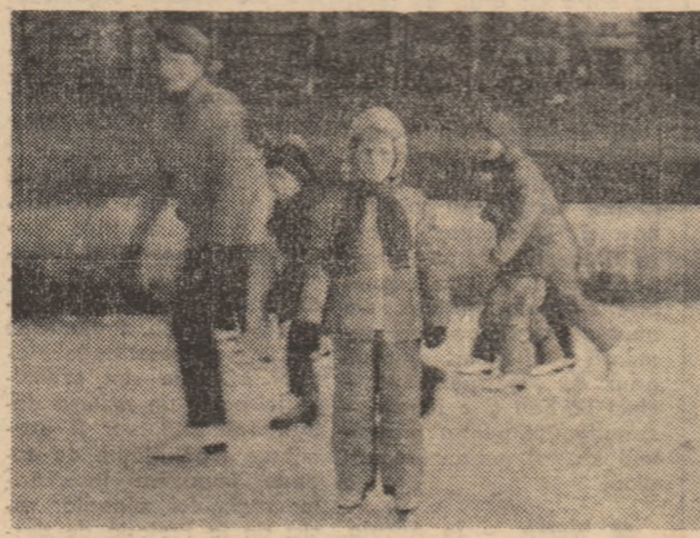
Zilnic, în vacanța de iarnă, zeci de elevi și-au petrecut clipe plăcute, de desîndere și recreere la patinoarul artificial „Corvinul” din Hunedoara.