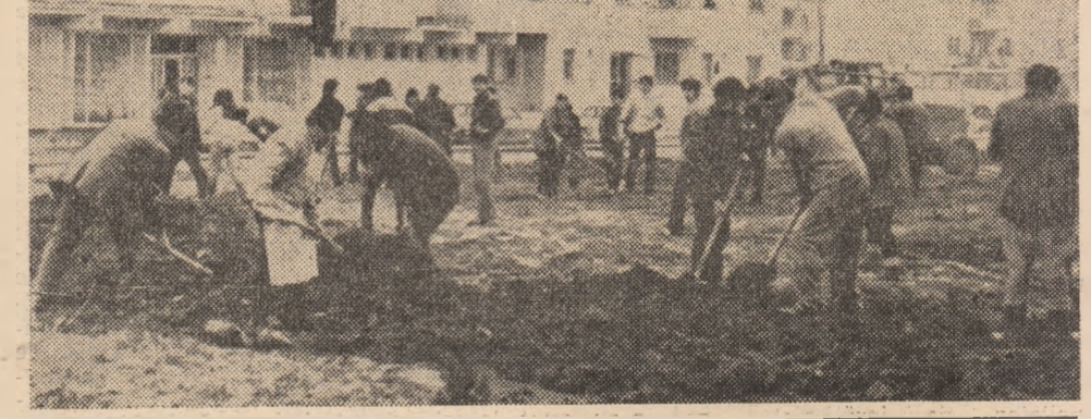
Elevii Liceului agroindustrial din Hațeg îi ajută pe locatarii cartierului „Aurel Vlaicu” la amenajarea zonelor verzi în fața blocurilor.