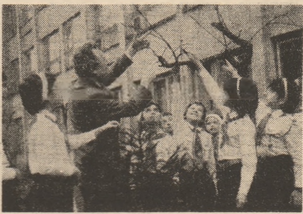
Oră de botanică în grădina Școlii generale nr. 1 Hunedoara.