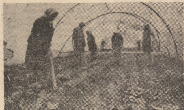
În ferma solară a A.E.S.C.H. Deva se execută lucrările de întreținere la cultura de varză timpurie, pe o suprafață de 5 hectare.