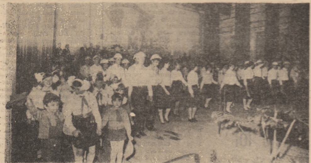
Scenă din spectacolul festiv ce a avut loc la Deva.